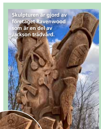
Skulpturen är gjord av företaget Ravenwood som är en del av Jackson trädvärd.