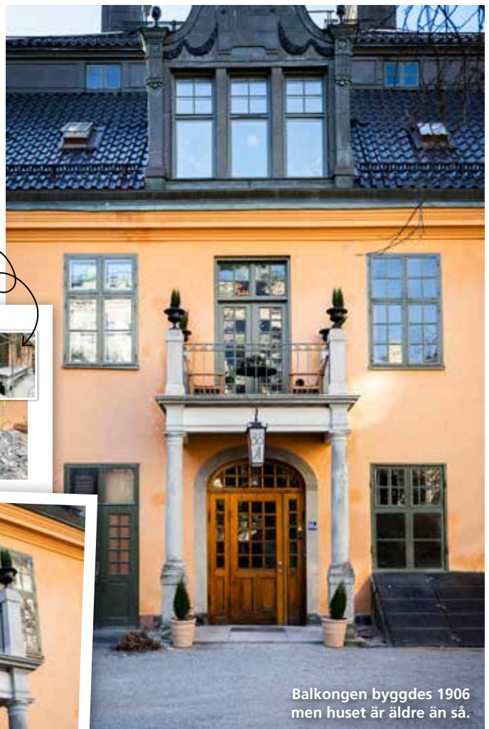
Balkongen byggdes 1906 men huset är äldre än så.

Den renoverade balkongen är i bruk igen. Om du går in på gården vid Centralbadet så ser du den.