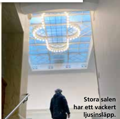
Stora salen har ett vackert ljusinsläpp.