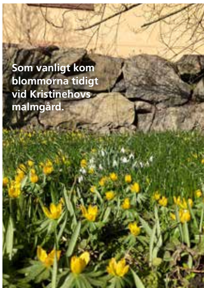
Som vanligt kom blommorna tidigt vid Kristinehovs malmgård.