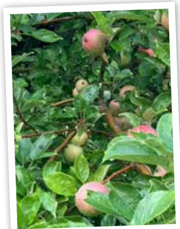
Frukträden beskärs av Stadsholmens entreprenör.