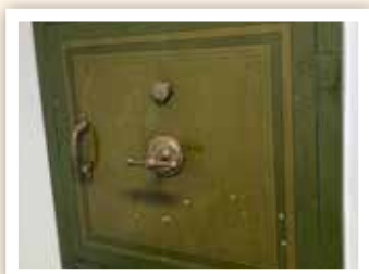
Gamla detaljer från banktiden finns bevarade.