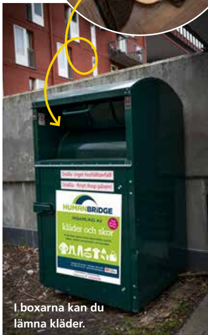
I boxarna kan du lämna kläder.

Du kan återvinna alla typer av kläder och textilier – även hattar, skor, gardiner, kuddar och annat.