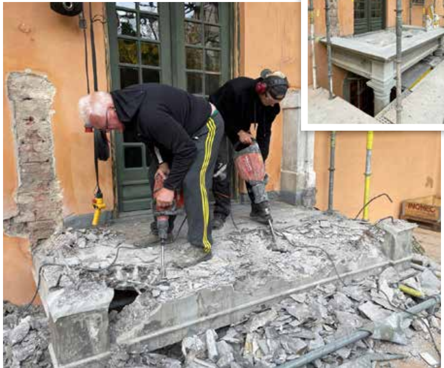
Också sandstenen i balkongens bottenplatta har bytts ut.

Det så kallade Hårlemanska huset ligger i kvarteret Islandet. Paradvåningen i huset renoverades i samråd med Stads-museet för drygt 20 år sedan. Här finns också Centralbadet – som ritades av just Wilhelm Klemming.