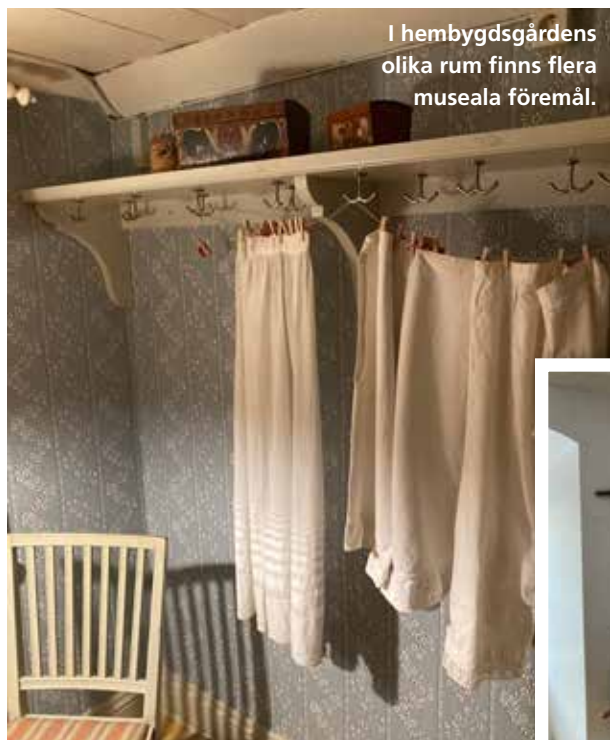
I hembygdsgårdens olika rum finns flera museala föremål.

text: MATS LUNDQVIST