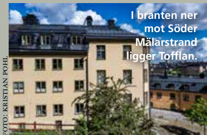
I branten ner mot Söder Mälärstrand ligger Tofflan.

Den 8 juli i sommar påbörjar vi omfattande arbeten i kvarteret Trappan 5 på Mariaberget. I fastigheten blir det nya badrum, kök och ny el. Projektet ingår i Mariabergslyftet och berör adresserna Bastugatan 5 och 7, Maria Trappgränd 4 och Tavastgatan 2 A + B.