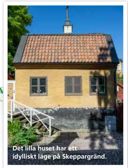
Det lilla huset har ett idylliskt läge på Skeppargränd.

– Helt vansinnigt förstås – men de ansåg att jag var snabbast att springa om det skulle hänt något.