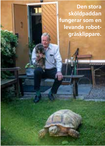
Den stora sköldpaddan fungerar som en levande robot-gräsklippare.