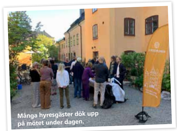
Många hyresgäster dök upp på mötet under dagen.

Stadsholmen har tidigare haft så kallade dialogmöten i bland annat kvarteret Svalgången på Mariaberget. Syftet med dessa möten är att hyresgäster ska kunna möta Stadsholmen under avspända former och prata om stort och smått som rör boendet.