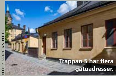
Trappan 5 har flera gatuadresser.