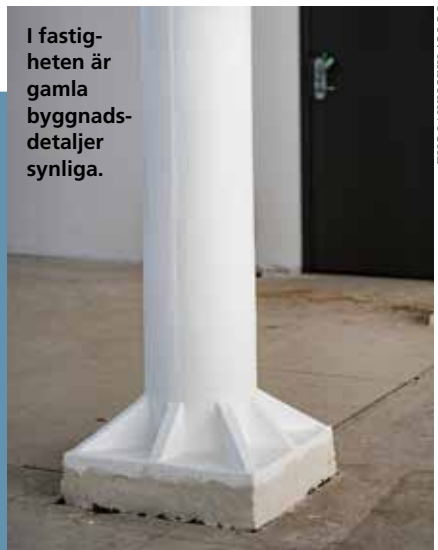
I fastigheten är gamla byggnadsdetaljer synliga.