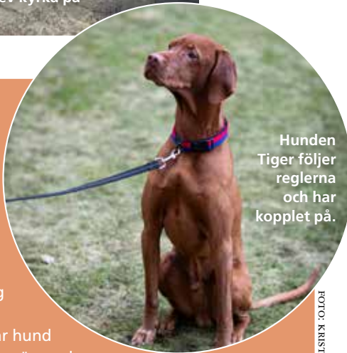
Hunden Tiger följer reglerna och har kopplet på.