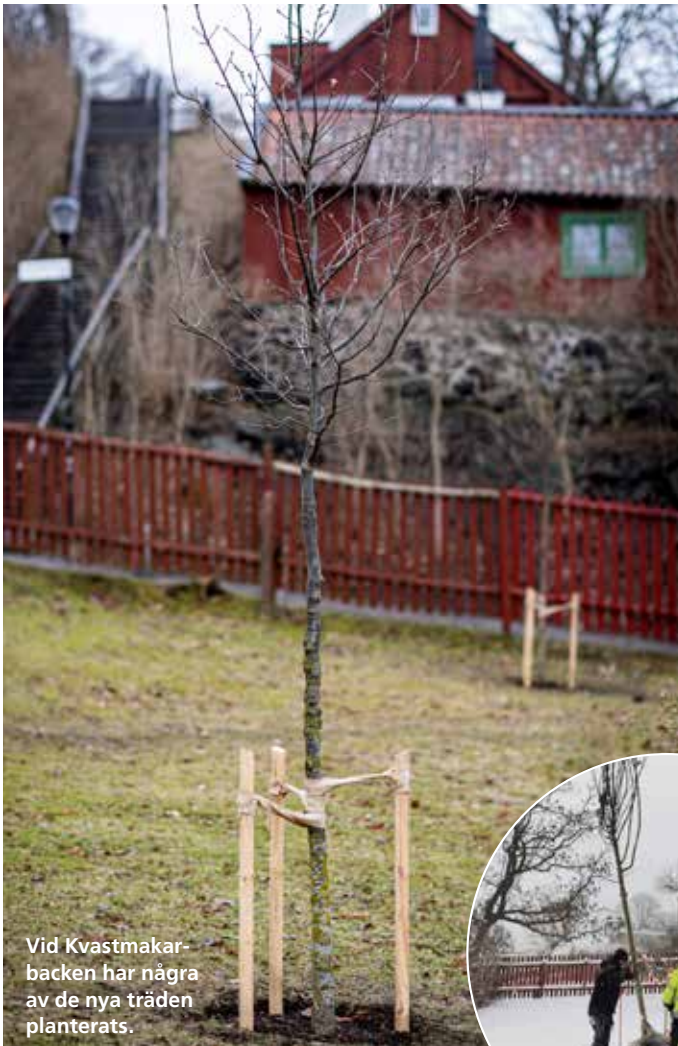
Vid Kvastmakarbacken har några av de nya träden planterats.

TILL HÖGER: På Bastugatan gjordes nyplanteringar av träd under snöovädret i vintras.