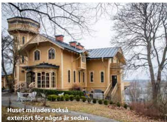
Huset målades också exteriört för några år sedan.