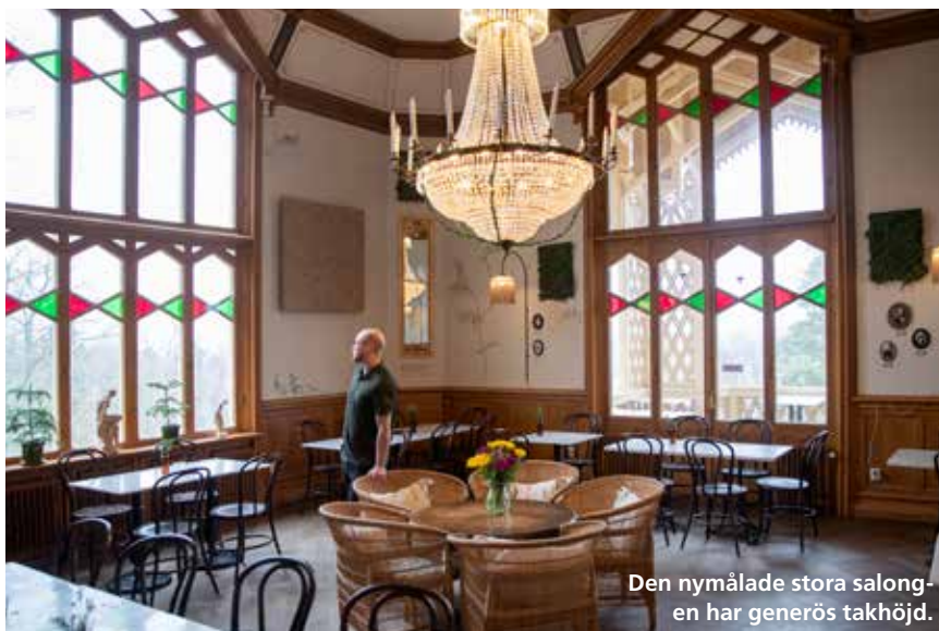
Den nymålade stora salongen har generös takhöjd.

text: MATS LUNDQVIST