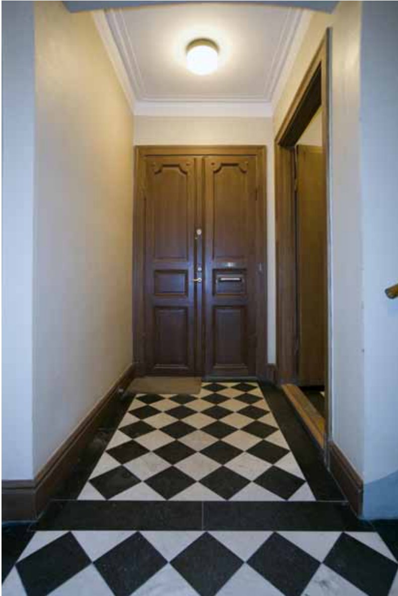
VILPLAN MED GOLV AV MARMOR OCH ÄLDRE PARDÖRRAR. URSPRUNGLIGEN VAR DEN ÖVRE FYLLNINGEN GLASAD.