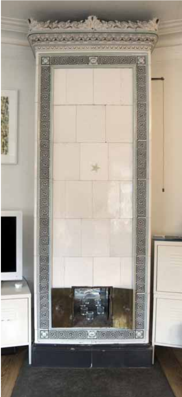
URSPRUNGLIG FLAT KAKELUGN MED MEANDERSLINGA OCH DEKORATIVT KRÖN. FOTO J MALMBERG.

ringledningarna samt värmeledningar i kafél lokalen. Alla lägenheter försågs med ett litet wc. Förändringarna genomfördes av ägaren A V Wincrantz. År 1950 förvärvades fastigheten av staden och ägs numera av Stadsholmen.