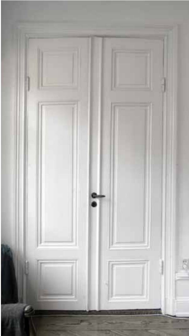
PARDÖRRAR MED TRE FYLLNINGAR FRÅN 1880-TALET.

tullen mindre, hus nr 8 vid barnängsgränd.