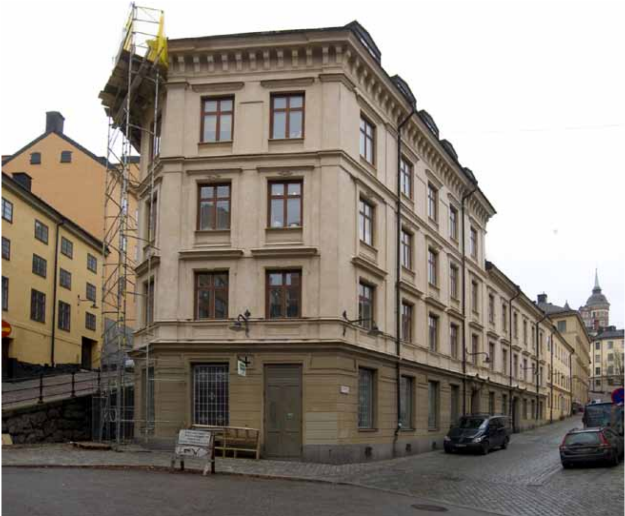
BASTUGATAN 1 A OCH B MED TIDSTYPISKA NYRENÄSSANSFASADER.

helt av putsade tegelhus i enlighet med stadens byggnadsordningar från 1736 och 1763. Tidens kända murmästare fick uppdrag i området och byggherrarna var ofta framgångsrika näringsidkare som både bodde och drev sin verksamhet i de nya husen. Under 1800-talet byggdes en stor del av husen om, och framförallt längs Hornsgatan fick husen påbyggnader och ny fasaddekor. Mot slutet av 1800-talet uppfördes också en del nya byggnader som Mariahissen och Laurinska huset.