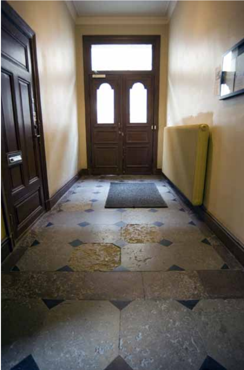
ENTRÉHALL I BASTUGATAN 1A MED URSPRUNGLIGT KALKSTENSGOLV OCH Fyllningsdörrar.

man till traditionell kalkputs och kalkavfärgningar vid fasadrenoveringarna.