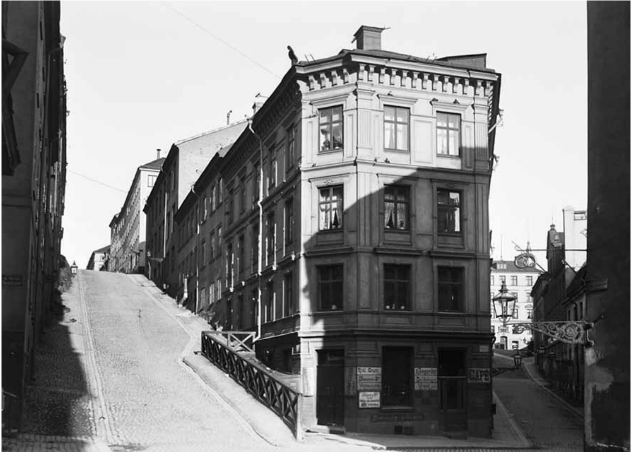
FASTIGHETEN VID HÖRNET AV BRÄNNKYRKAGATAN OCH BASTUGATAN. BILD FRÅN ÅR 1909.(E30102)

Fotangeln 1 består av tre stenhus från 1800-talets andra hälft. Under 1700-talet stod ett färgeri på tomten som under 1860-talet byggdes om- och till mot väster. Detta lade grunden till nuvarande Brännkyrkagatan 10.