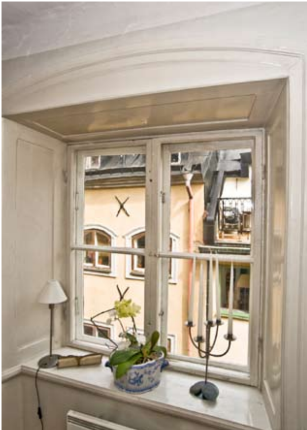
STICKBÄGIG FÖNSTERÖPPNING MED STENPROFILERADE PANELER FRÅN 1800-TALET.