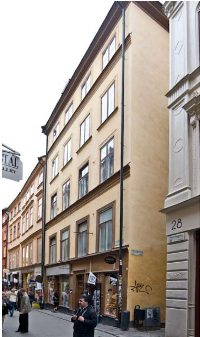
FASAD MOT VÄSTERLÅNGGATAN.

trä eller tegel, ofta med torvtak. Till husen fanns många gånger källare med väggar av natursten och tegelvalv eller bjälktak. Tegelhusens fasader var inte putsade och kunde ha dekor i form av blinderingar, formtegel eller mönstermurning. Den medeltida, oregelbundna stadsplanen är ännu i dag mycket väl bevarad och många hus har i hög utsträckning kvar medeltida murverk bakom senare tiders fasadutformningar och inredningar.