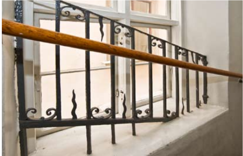
DET SMIDDA RÄCKET I TRAPPLOPPET ÄR FÖRMODLIGEN FRÅN 1700-TALET.

successivt förslummas och många diskussioner fördes om stadsdelens sanitära förhållanden. Det kom till och med förslag om att riva stora delar och bygga helt nytt. När de nya stadsdelarna på malmarna växte fram omkring 1900 blev problemen i Gamla stan ännu mer uppenbara, men de enskilda fastighetsägarna var inte villiga att bekosta saneringarna. Samfundet S:t Erik – som bildades 1901 och arbetade för att väcka intresse för stadens kulturhistoriskt värdefulla miljöer – oroades för stadsdelens framtid och tog på 1930-talet initiativet till att bilda AB Stadsholmen. Det nya bolaget fick i uppdrag att förvärva, restaurera och modernisera bebyggelsen med hänsyn bland annat till kulturhistoriska värden. De första åtgärderna i stor skala genomfördes i kvarteret Cepheus och flera av de genomförda renoveringarna har varit goda exempel, inte minst de allra första insatserna som gjordes.