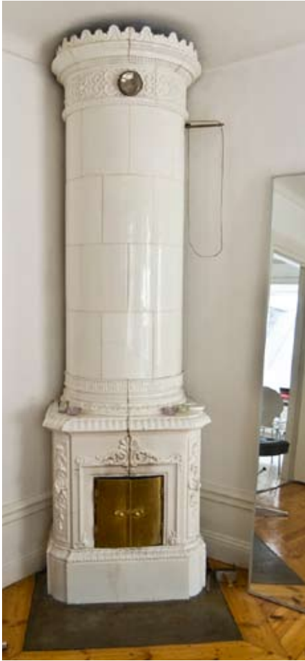
KOLONNKAKELUGN FRÅN 1800-TALET MITT.