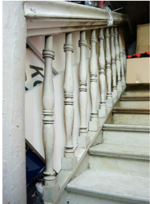
MELLAN BOTTENVÅNINGEN OCH VÅNING 1 TRAPPA FINNS I EN AV BUTIKERNA EN TRAPPA MED SVARVAT TRÄRÄCKE. TRAPPAN TILLKOM UNDER SENT 1800-TAL.

av Iphigenia 1. Över Yxsmedsgränd i söder finns en grändöverbyggnad som idag tillhör grannen Ulysses 5. Delar av överbyggnaden har periodvis tillhört den södra delen av Iphigenia 1.