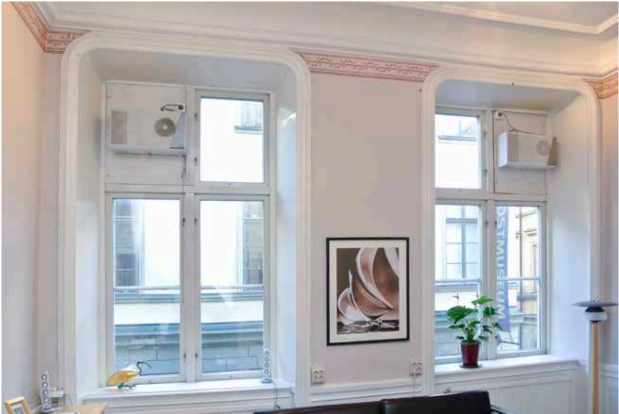
FÖNSTERFODER I ROKOKOSTIL FINNS I MÅNGA RUM MEN FÖNSTERBÅGARNA ÄR UTBYTTA. FÖNSTERNISCHERNA HAR I DE FLESTA FALL INGA PANELER.