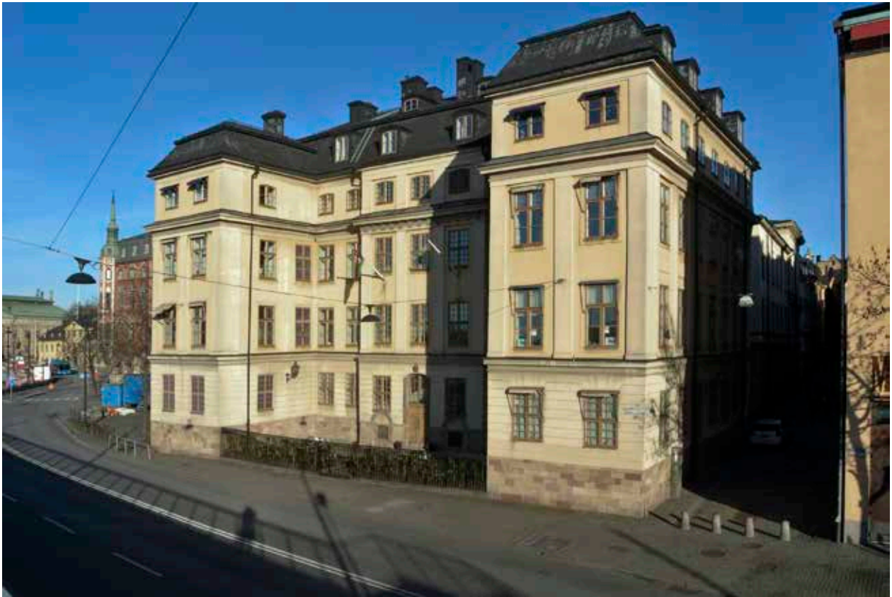
MEMNON 4 SETT FRÅN SYDVÄST. DE TRE NEDRE VÅNINGARNA UPPFÖRDES PÅ 1690-TALET MEDAN DEN ÖVRE TILLBYGGDES PÅ 1760-TALET. NÅGRA AV FÖNSTREN ÄR BLINDFÖNSTER.

gångar källare med väggar av natursten och tegelvalv eller bjälktak. Tegelhusens fasader var inte putsade och kunde ha dekor i form av blinderingar, formtegel eller mönstermurning. Den medeltida, oregelbundna stadsplanen är ännu i dag mycket väl bevarad och många hus har i hög utsträckning kvar medeltida murverk bakom senare tiders fasadutformningar och inredningar.