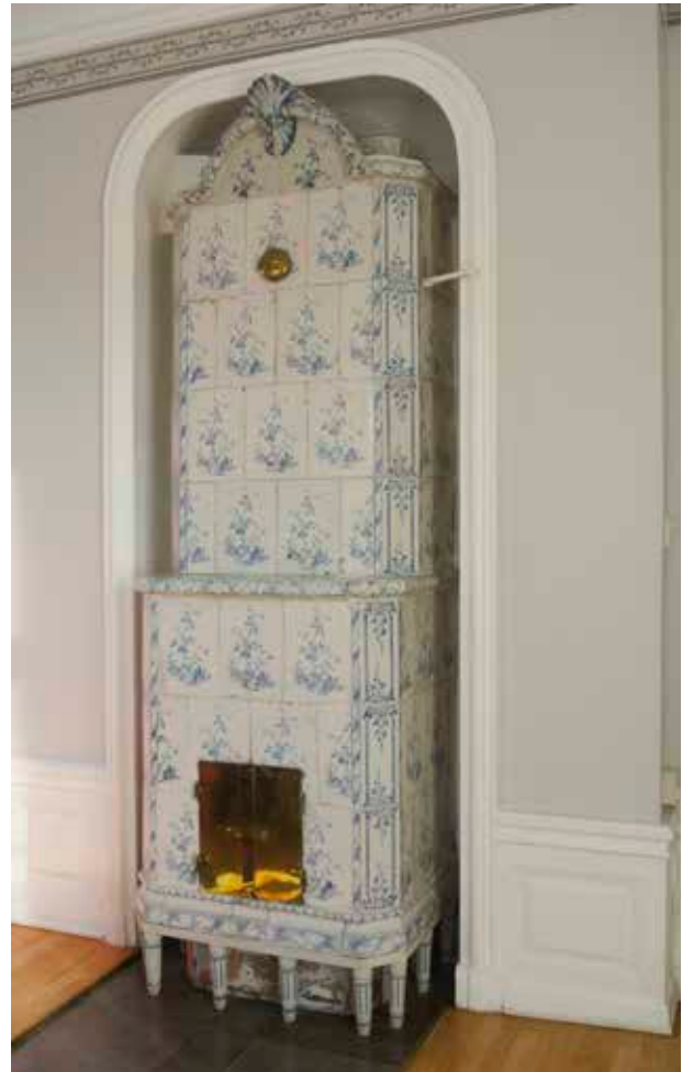
KAKELUGNSNISCHENS FODER LIKSOM DEN HALVFRANSKA BRÖSTPANELEN ÄR I ROKOKOSTIL. KAKELUGNEN FRÅN SAMMA TID ÄR DEPONERAD FRÅN STADSMUSEETS SAMLINGAR OCH KOM URSPRUNGLIGEN FRÅN KVARTERET ÖVERKIKAREN PÅ SÖDERMÅLM.

Under 1900-talets andra hälft har många av