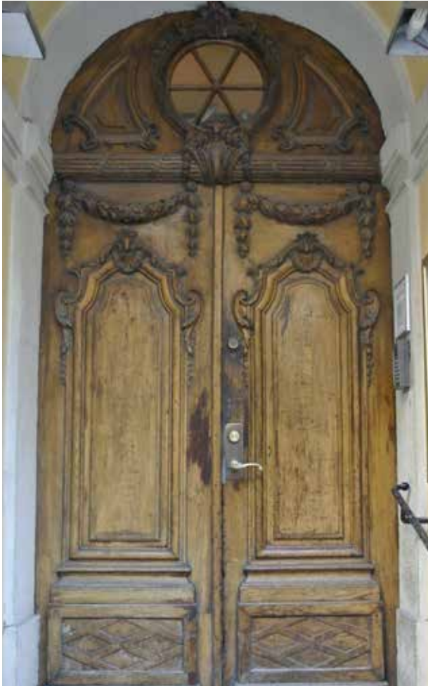
PORTEN VID HUVUDENTRÉN MOT MUNKBROGATAN HAR DÖRRBLAD OCH ÖVERSTYCKE MED RIKT SNIDAD ROKOKODEKOR. DET RUNDA ÖVERLJUSFÖNSTRET HAR URSPRUNGLIGT SPRÖJSVERK.