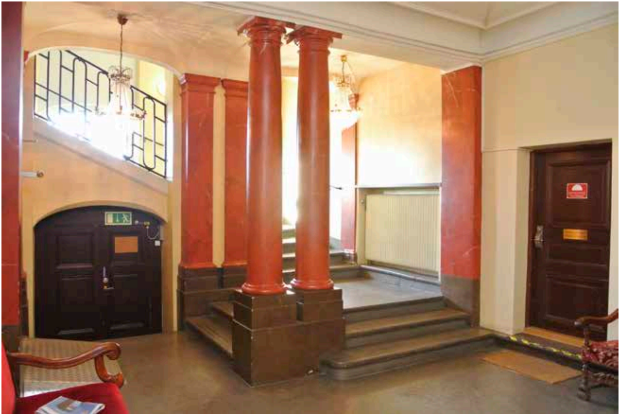
BOTTENVÅNINGENS ENTRÉHALL MED TRAPPLOPP MOT NÄSTA VÅNING OCH TVÅ KOPPLADE KOLONNER. DÖRREN TILL VÄNSTER UNDER TRAPPAN LEDER TILL KÄLLARNA.

för att väcka intresse för stadens kulturhistoriskt värdefulla miljöer – oroades för stadsdelens framtid och tog på 1930-talet initiativet till att bilda AB Stadsholmen. Det nya bolaget fick i uppdrag att förvärva, restaurera och modernisera bebyggelsen med hänsyn bland annat till kulturhistoriska värden. De första åtgärderna i stor skala genomfördes i kvarteret Cepheus och flera av de genomförda renoveringarna har varit goda exempel, inte minst de allra första insatserna som gjordes.