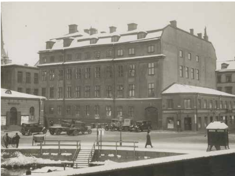
VY FRÅN TORGET VID 1900-TALET S BÖRJAN. DE SJU FÖNSTERAXLARNÄRMÄST MUNKBROGATAN, TILL VÄNSTER I BILD, FINNS ÄNNU KVAR. ÖVRIGA DELAR REVS PÅ 1950-TALET DÅ MUNKBROLEDEN SKULLE DRAS FRAM.