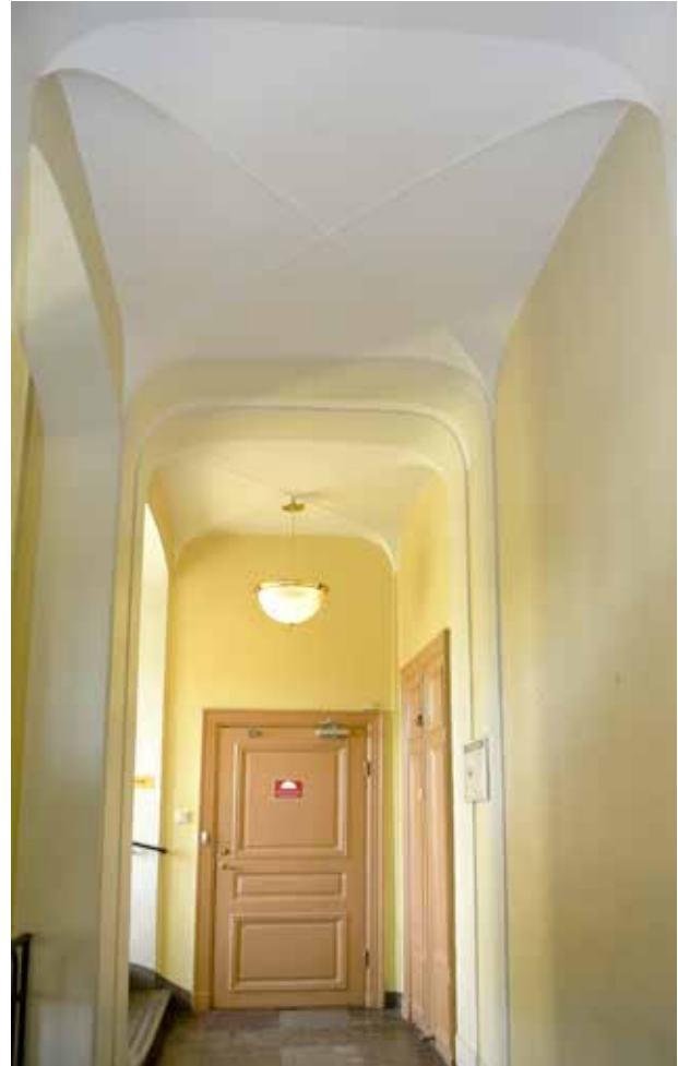
DÖRRBLADEN INNE I Huset ÄR ENKLA OCH AV ROKOKOTYP, MÅNGA ÄR TILLVERKADE PÅ 1950-TALET. DÖRRFODREN ÄR OFTA AV EMPIRETYP LIKSOM NÅGRA PARDÖRRAR.

höga. Taket är ett valmat mansardtak klätt med plåt med flera takkupor i det nedre fallet. Bottenvåningen är rusticerad och putsad med en sockel av sandsten.