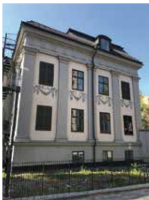
Stadsholmen kommer att visa Reenstiernas malmgård under festivalen.