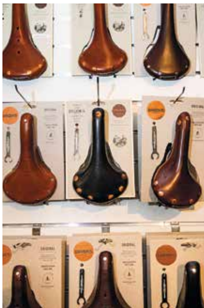
Klassiska lädersadlar samsas på väggarna.

Säkert har du gått förbi Gamla stans cykel. Längre låg butiken på Stora Nygatan. Innanför skyltfönstren skymtade lädersadlar, cyklar i diskreta färger och lite nostalgisaker. Likadant är det idag, men butiken finns nu på gatan bredvid, i Stadsholmens hus på Lilla Nygatan 10.