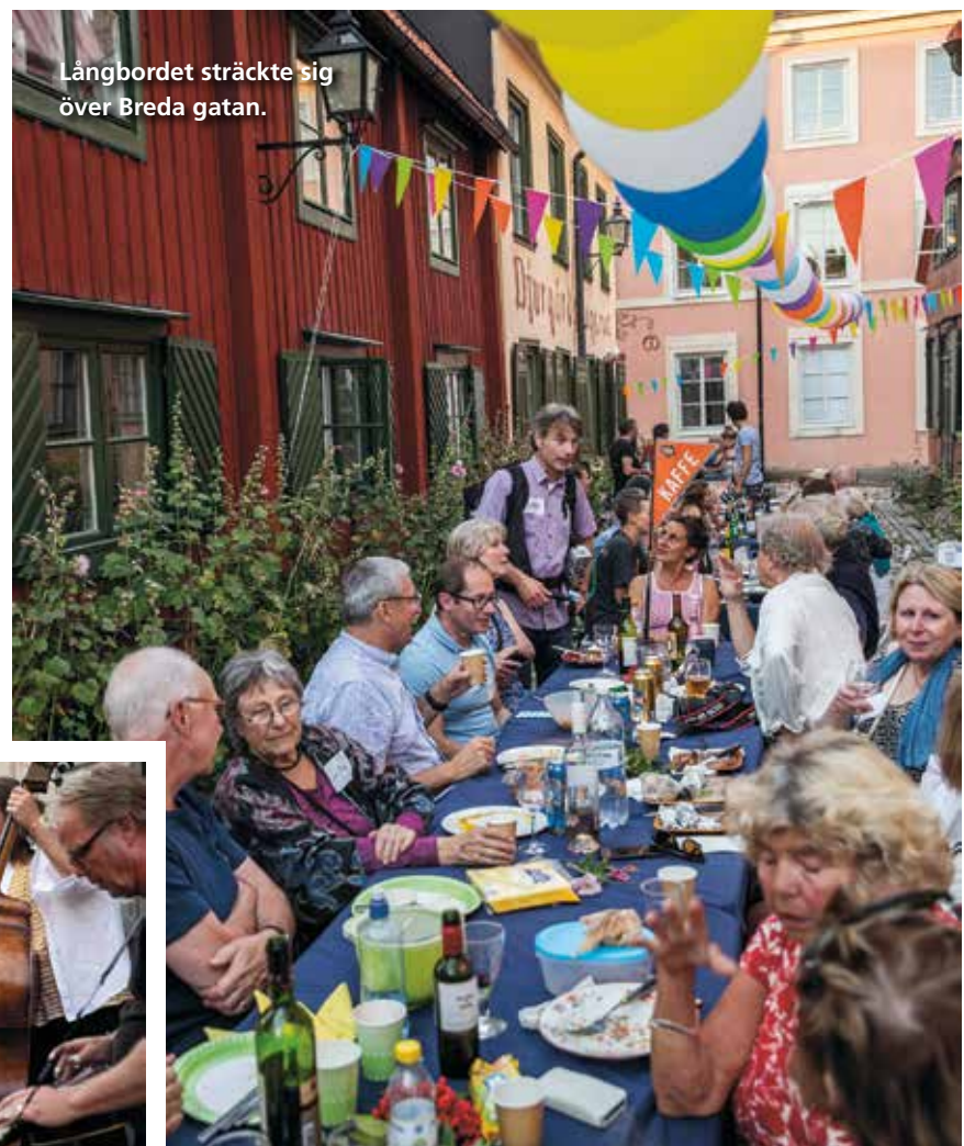
Långbordet sträckte sig över Breda gatan.