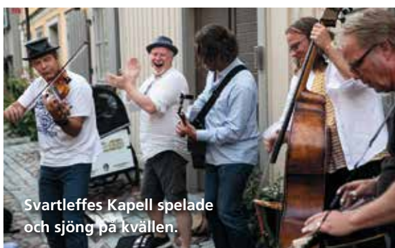
Svartleffes Kapell spelade och sjöng på kvällen.