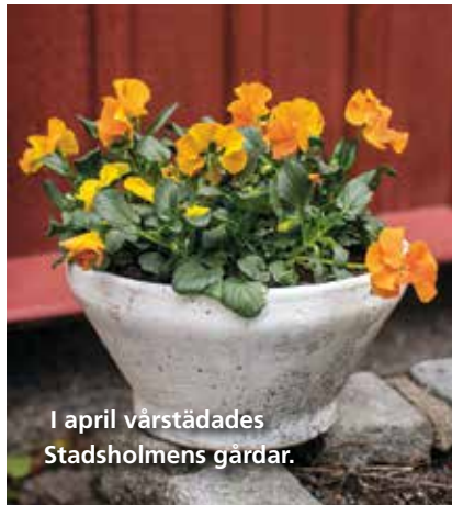
I april vårstädades Stadsbalmens gårdar.