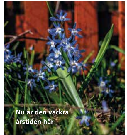
Nu är den vackra årstiden här