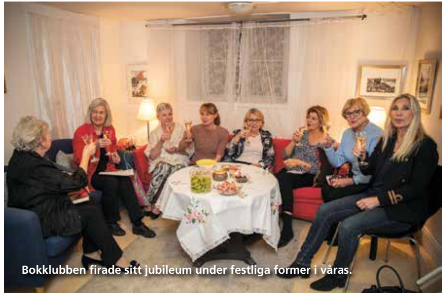
Bokklubben firade sitt jubileum under festliga former i våras.

– Vi har haft en väldigt bredd på det vi läst. Det är intressant att höra hur de