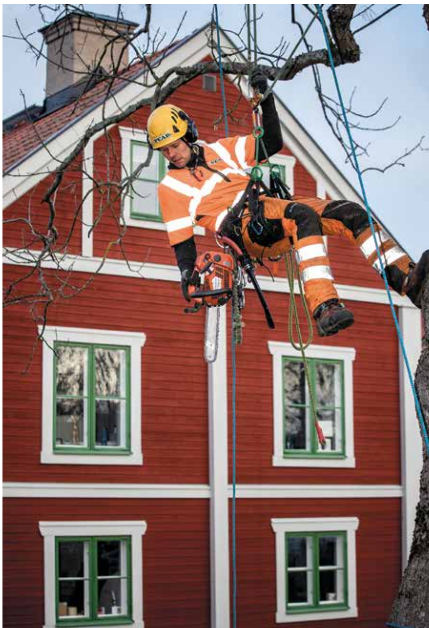
Klättring ingår som en naturlig del i arbetet.

Varje enskilt träd har ett värde i stadsmiljön, detta ligger hela tiden till grund för bedömning om eventuella åtgärder.