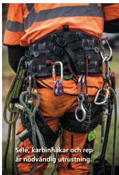
Sele, karbinhakar och rep är nödvändig utrustning.