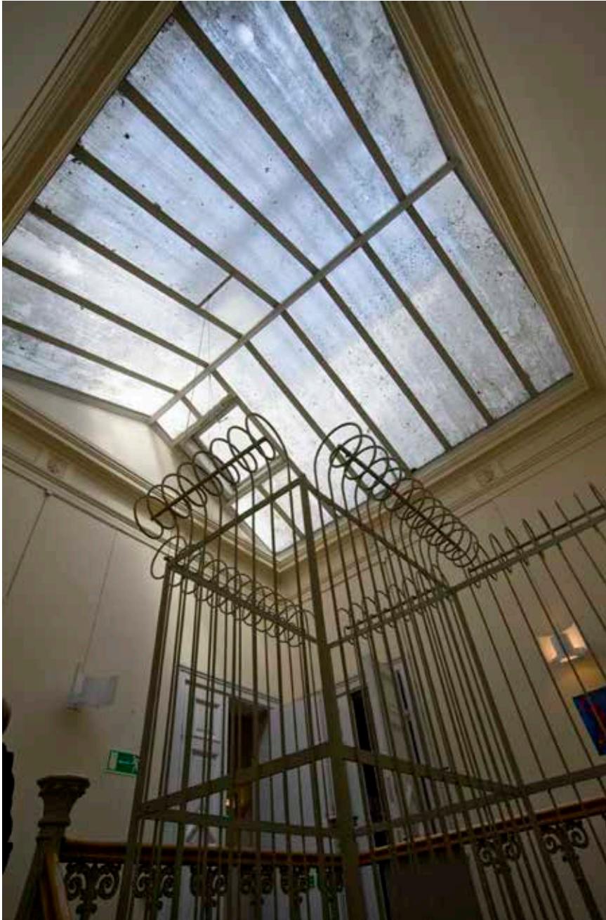
SKOLBYGGNADENS TRAPPHUS MED ÖVERLJUSFÖNSTER OCH DEKORATIVT TRAPPRÄCKE AV GJUTJÄRN.

en trevånig länga med 15 fönsteraxlar mot Regeringsgatan och fem mot Brunnsgatan. Våningarna avdelas av kraftiga putslistor och takfoten är dekorativt utformad. Fönstren i de två övre våningarna är rundade och i mellenvåningen omges de av dekorativa fönsteromfattningar av puts. De två entréerna markeras genom släta omfattningar.