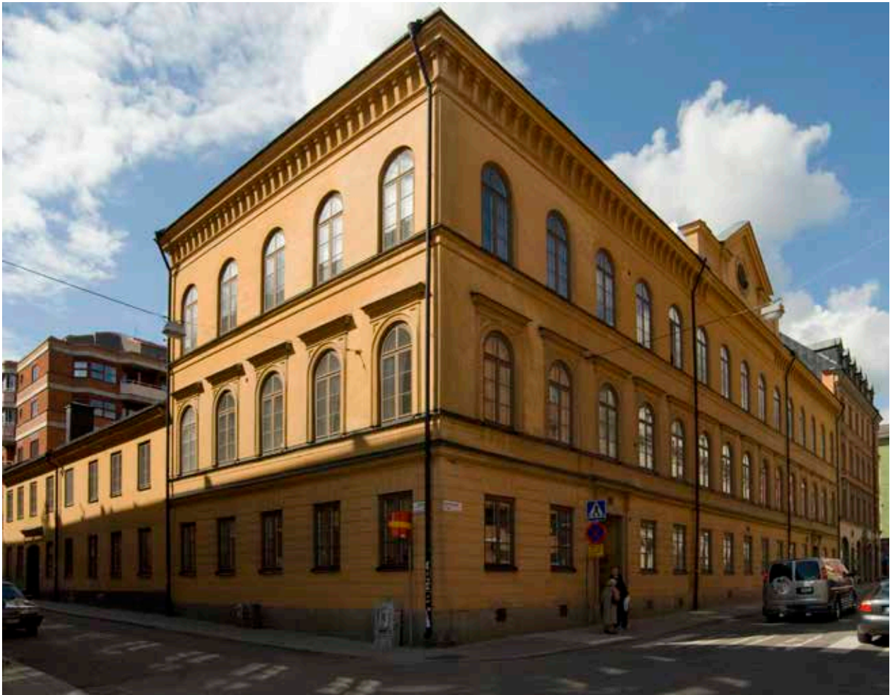
SKOLHUSET BYGGDES 1849 OCH BYGGDES PÅ 1881. DE RUNDBÅGIGA FÖNSTREN, DEN KRAFTIGA TAKLISTEN OCH DET FLACKA TAKET ÄR TYPISKA FÖR NYRENÄSSANSARKITEKTUREN VID DEN HÄR TIDEN.

Stockholm expanderade kraftigt under 1600-talets första hälft bebyggdes Norrmalm i en allt större omfattning. Den nuvarande gatusträckningen och kvarterindelningen följer i stora drag den stadsplan som genomfördes under decennierna omkring mitten av 1600-talet. Utefter huvudgatorna Drottninggatan och Regeringsgatan byggdes i allmänhet stenhus, medan de mindre tvärgatorna karakteriserades av trähusbebyggelse. I kvarteret Väderkvarnen fanns, som namnet anger, en väderkvarn.