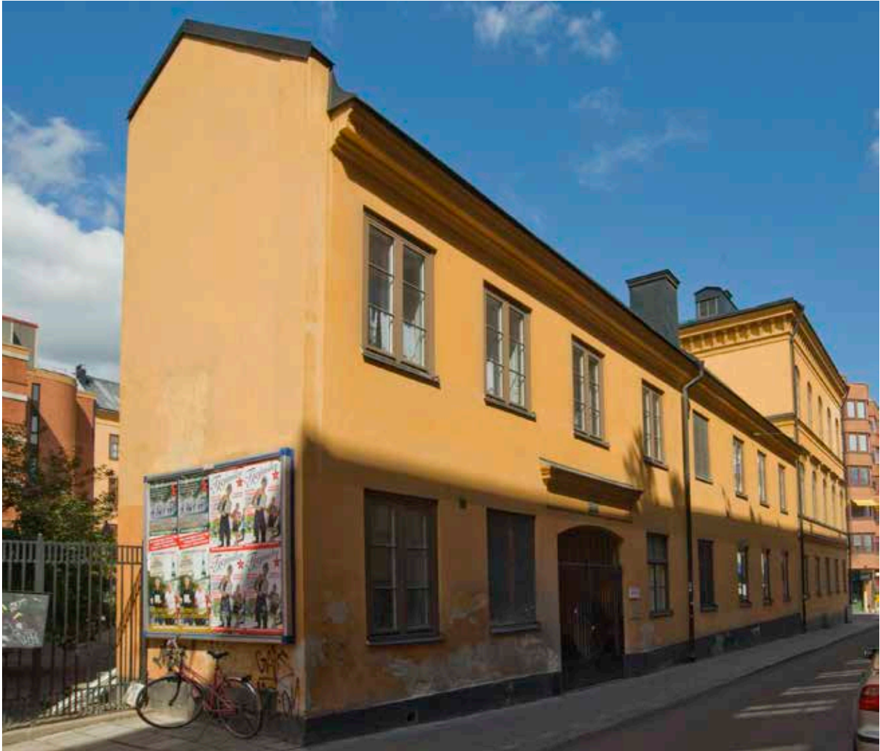
LÄNGAN MOT BRUNNSGATAN BYGGDES VID OLIKA TIDER PÅ 1700-TALET. DEN ÖVERBYGGDA PORTGÅNGEN NÄRMAST ÄR FRÅN 1779 OCH HADE UNDER EN PERIOD BOSTADSRUM ÅT BAGARGESÄLLERNA PÅ ÖVERVÅNINGEN.