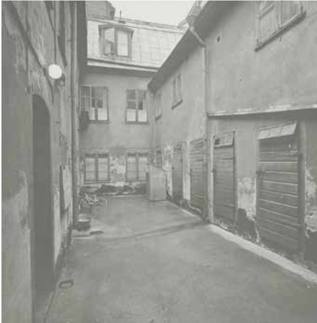
GÅRDEN MOT VÄSTER 1965, INNAN RENOVERINGEN. SSMF75131.