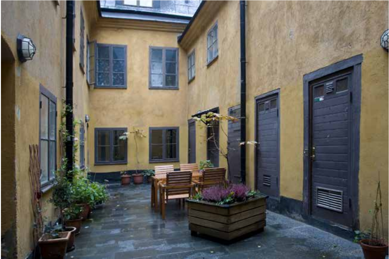
GÅRDEN ÄR LITEN OCH KRINGBYGGD MED BOSTADSHUSET OCH GÅRDSHUSET TILL HÖGER.