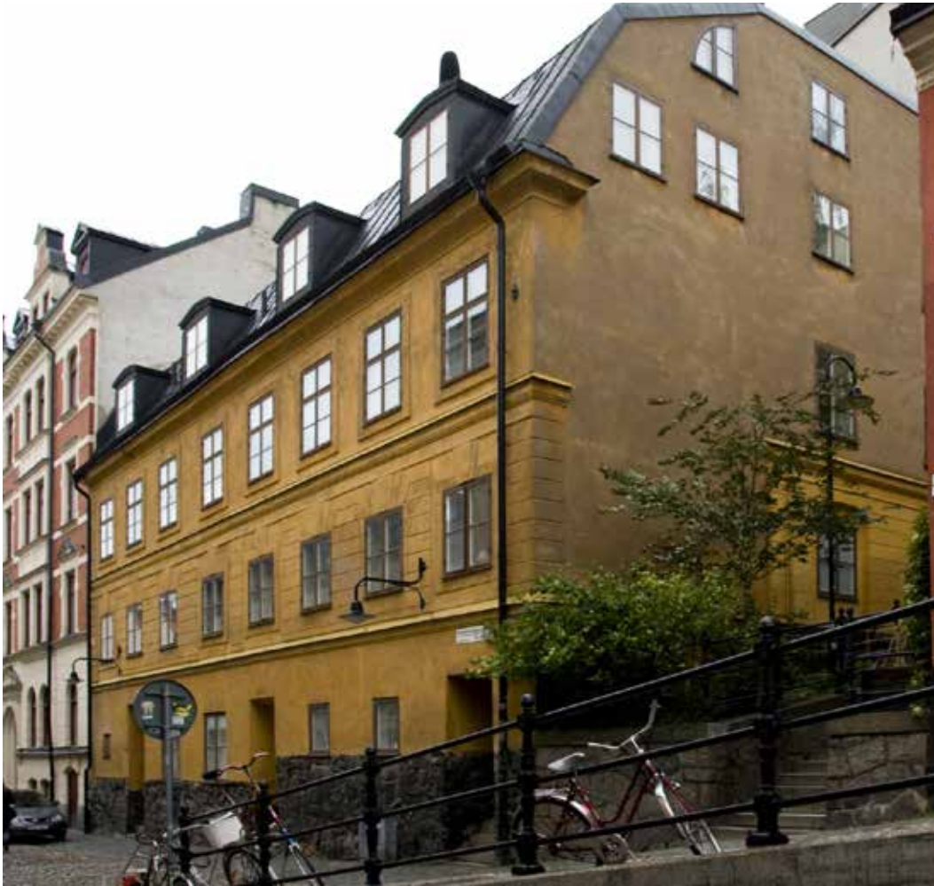
FASTIGHETEN UGGLAN MINDRE 8.

Fastigheten ingår i den del av Mariaberget som med sina gator, topografi och bevarade byggnader ger en särskilt karaktäristisk bild av det äldre Stockholms bebyggelse och stadsliv.