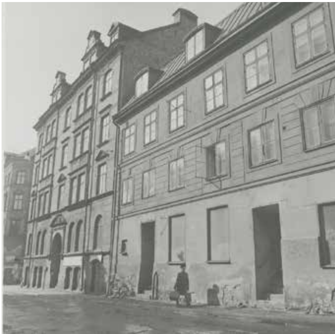
FASTIGHETEN 1970, INNAN RENOVERINGEN. SSMF96131.

Ugglan mindre 8 är en välbevarad 1700-talsbyggnad som uppfördes till murarmästaren Wilhelm Elies. Elies lät 1768 uppföra husets östra del, arton år senare byggde han till dess västra del och gav dem en enhetlig fasad.