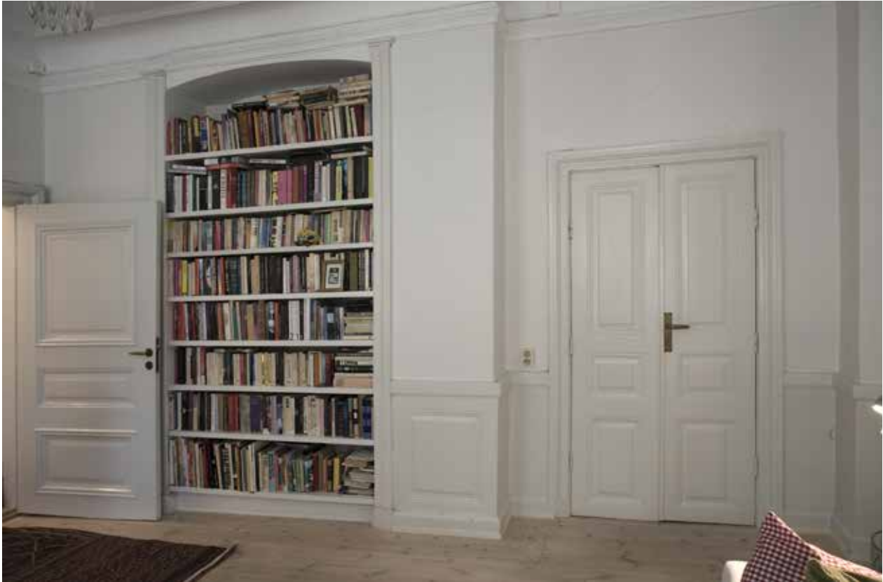
LÄGENHET MED BEVARAD BRÖSTPANEL, ENKEL- OCH PARDÖRR MED SAMTIDA FODER SAMT EN FÖRE DETTA KAKELUGNSNISCH MED PROFILERADE OMFATTNINGAR, IDAG OMBYGGD TILL HYLLA.

gatan. Under 1920-talet ersattes den västra trapphusentrén av en butiklokal.