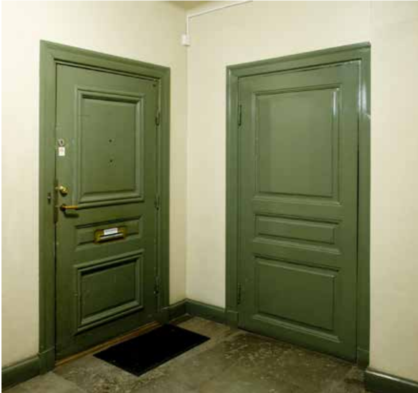
I TRAPPHUSEN FINNS BEVARADE KALKSTENSGOLV OCH ENKELDÖRRAR MED HEL- OCH HALVFRANSKA FYLLNINGAR SAMT GÅNGJÄRN MED KULKNOPP.

fastighet. Bygglövsritningen visar att det västra trapphuset kompletterades med en entré mot Brännkyrkagatan. Det är även möjligt att det är nu som gårdshuset, hus nummer 2 på kartan, byggdes på med en våning.