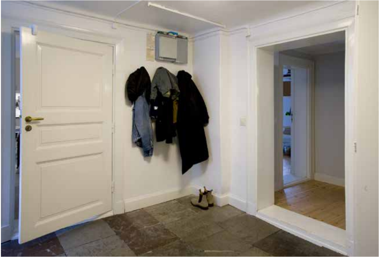
UNDER 1970-TALET GENOMFÖRDES EN RENOVERING SOM BLAND ANNAT INNEBAR NYA MELLANVÄGGAR OCH SNICKERIER. PÅ BILD ÄR EN DEL AV EN VINDSLÄGENHET SOM INRYMMER EN DEL AV DET ÄLDRE TRAPPHUSET MED KALKSTENSGOLV.

avdelar till fyra bågar. I takfallen finns takkupor. Mot Brännkyrkagatan finns tre dörröppningar med enkla fyllningsdörrar och ovanljusfönster indragna i djupa nischer. Dörrarna är troligtvis från tiden kring sekelskiftet 1900. Porten till gården från Ugglegränd har liggande panel med dekorativa nedre fyllningar i form av räfflad romb. På gården finns två parportar till trapphusen. Dörrarna av trä har kraftigt ramverk och en rektangulär fyllning samt ovanljusfönster. Gårdshuset, hus nummer 2 på kartan, har sex stycken panelklädda dörrar med ovanfönster. Några är äldre med smidda bandgångjärn och kraftiga karmar av trä.