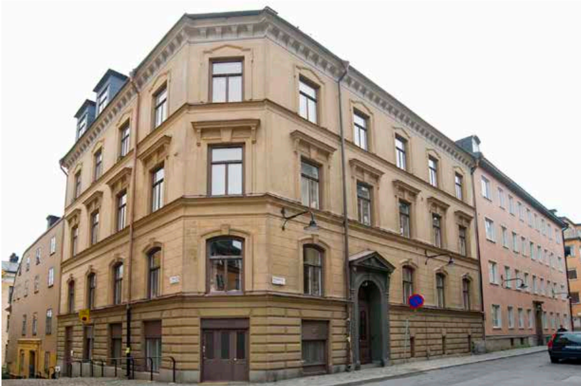
HUSETS DEKORATIVA FASADUTFORMNING ÄR TYPISK FÖR DET SENA 1800-TALET MED EN RUSTICERING I BOTTENVÅNINGEN SOM EFTERLIKNA R EN KRAFTIGT MURVERK OCH FÖNSTEROMFATTNINGAR MED OLIKA DEKORER I PUTS. DEN FÖRNÄMSTA VÅNINGEN HAR EXTRA PÅKOSTADE FÖNSTEROMFATTNINGAR.

Huset på Tavastgatan byggdes 1890 och ersatte då ett mindre stenhus från 1700-talet. Det är alltså en av det sena 1800-talets kompletteringar till Östra Mariabergets särpräglade bebyggelse och speglar arkitekturens och bostadsskicket förändringar.