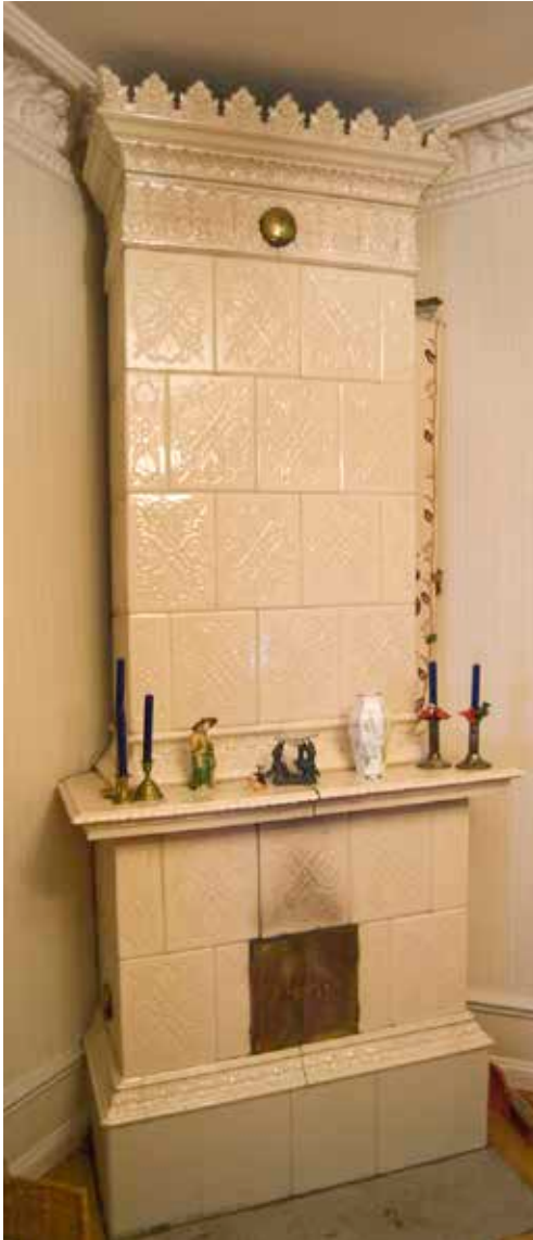
KAKELUGN FRÅN BYGGNADSTIDEN OMKRING 1890.