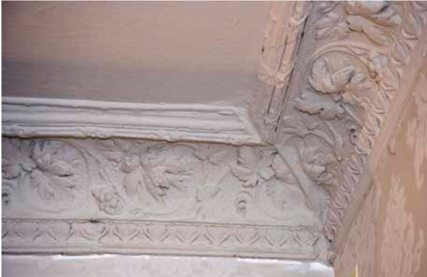
DETALJ AV EN TAKLIST AV STUCK MED DEKOR I FORM AV VINDRUVSRANKOR.

I början av 1960-talet blev nya rivnings- och nybyggnadsplaner aktuella. Ett omfattande kommunalt utredningsarbete inleddes 1966 i avsikt att ge underlag för bebyggelsens framtid. Arbetet resulterade i en bevarande- och restaureringsplan som omfattade i stort sett alla fastigheter på Östra Mariaberget. Upprustningen pågick under 1970- och 1980-talen och det fanns en ambition att pröva nya restaureringsprinciper för att nå både ett antikvariskt och arkitektoniskt gott resultat. Bland annat återgick man till traditionell kalkputs och kalkavfärgningar vid fasadrenoveringarna.