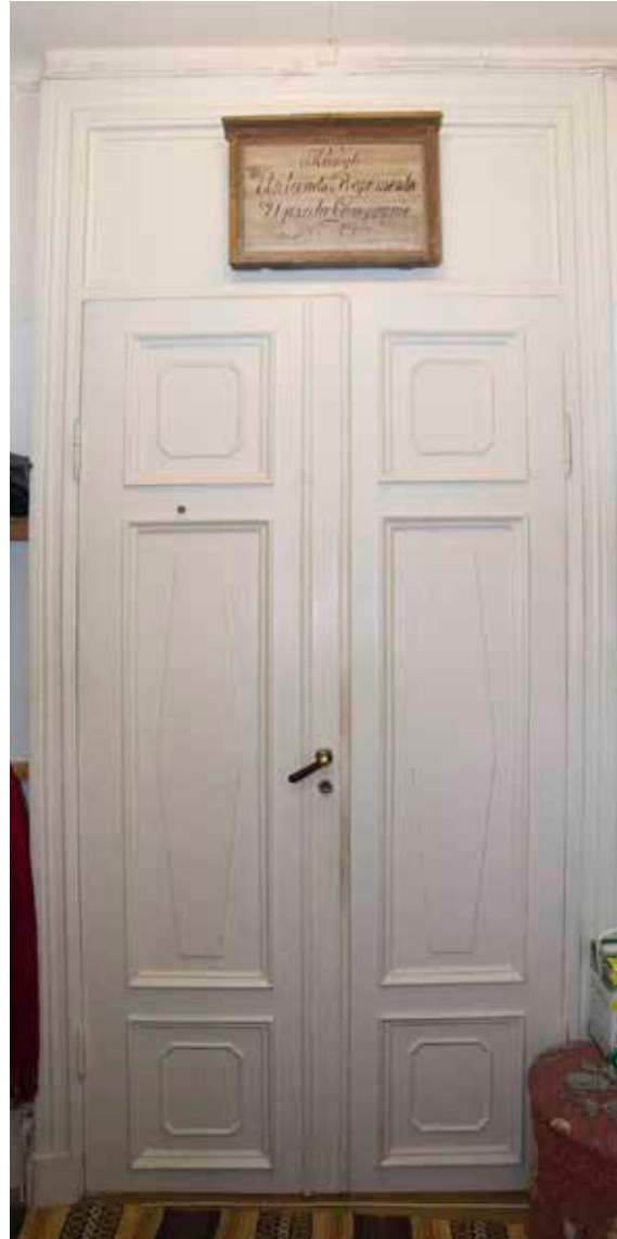
EN INNERDÖRR MED KRAFTIGT LISTVERK OCH PRISMAFORMADE Fyllningar.