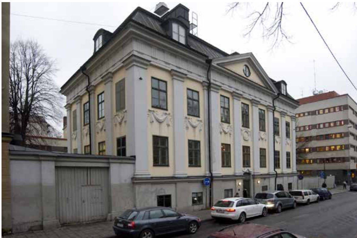
FASADEN MOT WOLLMAR YKKULLSGATAN.

och här uppfördes flera påkostade byggnader med en likartad arkitektur, som van der Nootska palatset på S:t Paulsgatan, Lillienhoffska palatset vid Medborgarplatsen och Louis de Geers palats vid Götgatan. Momma Reenstiernas palats var också ett av dessa, men låg lite mer västerut än de andra.