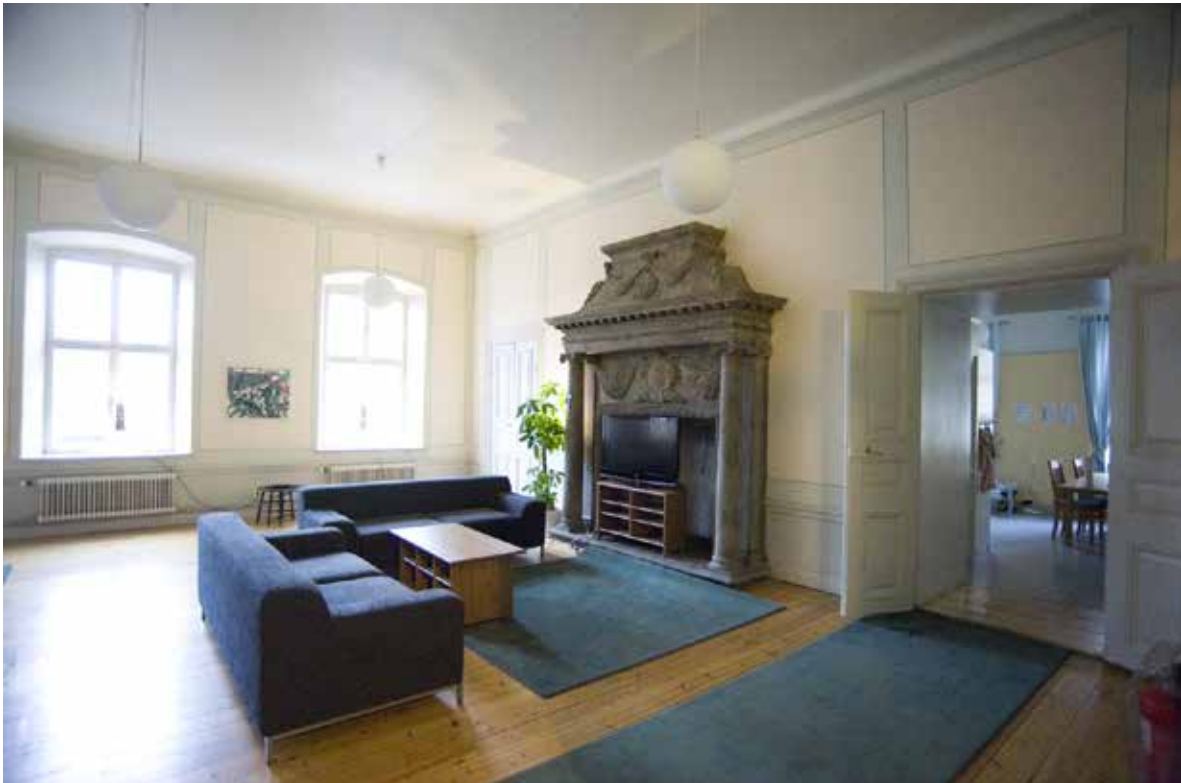
SALEN PÅ VÅNING 2 TRAPPOR MED DEN URSPRUNGLIGA SPISEN I HUGGEN SANDSTEN.

orangeri. Inom egendomen fanns en mängd andra byggnader som stall, vagnshus, fähus, mangelbod och flera mindre bostadshus.