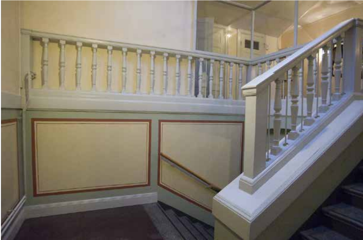
TRAPPA MED RÄCKE OCH SVARVADE STOLPAR, TROLIGEN OMKRING SEKELSKIFTET 1900.

och förändrats flera gånger för att anpassas till nya verksamheter som har flyttat in i huset. Stadsholmen tog över fastigheten 2004.