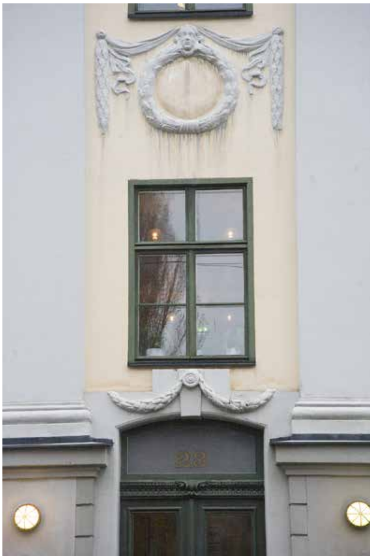
FASADDEKORER MOT WOLLMAR YXKULLSGATAN. DEN ÖVRE MED KRANS OCH ANSIKTE ÄR AV 1600-TALSTYP, MEDAN DEN UNDRE FESTONGEN OCH DÖRRENS TRÄSNIDERI TROLIGEN ÄR FRÅN SLUTET AV 1700-TALET.

kom tillsammans med sin bror Abraham till Sverige på 1640-talet. Här bedrev de handel och var bruksägare i bland annat Västerbotten och Västmanland. Med sina förmögenheter kunde de låna ut pengar till svenska staten och adlades 1669 för sina insatser. Det adliga namnet blev Reenstierna, vilket lever kvar bland annat i Renstiernas gata på Södermalm, som fick sitt namn i början av 1700-talet.