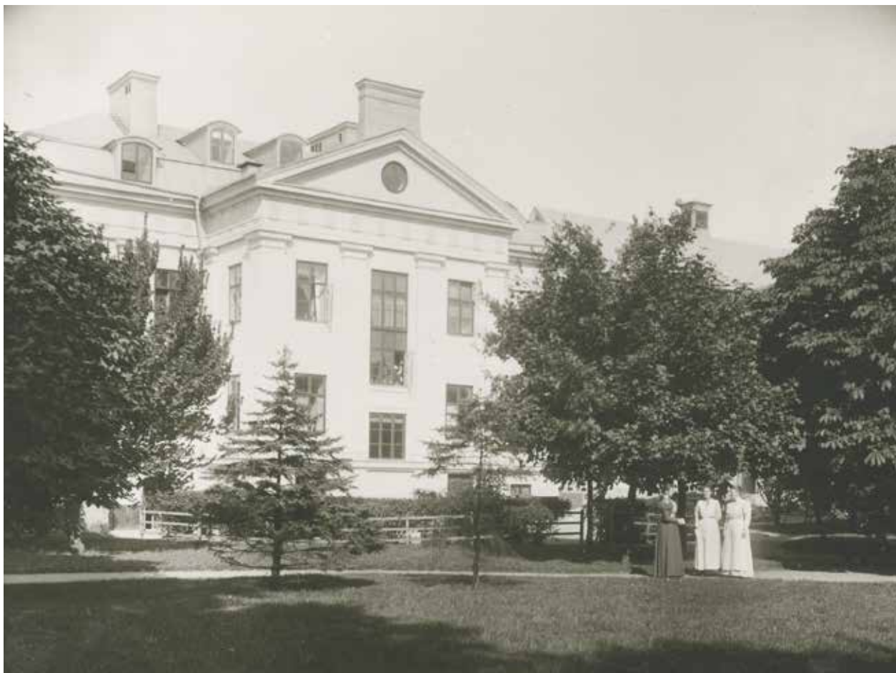
MOMMA REENSTIERNAS PALATS MOT GÅRDSSIDAN I SLUTET AV 1800-TALET NÄR DET VAR BB. HÄR SYNS DEN NYA UTSKJUTANDE DELEN MED TRAPPHUS FRÅN 1882.