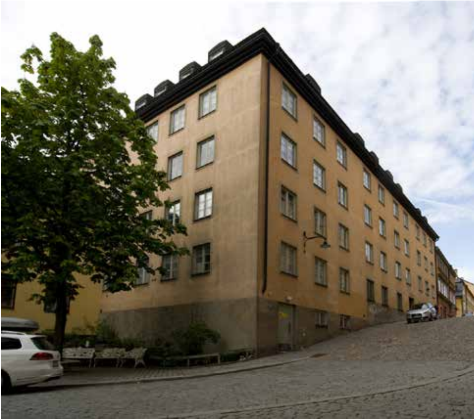
SVALGÅNGEN 6 VID BRÄNNKYRKAGATAN.

stort kokrum, tre inmurade kopparpannor och blyässa. Vidare fanns klarpannor av koppar och kopparpump, en stensatt brunn som gav ymnigt vatten, kalkbackar, en formback, ett fyllhus med järnkakelugn och ett stort magasin med stora inkörsportgångar på norra och södra sidorna. Bottenvåningen inrymde även två lerbackar, två torkrum försedda med gjuten järnkakelugn samt två magasinsrum, ett på vardera sidan om torkrummen.