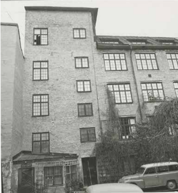
DEN ÄLDRE BYGGNADENS GÅRDSFASAD. FOTO L. BENGTSSON 1970. SSMF96047

Fastigheten Svalgängen 6 speglar den för Östra Mariaberget så vanliga näringsverksamheten. Under cirka 100 år bedrevs ett sockerbruk på tomten. Byggnaden var, liksom den nuvarande, fyra våningar hög och inredd med alla nödvändiga produkter för sockerframställningen.