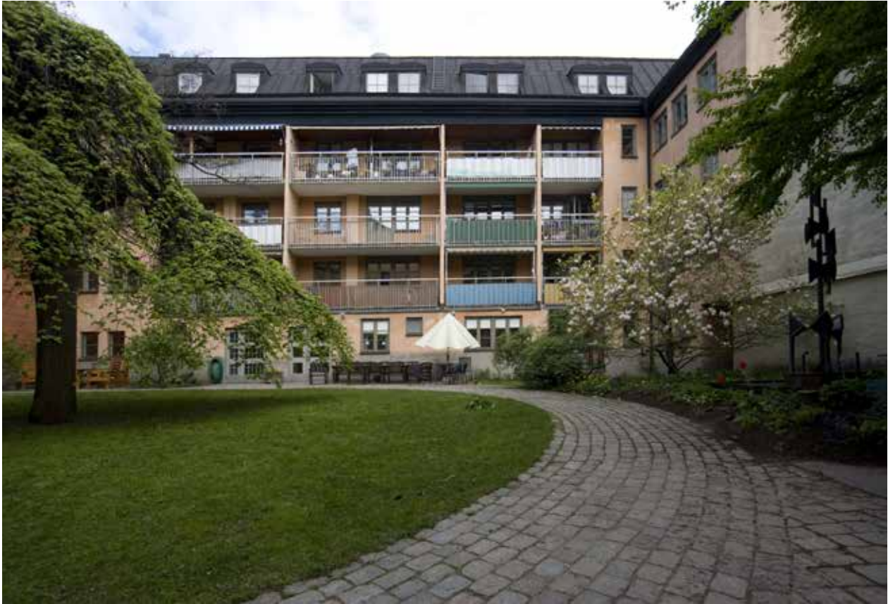
GÅRDSFASAD MED BALKONGER.

Mariaberget östra. Byggnadsvolymen hade i huvudsak samma omfattning som den äldre.