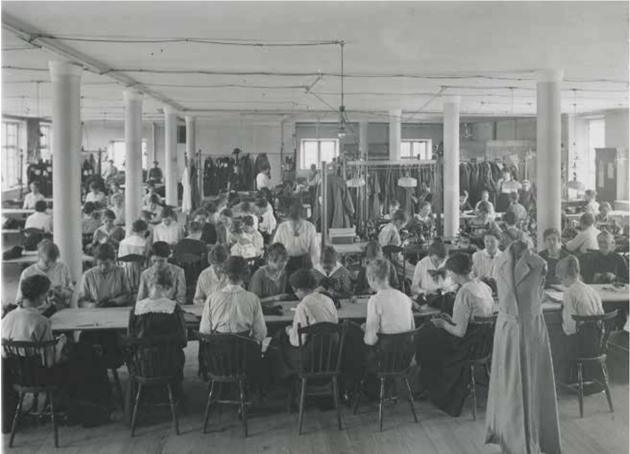
INTERIÖR FRÅN ELIS FISCHERS KAPPFABRIK 1922. SSME26818

om vad som skulle ske med den kvarvarande bebyggelsen. På 1920-talet revs en del hus, men ytterligare planer på rivningar skapade en kraftig opinionsstorm ledd av bland annat Anna Lindhagen, ledamot av stadsfullmäktige och Skönhetsrådet.