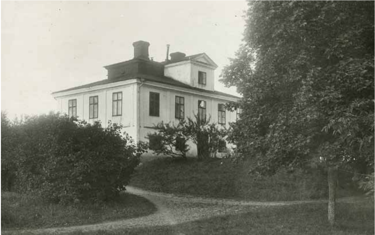
VY MOT HUVUDBYGGNADEN TILL STORA ÄNGBY ÅR 1927: GAVELFASAD MOT SÖDER OCH HUVUDFASAD MOT ÖSTER. FOTO ALMBERG O PREINITZ, SSM FA51086.

Ängby slott uppfördes under 1600-talets sista år, som huvudbyggnad till säteriet Stora Ängby, som hade bildats kring mitten 1600-talet genom sammanslagning av ett antal äldre gårdar. Säteriets ursprungliga huvudbyggnad fyller i dag funktion som flygel.