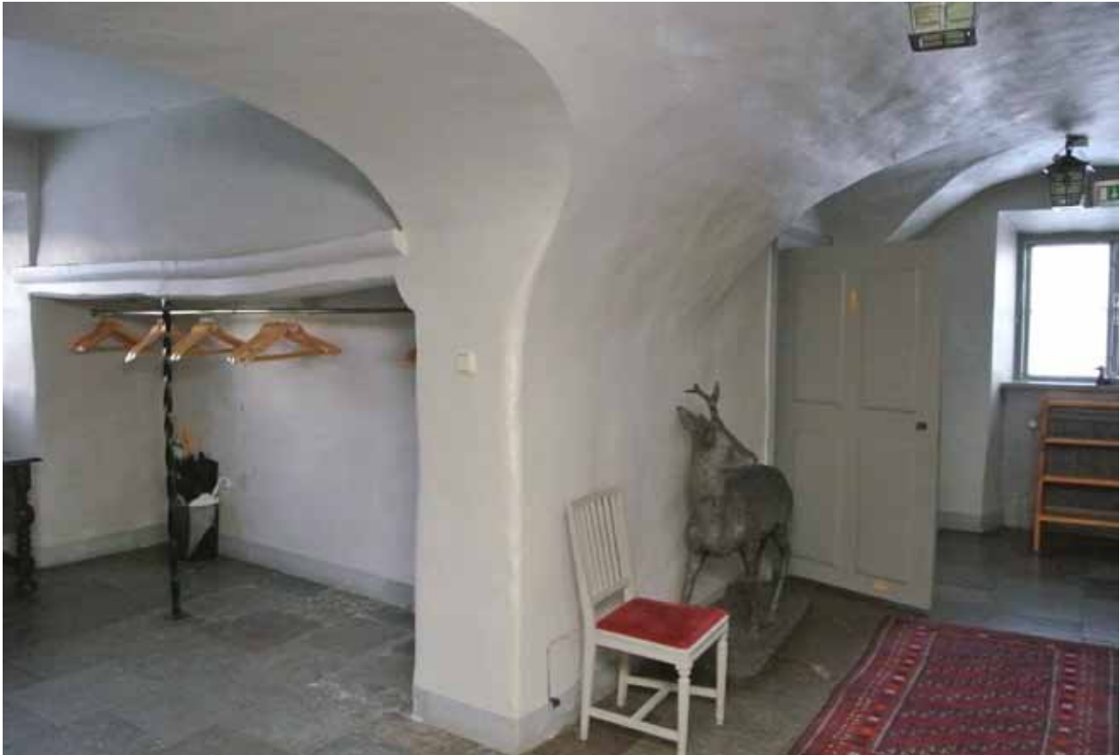
I ÄLDRE TID VAR KÖKET FÖRLAGT TILL HUVUDBYGGNADENS BOTTENVÅNING. I DAG BEVARAS EN MURAD SPISKÅPA OCH VÄLVDATAK I DEN TIDIGARE KÖKSREGIONEN.