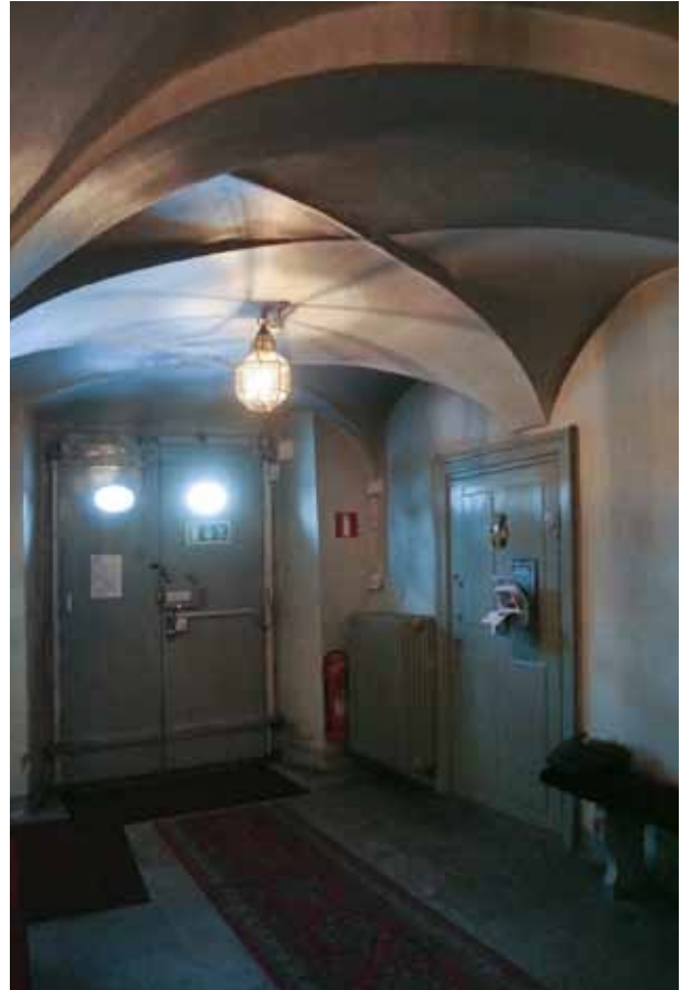
DEN KRYSSVÄLVDA FÖRSTUGAN MOT ENTRÉPORTEN. I HUVUD-BYGGNADENS BOTTENVÅNING FINNS FLERA EXEMPEL PÅ EN DÖRR-TYP MED FYRA Fyllningar SOM FÖREKOM UNDER BÅDE 1600-TALET OCH 1700-TALET S FÖRRA DEL.

miljövården Stockholms innerstad med Djurgården.