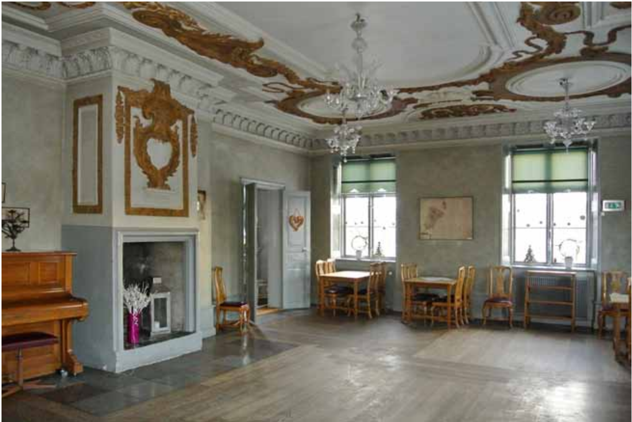
DEN STORA SALEN PÅ DET ÖVRE VÅNINGSPLANET BEVARAR EN PÅKOSTAD INREDNING MED STUCKTAK OCH DEKORERAD ÖPPEN SPIS FRÅN 1690-TALET. DEN LÅGA FOTPANELEN NYTTILLVERKADES PÅ 1950-TALET FÖR ATT FÖRSTÄRKA RUMMETS BAROCKKARAKTÄR, PAR-DÖRRARNA ÄR FRÅN 1700-TALET S ENARE HÄLFT.

mindre rum på rad, med eller utan välvda tak. Representativa rum och bostadsrum är förlagda till den högre våningen i trappa. Det ovanliggande planet domineras av en stor sal med fönster mot väster och söder, i övrigt fördelas sex mindre rum på rad längs yttermurarna.