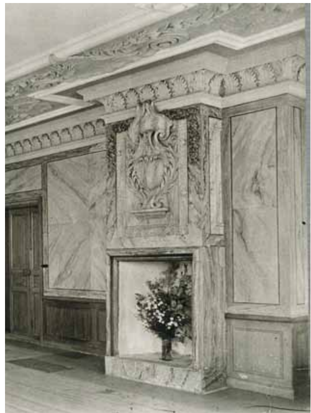
VY MOT STORA SALENS ÖSTRA SIDA MED ÖPPEN SPIS 1927. FÖRE 1950-TALET RESTAURERING VAR VÄGGARNA I SALEN MARMORERADE OVAN EN BRÖSTPANEL, SANNOLIKT SAMTIDA MED PARDÖRRARNA.

Av gårdens byggnader bevaras även en visthusbod från 1600-talet, fatburen, delvis uppförd med timmer från 1500-talet. Fatburen torde därigenom vara en av Stockholmstraktens äldsta trähusbyggnader, eller möjligen den allra äldsta. Slutligen finns i sydost på fastigheten en mindre rödpanelad stuga, sannolikt från 1700/1800-tal. Tomten är parkliknande med stora gräsytor, högvuxna, äldre träd och anlagda gångar. De kvarvarande byggnaderna från Stora Ängby säteri bildar tillsammans ett utsökt och välbevarat exempel på herrgårdsanläggning i mindre format från den karolinska tiden. Bevarad planlösning och förnämlig inredning från byggnadstid och 1700-tal är av betydelse anläggningens