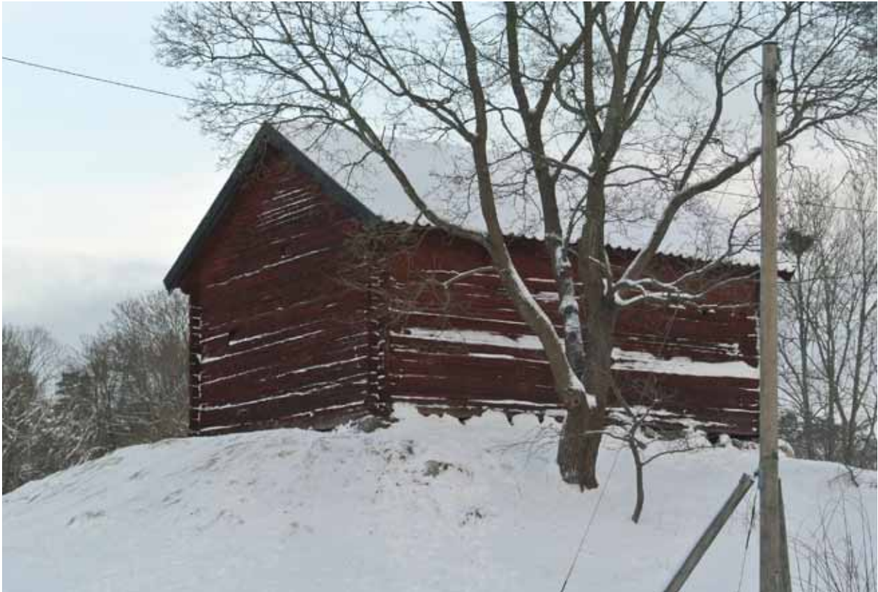
PÅ EN LITEN KULLE NORDOST OM HUVUDBYGGNAD OCH FLYGEL STÅR DEN GAMLA FATBUREN, ETT TIMMERHUS SOM UPPFÖRDES PÅ 1600-TALET MED ÅTERANVÄNDNING AV STOCKAR FRÅN EN ÄNNU ÄLDRE BYGGNAD.

säteritak, täckt av svartmålad plåt, med frontespiser på vardera långsidan och två plåtklädda skorstenar.