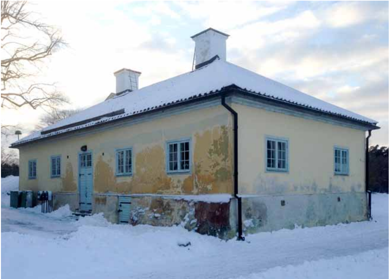
FLYGELBYGGNADEN FRÅN 1600-TALET S MITT VAR SÄTERIETS URSPRUNGLIGA HUVUDBYGGNAD, TIDIGAST ETT RÖDFÄRGAT TIMMERHUS MED SPÅNTÄCKT TAK. SENARE PUTSADES FASADERNA MEN BYGGNADEN BEVARAR FORTFARANDE EN ÄLDERDOMLIG KARAKTÄR. VY MOT FLYGELNS ÖSTRA FASAD.

serverades. På våningen i trappa inreddes en modern köksavdelning i två av de gamla bostadsrummen och i bottenvåningen inreddes garderob och toaletter i den ursprungliga köksavdelningen. Våren 1957 var arbetet avslutat. Därefter har skett ett kontinuerligt underhåll, exempelvis renoverades salsgolvet av ek 1998. År 2003 tillkom en utrymningstrappa på södra gaveln.