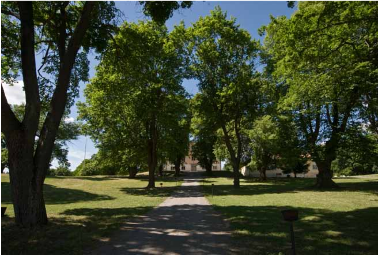
TOMTEN TILL FASTIGHETEN STORA ÄNGBY 22 ÄR PARKLIKNANDE MED HÖGVUXNA TRÄD, STORA GRÄSYTOR OCH GÅNGSTRÅK. VY GENOM ALLÉN UPP TILL HUVUDBYGGNADENS ENTRÉ. TILL HÖGER I BILD SKYMTAR FLYGELBYGGNADEN.

påtaglig karaktär av 1600-tal, en våning hög på en hel källare samt fem fönsteraxlar lång och två axlar bred. Fasaderna är, ovan den kraftiga, putsade stensockeln, slätputsade gula och avslutas uppåt med en profilerad taklist. Taket är ett valmat, tegeltäckt sadeltak med två skorstenar. Entrédörr och källardörr i ostfasaden är enkla, panelade och med bandgångjärn av äldre typ, entrédörren dessutom med spröjsat överljus. Fönstren är småspröjsade och av 1700-talsskaraktär med släta omfattningar samt beslag av 1700-talstyp.