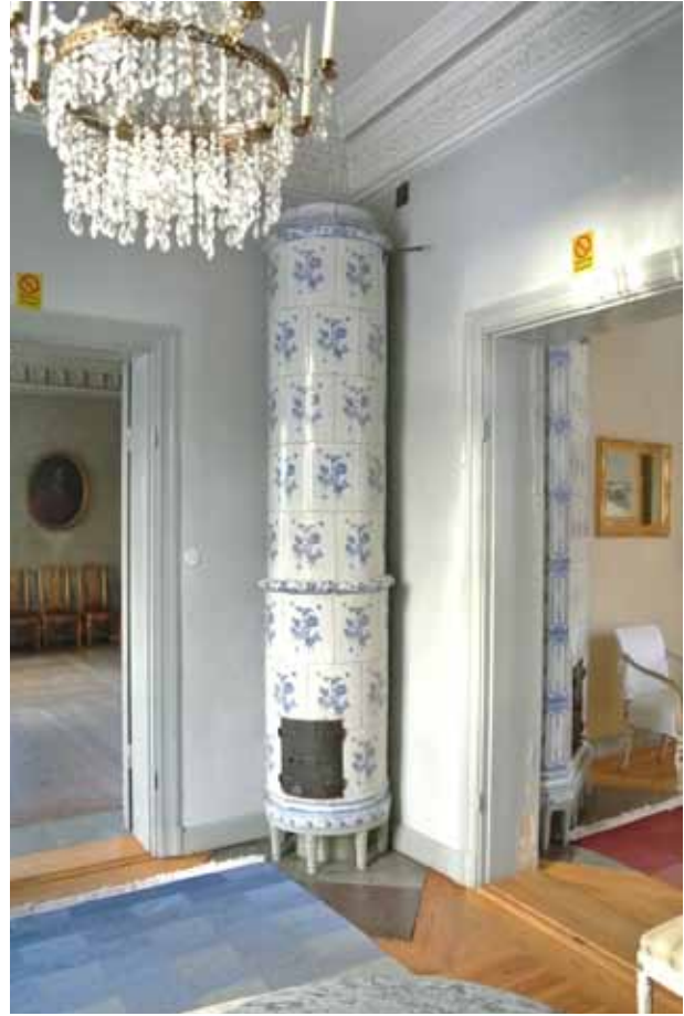
I DE MINDRE RUMMEN PÅ DET ÖVRE VÅNINGSPLANET FINNS STUCKLISTER FRÅN SÅVÄL BYGGNADSTIDEN SOM 1700-TALET, SNICKERIER FRÅN 1700-TALET SAMT FLERA KAKELUGNAR FRÅN SAMMA SEKEL MED DEKORATIVA BLOMSTERMOTIV, SOM FOTOGRAFIETS RUNDA KAKELUGN FRÅN 1700-TALET S TREDJE KVARTAL.

byggnaden tilltog och i början av 1950-talet var den i stort behov av upprustning. Efter olika förslag till användning beslöt stadens fastighetsnämnd att låta Bromma hemvärn förvalta fastigheten för både hemvärnets behov och för uthyrning till allmänheten ”för sammankomster och dylikt”. Förmodligen är det först vid denna tid som Stora Ängby mer allmänt benämns Ängby slott.