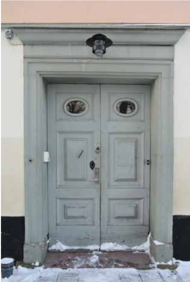
HUVUDBYGGNADENS ENTRÉPORT MED PROFILERAD OMFATTNING OCH ÖVERLIGGARE AV HUGGEN OCH MÅLAD STEN SAMT PAR-DÖRRAR MED HELFRANSKA Fyllningar.