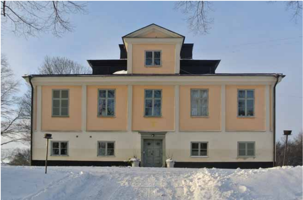
VY MOT HUVUDFASADEN TILL DAGENS ÄNGBY SLOTT. DEN RELATIVT ENKLA HERRGÅRDSBYGGNADEN ÄR KARAKTERISTISK FÖR DEN KAROLINSKA TIDENS ARKITEKTUR: ENKEL OCH VÄLPROPORTIONERAD MED PILASTERINDELAD FASAD SAMT SÄTERITAK.

stora kulturhistoriska värde, liksom de exempel på enklare byggnader som uttrycks genom fatburen och snickarboden.