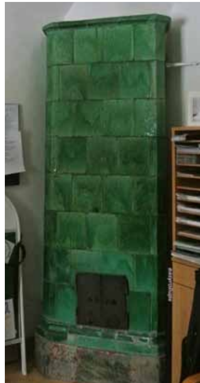
I BOTTENVÅNINGEN FINNS EN ENKLARE TYP AV INREDNING FRÅN 1600- OCH 1700-TALET. HÄR ETT EXEMPEL PÅ EN ENKEL, GRÖNGLASERAD KAKELUGN MED URSPRUNG I 1700-TALET, SENARE OMSATT OCH FÖRENKLAD TILL FORMEN. RUMMET HAR ENKLA, SNEDSTÄLLDA BRÄDOR SOM TAKLIST.

Den nya huvudbyggnaden uppfördes i sten. En senare uppmättningsritning, från 1769, visar ett hus i karolinsk stil med enkel men symmetriskt indelad fasad. Bottenvåningens fasad är utformad som en sockelvåning medan den högre våningen i trappa indelas genom pilastrar. Taket har två fall och är ett för tiden karakteristiskt valmat säteri-tak, i detta fall med frontespis. Planen är relativt enkel och systematisk. I bottenvåningen ligger en förstuga med sidolagt trapphus, ett vinkelbyggt, välvt kök samt