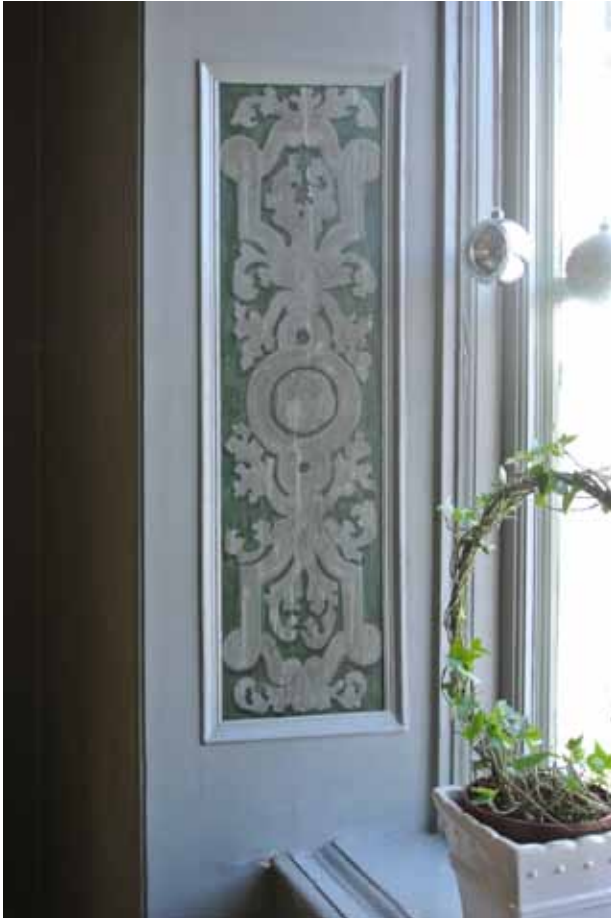
SALENS FÖNSTERSNICKERIER ÄR DELVIS BEVARADE FRÅN BYGGNADSTIDEN. FÖNSTERSMYGPANELERNAS URSPRUNGLIGA DEKORATIONSMÅLNINGAR SKRAPADES FRAM OCH KONSERVERADES I SAMBAND MED HUVUDBYGGNADENS RESTAURERING PÅ 1950-TALET.