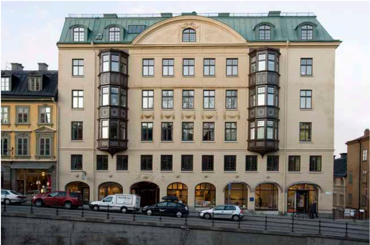
FASADEN MOT HORNSGATAN.

husen påbyggnader och ny fasaddekor. Mot slutet av 1800-talet uppfördes också en del nya byggnader som Mariahissen och Laurinska huset.