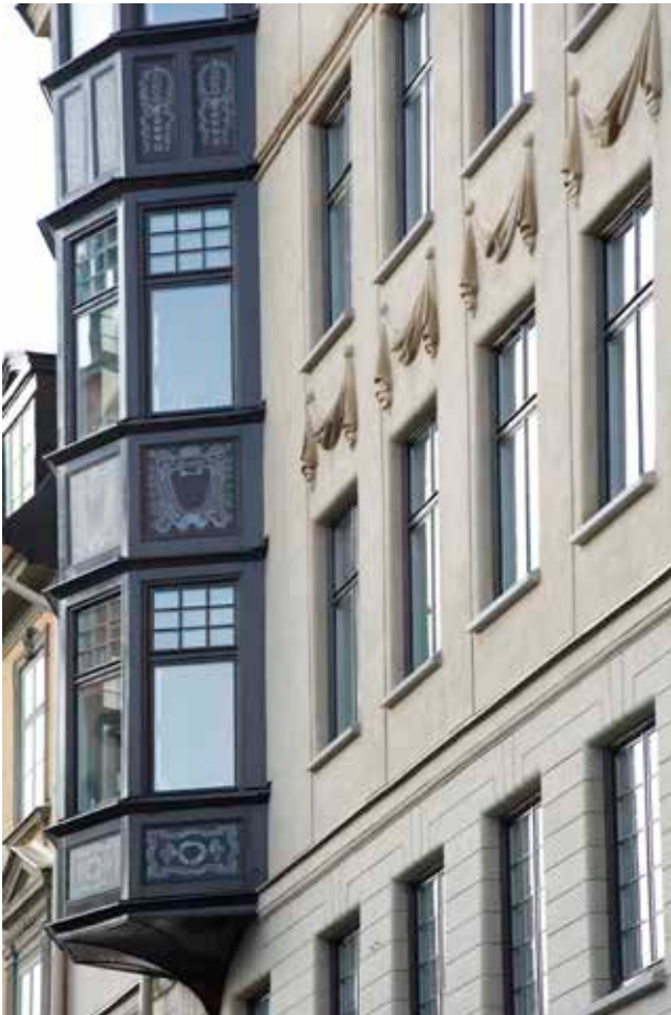
DETALJ AV ETT AV BURSPRÅKEN MED DEKORATIV MÅLNING.