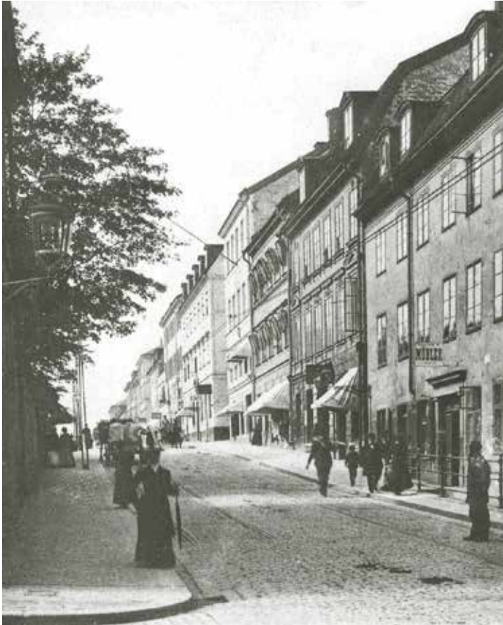
HORNSGATAN VÄSTERUT ÅR 1905, INNAN GATAN BREDDADES OCH DELVIS JÄMNADES UT. TILL HÖGER SYNS DET ÄNNU INTE OMBYGGDA HUSET VID HORNSGATAN 26. REFOTO WOLFENSTEIN 1970, SSM F87638.

Stenbocken 7 byggdes 1760, men präglas i dag av en ombyggnad i början av 1900-talet. Ombyggnaden gjordes i historisk stil med bland annat återanvända stendekorationer från 1600-talet. Det som finns kvar av 1700-talets byggnad är framför allt murverk och källare.