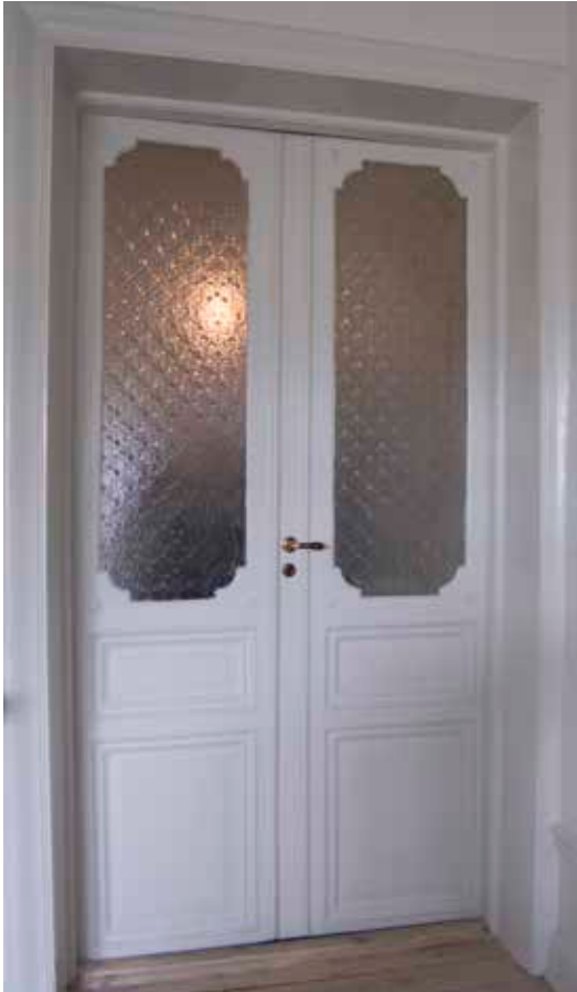
EN GLASAD PARDÖRR FRÅN OMBYGGNADEN I BÖRJAN AV 1900-TALET.