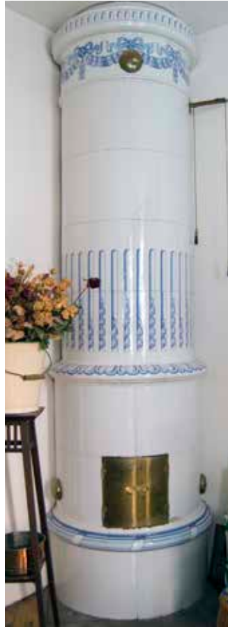
TVÅ EXEMPEL PÅ DE MÅNGA KAKELUGNAR MED OLIKA UTSEENDE SOM SATTES IN I BÖRJAN AV 1900-TALET.