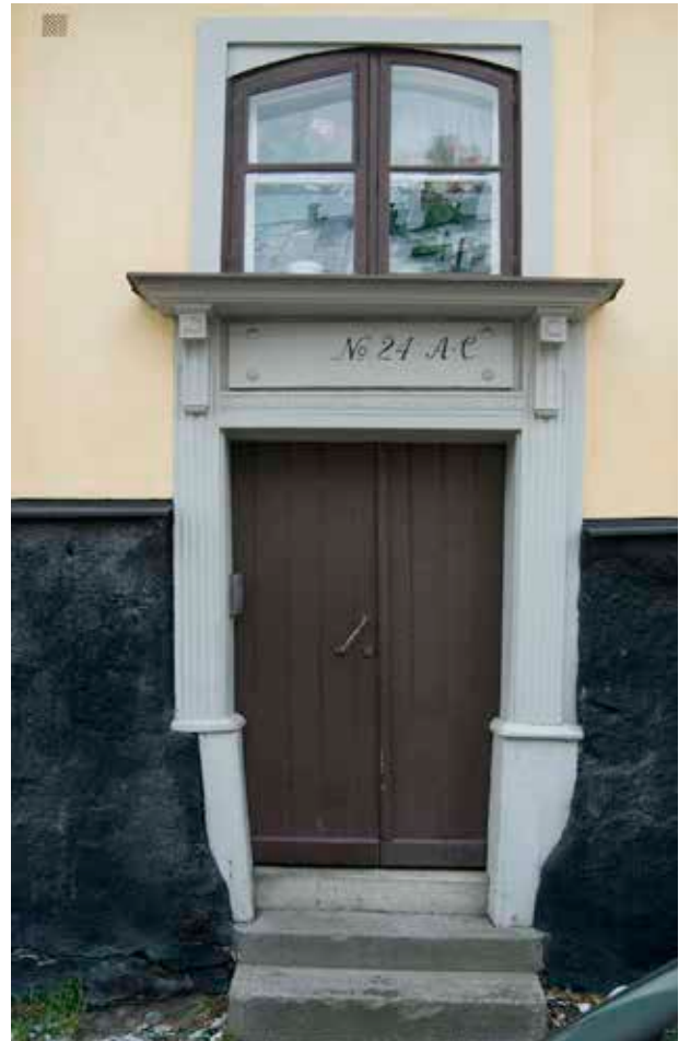
DEN DEKORATIVA PORTINGÅNGEN TILL FJÄLLGATAN 24.