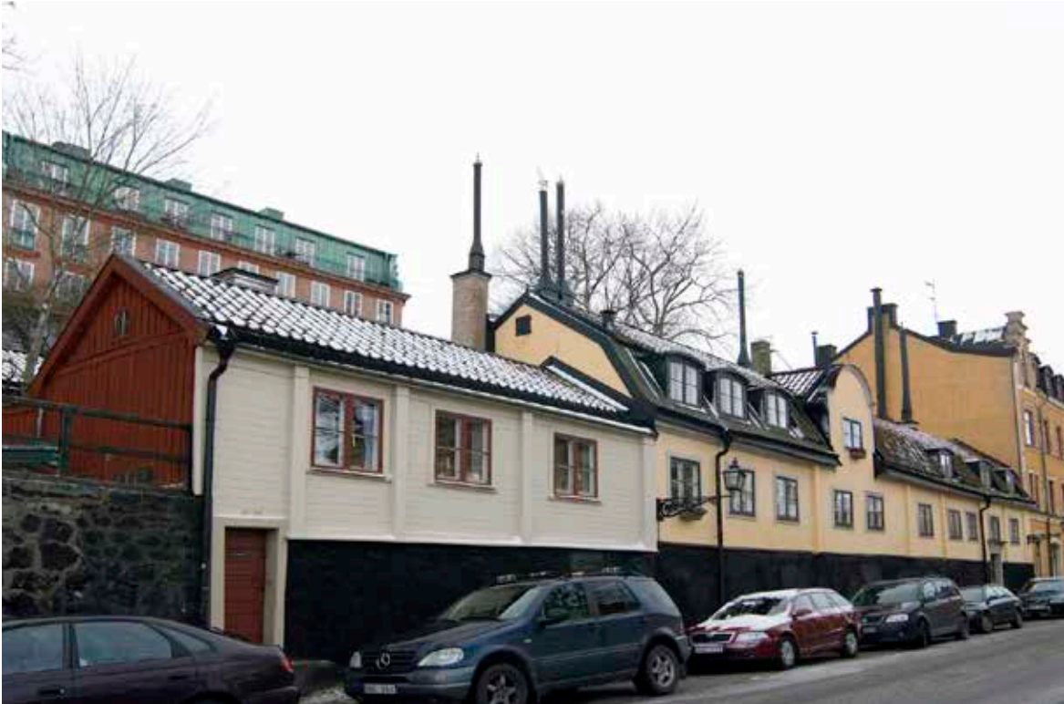
GATHUSET VID FJÄLLGATAN 26 OCH EFTER DET DEN ANSENLIGA LÄNGAN MED SIN FRONTON VID FJÄLLGATAN 24.

Byggnaderna på Fjällgatan 24 och 26 vittnar om bostadsförhållanden för lägre stadstjänstemän, sjöfolk och hantverkare under 1700- och 1800-talet. Husen byggdes efter Katarinabranden på 1720-talet och är uppförda i sten respektive trä. De har byggts till i olika skeden men har oförändrade byggnadsvolymer sedan tidigt 1800-tal.