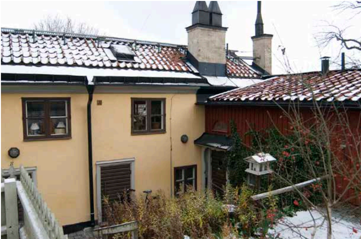
GÅRDEN TILL FJÄLLGATAN 24 MED UTHUSLÄNGAN T.H.