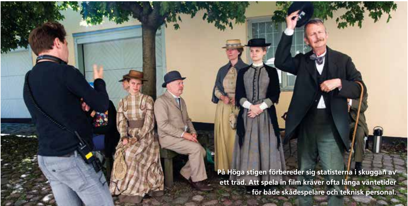
På Höga stigen förbereder sig statisterna i skuggan av ett träd. Att spela in film kräver ofta långa väntetider för både skådespelare och teknisk personal.