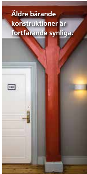
Äldre bärande konstruktioner är fortfarande synliga.