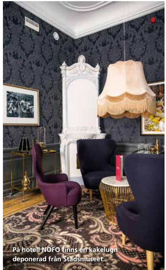
På hotell NOFO finns en kakelugn deponerad från Stadsmuseet.