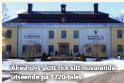
Åkeshovs slott fick sitt nuvarande utseende på 1720-talet.