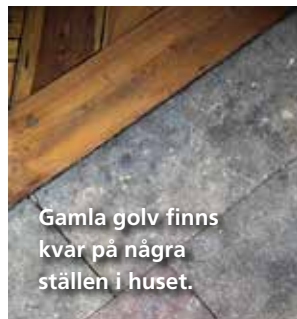
Gamla golv finns kvar på några ställen i huset.