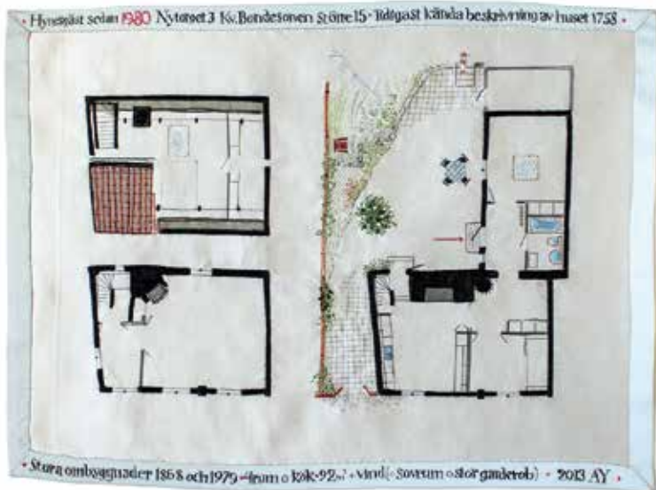
Så här ser planlösningen ut i huset på Nytorget 3.

populärt 1750–1850, innan man började tvinga in broderiet i mönster igen. Det är något som lockar med tråden som inte måleriet har, tråden sticker ju upp lite, ger skuggor.