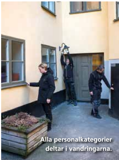
Alla personalkategorier deltar i vandringarna.