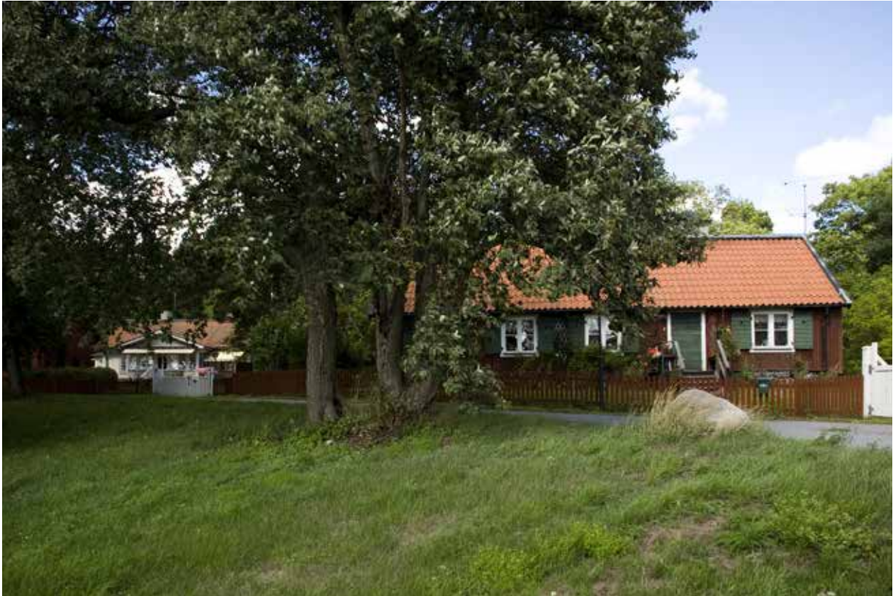
DEN RÖDA FÖRE DETTA ARBETARBOSTADEN PÅ SLÄTTENS GÅRD 1 OCH DEN VITMÅLADE FÖRE DETTA HUVUDBYGGNADEN MED UTHUS PÅ SLÄTTENS GÅRD 2.