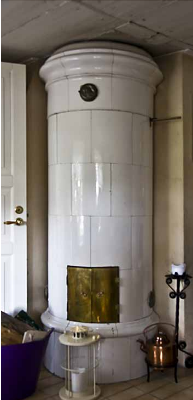
ÄLDRE BRÄDTAK I DEN RÖDA FÖRE DETTA ARBETARBOSTADEN SAMT EN KAKELUGN SOM SATTES UPP VID RENOVERINGEN 1981.

svartmålad stensockel och taket är ett sadeltak med enkupigt tegel och med två putsade skorstenar. Fönstren omges av grönmålade fönsterluckor av liggande panel och ljushål. Fönstren är vitmålade och kvadratiska med en mittpost, två spröjsade bågar och innanfönster. Entrépartiet på den södra fasaden har en enkel vitmålad omfattning och dörren som är sentida har liggande grönmålad panel. Till entrén leder en trätrappa med räcke. På husets norra sida finns ytterligare en entrédörr, lika den förra, med en