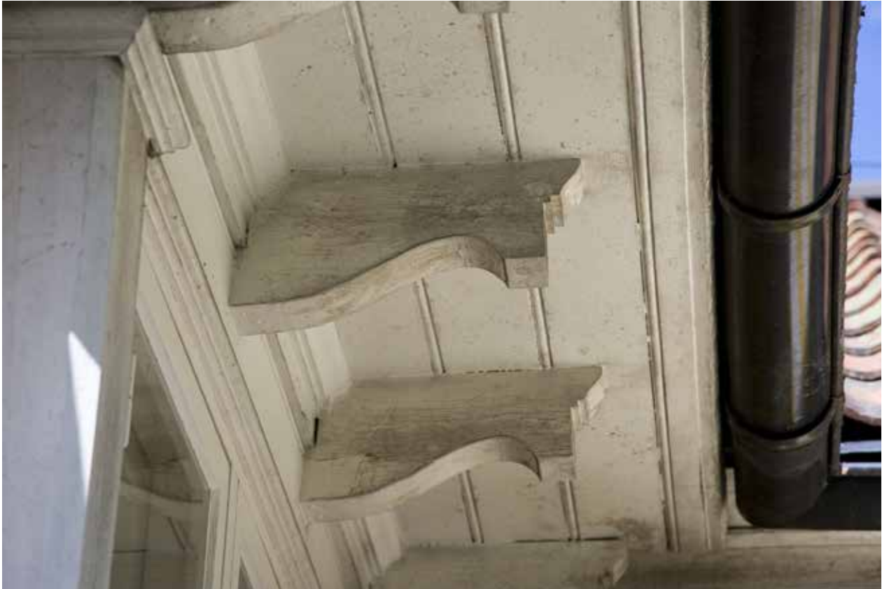
DETALJ ÖVER TAKFOTENS DEKORATIVA KONSOLER PÅ DEN FÖRE DETTA HUVUDBYGGNADEN, SLÄTTENS GÅRD 2.

Öfra Slätten (nuvarande Slättens gård 2, nummer 1 på kartan) och en Nedra Slätten (nuvarande Slättens gård 1, nummer 2 på kartan). Dessa namn användes sedan flera år framåt.