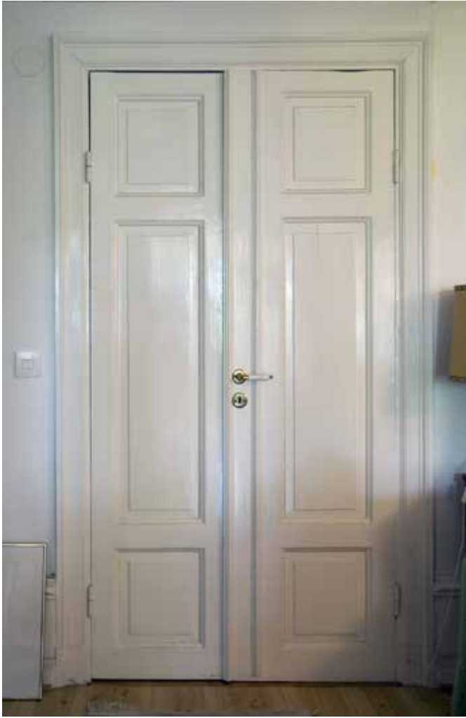
ÄLDRE PARDÖRR MED TRE Fyllningar samt fotpanel.