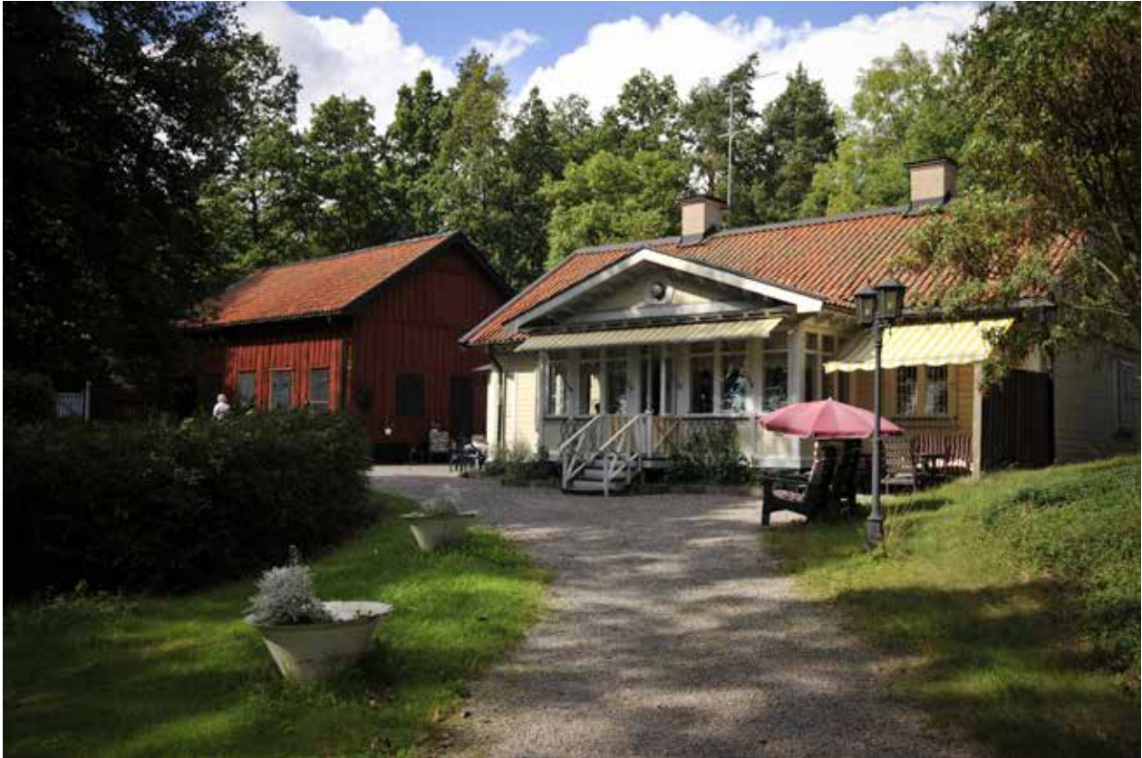
SLÄTTENS GÅRD 2 MED FÖRE DETTA HUVUDBYGGNAD OCH UTHUS.

anpassning till byggnaden. En äldre entré sattes igen på den norra fasaden och invändigt uppsattes en kakelugn.