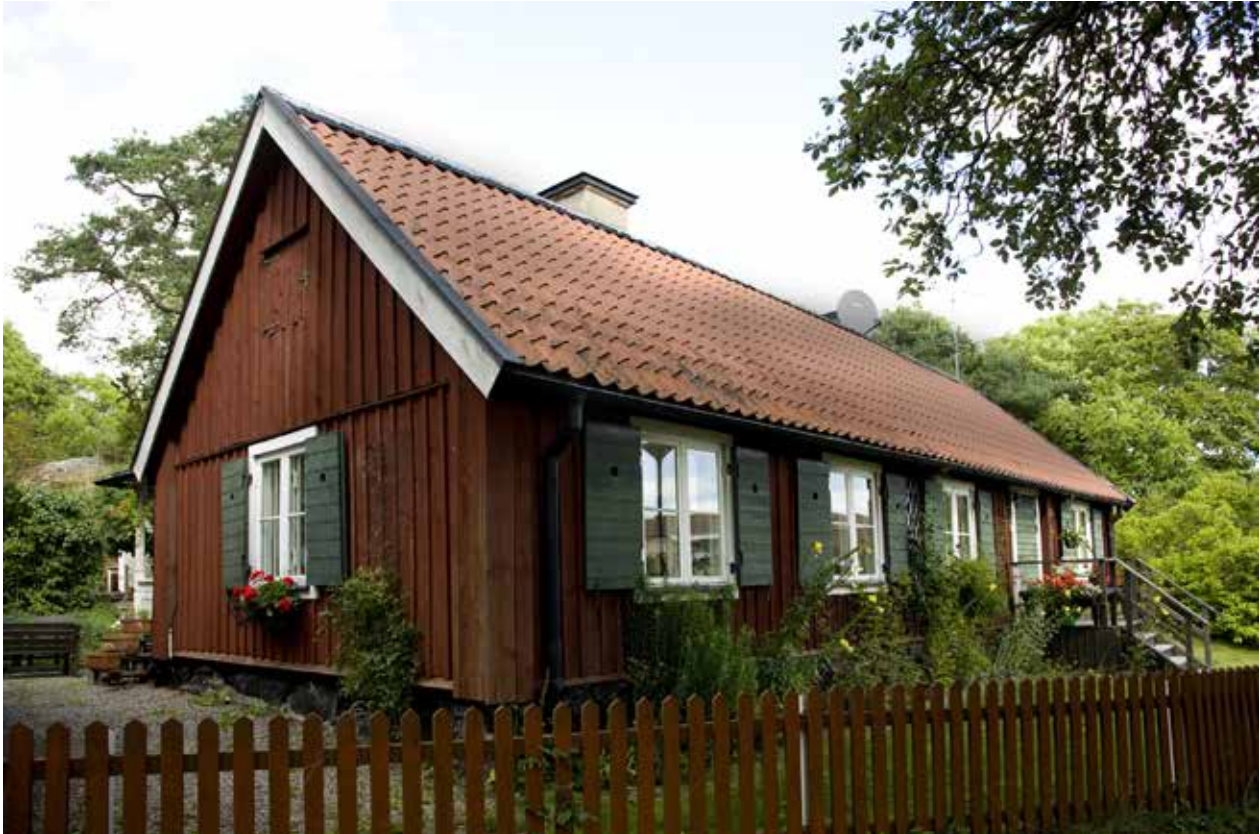
SLÄTTENS GÅRD 1, FÖRE DETTA ARBETARBOSTAD.