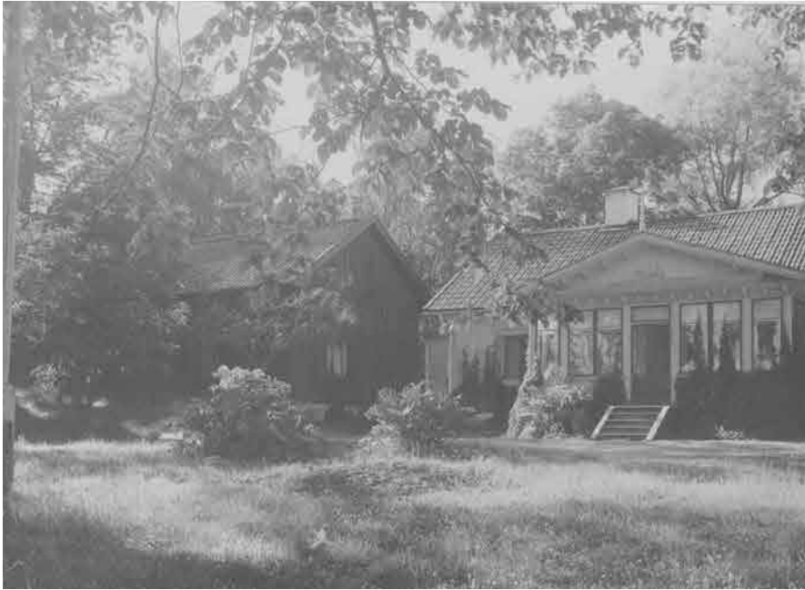
FÖRE DETTA HUVUDBYGGNADEN OCH UTHUSET ÅR 1926. HUVUDBYGGNADENS VERANDA HAR ÄLDRE FÖNSTER OCH EN SVARVAD SPIRA I GAVELKRÖNET. SSMPOSF1544

Slättens gård har anor från 1700-talet och var som mest utbyggd med ett tiotal hus. Idag är gården uppdelad i två fastigheter, Slättens gård 1 och 2, som består av en före detta huvudbyggnad, en arbetarlänga och ett uthus.