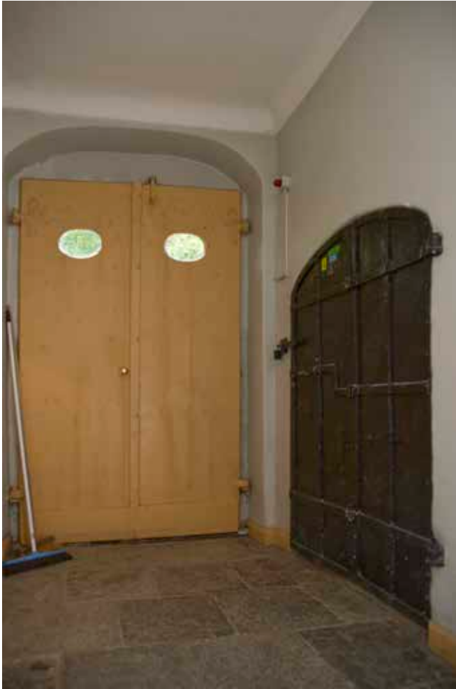
TRAPPHUS MED URSPRUNGLIGT KALKSTENSGOLV, PARDÖRR OCH DEKORATIV JÄRNDÖRR TILL KÄLLAREN.

av 1700-talstyp. Mot söder finns ytterligare en entré med lika pardörrar. Fönstren är i liv med fasaden och har mittpost med två spröjsade bågar. I trapphuset finns innanfönster.