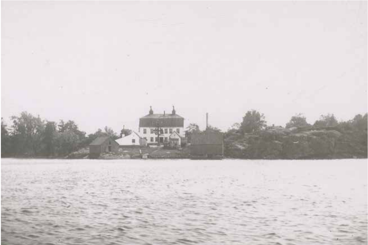
SJÖTULLEN VID LÅNGHOLMEN OMKRING 1800-TALET SLUT. F32685

Fastigheten Sjötullen 1 har ett historiskt förflutet som på flera sätt representerar de verksamheter som bedrivits på Långholmen. Tomten bebyggdes 1769 för Olof Beckelins ståltillverkning och har en välbevarad gårdsmiljö med uthus från 1700-talet samt en sjöbod från 1800-talet.