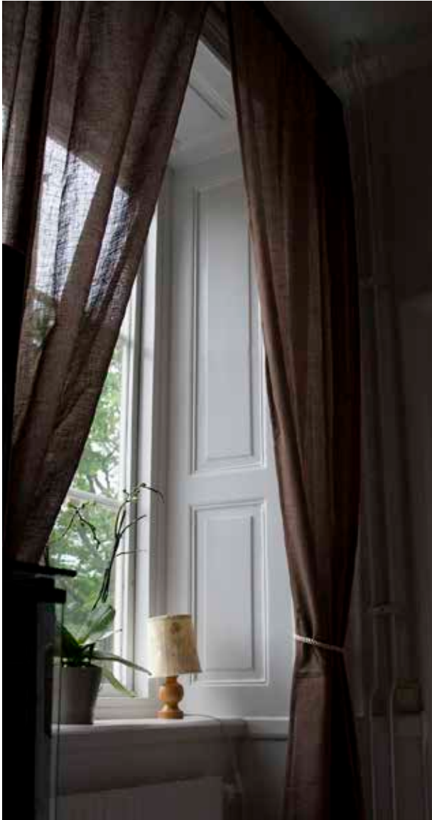
ÄLDRE FÖNSTERPANEL I FÖNSTER.

visade genast sitt intresse och kunde på så vis se till att ingen utomstående verksamhet bedrevs så nära fängelset. I Rankhyttan inreddes en underofficerbostad.