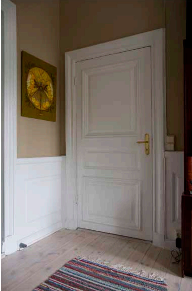
TREFYLLNINGSDÖRR MED HELFRANSKA FYLLNINGAR OCH BRÖSTPANEL.

att komma med ett kostnadsförslag till ytterligare en liten stenbyggnad vid vaktstugan på tullgården. Resultatet blev en sammanbyggd vaktstuga/bagarstuga som senare kom att kallas Rankhyttan, hus nummer 2 på kartan.