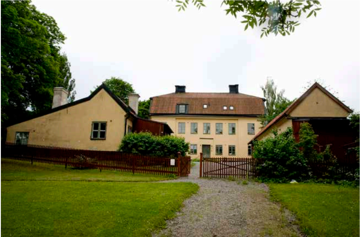
SJÖTULLEN 1 MED HUVUDBYGGNADEN I MITTEN, RANKHYTTAN TILL VÄNSTER OCH UTHUS TILL HÖGER.

Inom fängelsekomplexet har största delen av bebyggelsen ett stort kulturhistoriskt värde. De äldsta delarna av anläggningen tillhörde malmgården Alstavik som Kronan köpte in 1724, och vars huvudbyggnad uppfördes på 1670-talet. Här inrättades ett spinn- och rasphus, det vill säga en arbetsinrättning för bland annat småkriminella, prostituerade och tiggare. Under 1740- och 1750-talet uppfördes flera byggnader enligt ritningar av stadsarkitekt Johan Eberhard Carlberg. Sedan dess har fängelsesystemet reformerats flera gånger vilket avspeglas i om- och tillbyggnader av fängelsemiljön. Till denna hör även ett flertal byggnader utanför fängelsemurarna som används som bostäder.