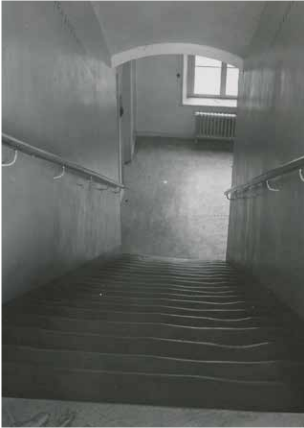
KLARAHUSETS GAMLA, SLITNA TRAPPA INNAN DEN BYTTES UT MOT DEN NUVARANDE I BÖRJAN AV 1950-TALET. FOTO NYBLIN 1951, SSM F54561.