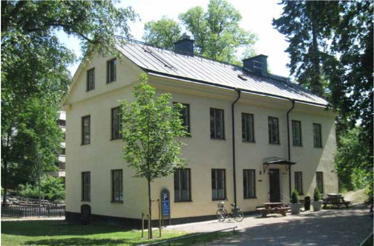
EXPEDITIONSBYGGNADEN/VALENTINHUSETS FASAD MOT VÄSTER. FÖNSTERAXELN LÄNGST TILL VÄNSTER BYGGDES TILL I EN VÅNING 1848 OCH TILL FULL HÖJD PÅ 1860-TALET.

listverk och släta målade eller tapetserade väggar. I ett av rummen på våning 2 trappor finns ett framtaget, äldre brädgolv. Dörrsnickerierna består av både släta och profilerade fyllningsdörrar, i det senare fallet kan vissa snickerier vara från slutet av 1800-talet.