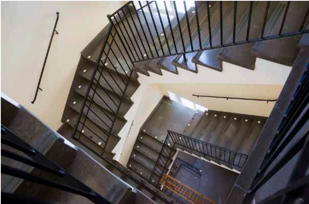
KLARAHUSETS NYA TRAPPHUS FRÅN BÖRJAN AV 1950-TALET.

utan att fästa ett särskilt märke väl synligt på sina kläder vilket naturligtvis ökade skamkänslan.