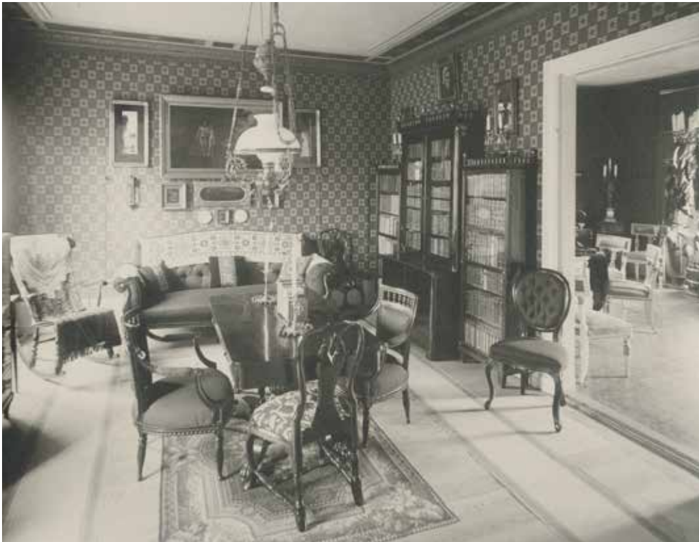
SYSSLOMANNENS BOSTAD PÅ VÅNING 1 TRAPPA I VALENTINHUSET 1896. RUMMEN ÄR INREDDA PÅ TIDSTYPISKT VIS MED DOVA, MÖNSTRADE TAPETER OCH MÖRKA MÖBLER. I TAKET SKYMTAR EN DEKORMÅLNING SOM TROLIGEN ÄR FRÅN 1860-TALET. FOTO AXEL LINDAHL, SSM FA36072.

De äldsta delarna av Sabbatsbergsområdet är en säregen miljö med en sällsam historia i det som nu är Stockholms innerstad. Här har fattiga stadsbor varit inhysta i institutionsbyggnader som har legat sida vid sida med mer förmögna brunnsgästers boende.