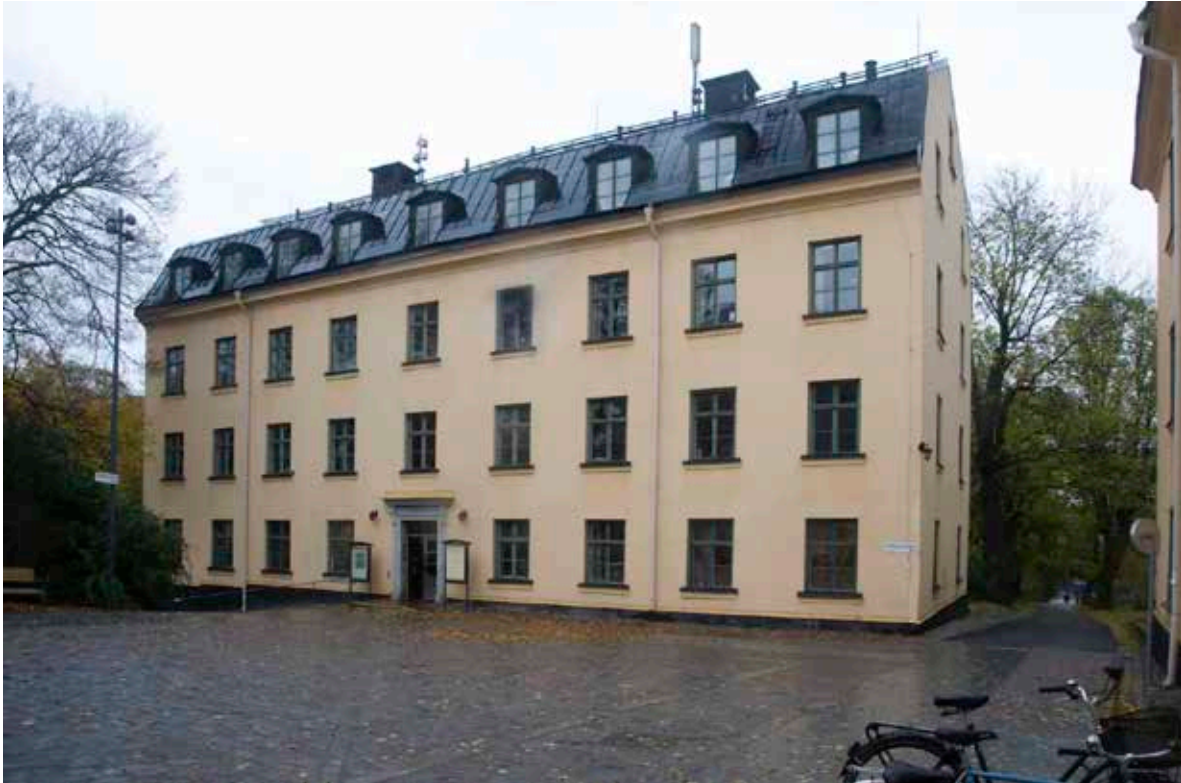
KLARAHUSETS HUVUDFASAD MOT NORDOST.