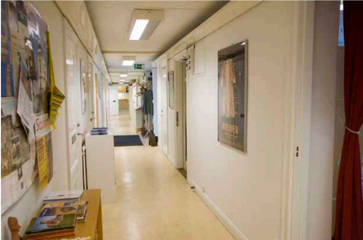
EN AV KORRIDORERNA I KLARAHUSET.

och ett antal mindre salar för gemensamt boende. Samtidigt installerades hiss i huset och trapphuset byggdes om. I källaren inreddes en badavdelning. År 1976 övergick byggnaden till att bli kontorshus.