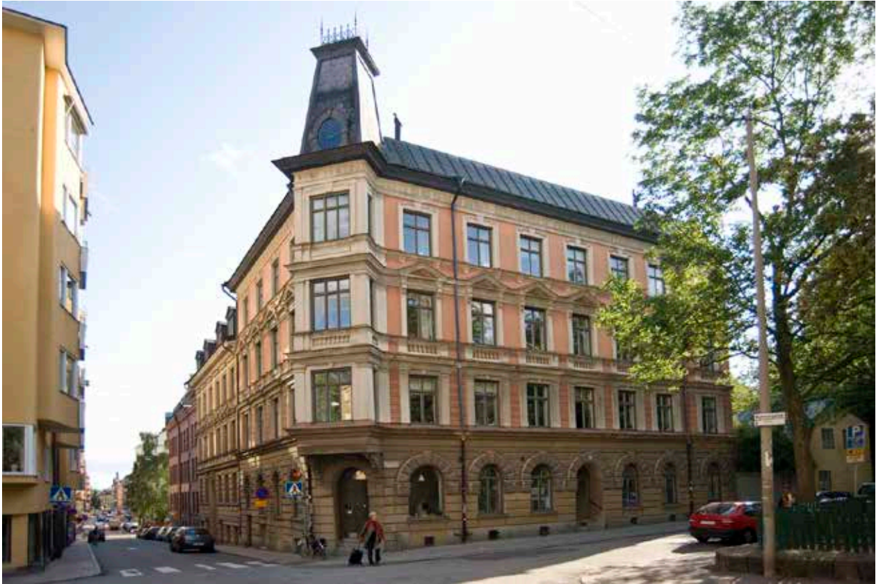
FASADEN MED DET TIDSTYPISKA HÖRNTORNET OCH AVSKURNA HÖRNET.

Sandbacken Större 14 ligger i ett område som präglas framför allt av en borgerlig bebyggelse i sten och trä från 1700-talet. Den nuvarande byggnaden från 1880-talet tillhör ett annat sekel men är karaktäristisk för sin tids omfattande hyreshusbyggnad och speglar bostadsskicket för ett borgerligt mellanskikt.