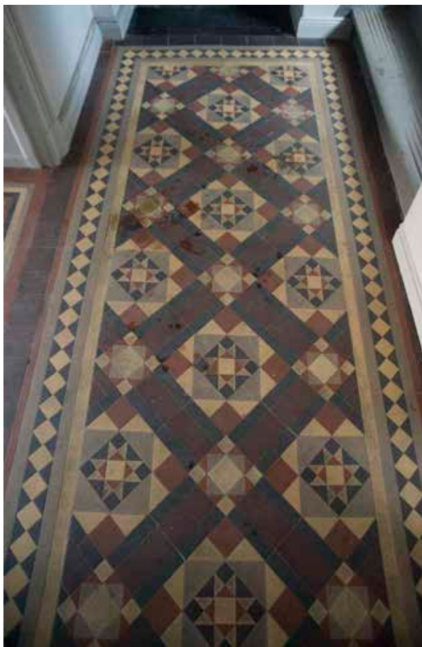
DET URSPRUNGLIGA, FÄRGRIKA GOLVET I TRAPPHUSET.

tillkom på initiativ av byggmästare på ren spekulation med billiga metoder och material för mindre bemedlade hyresgäster. De tilltänkta hyresgästerna i de aktuella fastigheterna tillhörde dock ett något högre samhällsskikt med större anspråk på representativa bostäder.