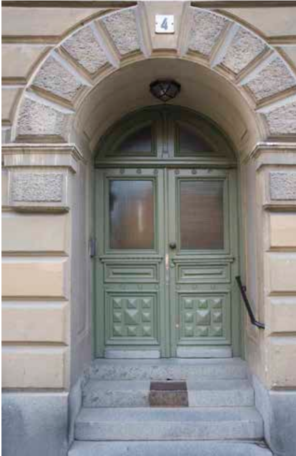
DEN URSPRUNGLIGA PORTEN.

århundradets senare del och 1900-talets första årtionden. Det byggdes en mängd hyreshus som till viss del ersatte den äldre småskaliga bebyggelsen och gav området en ny siluett. Samtidigt genomfördes nya trafiklösningar som förbättrade kommunikationerna till den kuperade och svårtillgängliga östra delen av Södermalm. Katarinahissen från 1880-talet och framdragningen av Katarinavägen under åren omkring 1910 gjorde området lättare att nå men förändrade samtidigt stadsbilden.