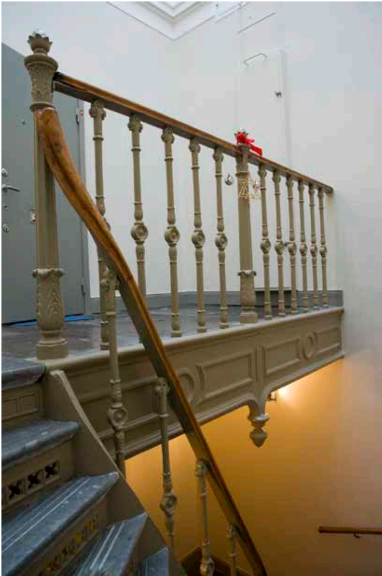
TRAPPAN AV GJUTJÄRN SATTES IN NÅGON GÅNG MELLAN 1875 OCH 1914, DÅ FASTIGHETEN INRYMDE BESIKTNINGSBYRÅN FÖR PROSTITUERADE. SLÅTA DÖRRBLAD AV METALL TILLKOM SANNOLIKT PÅ 1960-TALET.