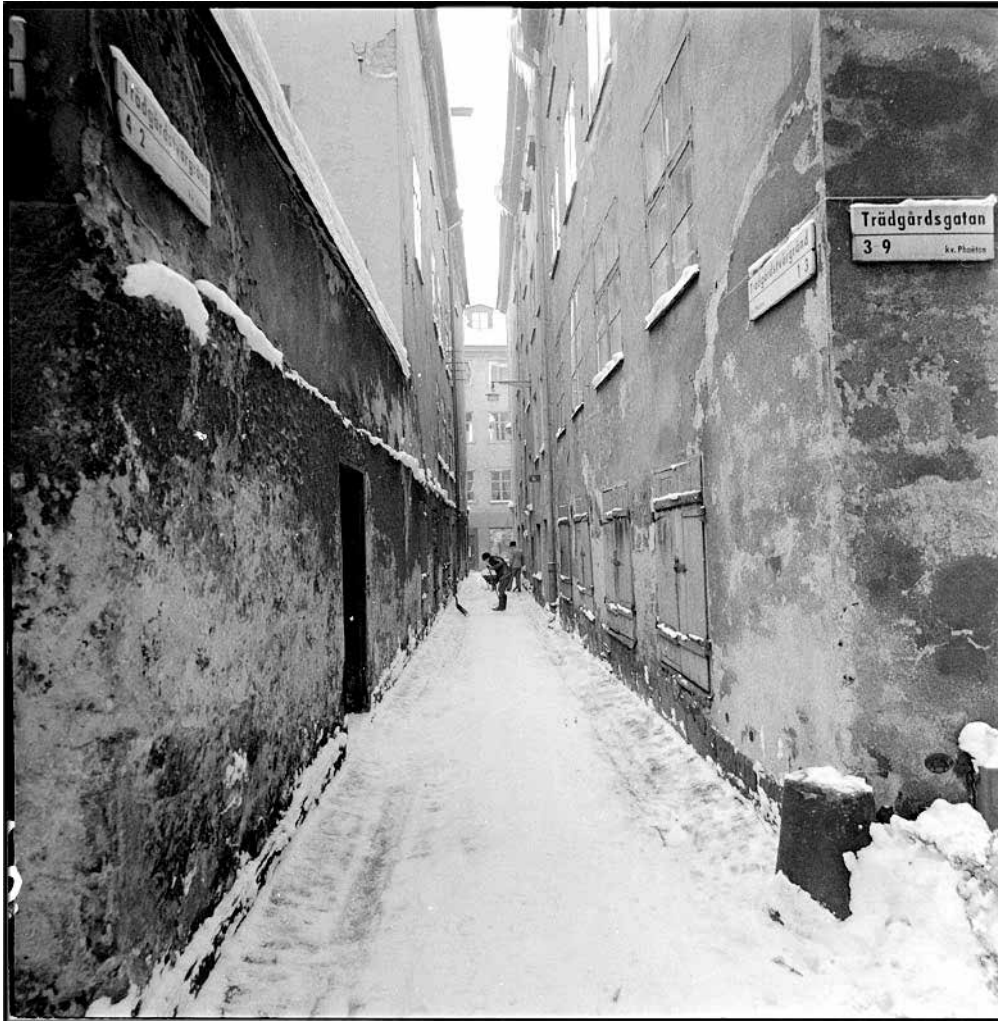
TRÄDGÅRDSTVÄRGRÄND MED PHAETON 11 NÄRMEST TILL HÖGER I BILD. FOTO: L. AF PETERSENS, STADSMUSEETS ARKIV, F 60573.

Phaeton 11 innehåller många tidsskikt från medeltid och framåt, så som ofta är fallet med husen i Gamla stan. Fastigheten ligger undanskymt, vilket sannolikt var orsaken till att staden köpte huset 1874 för Besiktningsbyråns verksamhet, som pågick här till 1918.