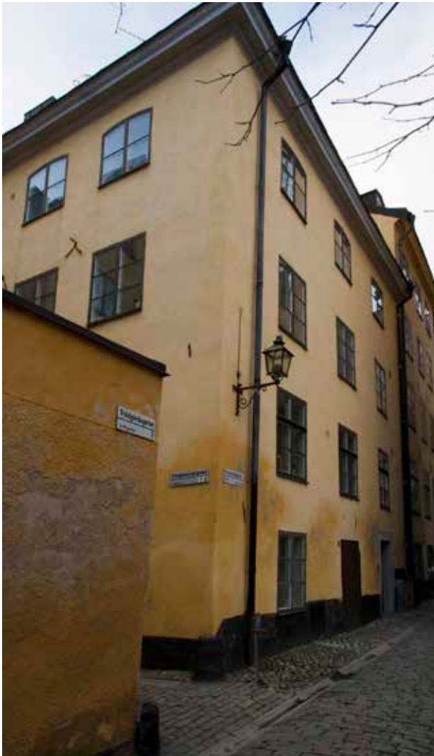
BYGGNADEN LIGGER AVSIDES, I HÖRNET MELLAN TVÅ TRÄNGA BAKGATOR.

oregelbundna stadsplanen är ännu i dag mycket väl bevarad och många hus har i hög utsträckning kvar medeltida murverk bakom senare tiders fasadutformningar och inredningar.