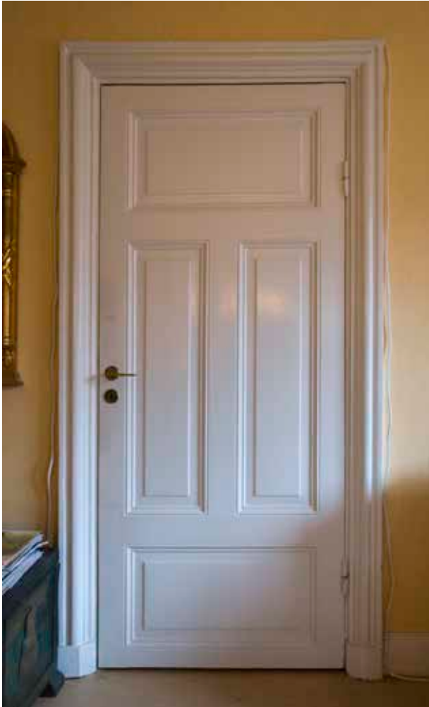
DÖRRFODRET FRÅN 1700-TALETS MITT ÅR AV ROKOKOTYP MED KRAFTIG PROFILERING, DÖRRBLADET ÄR YNGRE.