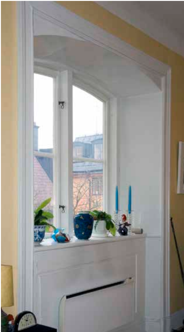
DEN ÖVERSTA VÅNINGENS FÖNSTERÖPPNINGAR ÄR KORGBÅGIGA OCH LÄGRE ÄN I VÅNINGARNA UNDER. DEN STENPROFILERADE BRÖSTPANELEN BÖR VARA FRÅN 1800-TALET.

första inskrivningen dryga 20 år gamla och kom från olika delar av Sverige. De som vid undersökningen befanns vara sjuka skickades till kurhuset Eira på Kungsholmen, de friska fick ett friskhetsintyg. Vid sekelskiftet 1900 fanns ca 900 prostituerade registrerade. Omkring 70 % av kvinnorna behandlades någon gång för syfilis, och lika många för gonorré.