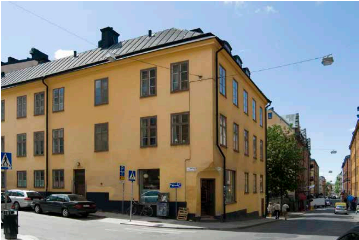
HUSET SETT FRÅN HÖRNET HÖBERGSGATAN / KAPELLGRÄND.

Mellan åren 1787 och 1799 lät hovslagare Carl Tecklind genomföra en stor ombyggnad. Möjligen revs det gamla huset, så som ägaren anger, men det är vanligt att det trots motsatt uppgift ofta bevarades stora delar av den äldre byggnadens murar och källare. Det nya huset var två våningar högt med en central körport mot Höbergsgatan. Mot söder sträckte sig två flyglar av något olika längd och med var sitt trapphus som nåddes från gården. Utöver bostadsrum fanns en hovslagarverkstad väster om körporten till gården och ett vagnshus österut, båda med egna portar mot gatan. Fram till 1860 var fastigheten i olika hovslagares ägo och några större förändringar av bebyggelsen tycks inte ha genomförts under denna period.