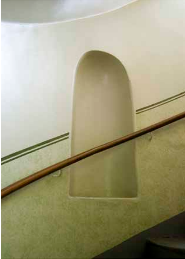
EN NISCH I TRAPPLOPPET I DET ÖSTRA TRAPPHUSET.

och badrum. En del nya dörröppningar togs upp. I väster togs fyra fönster upp i en tidigare brandmur.