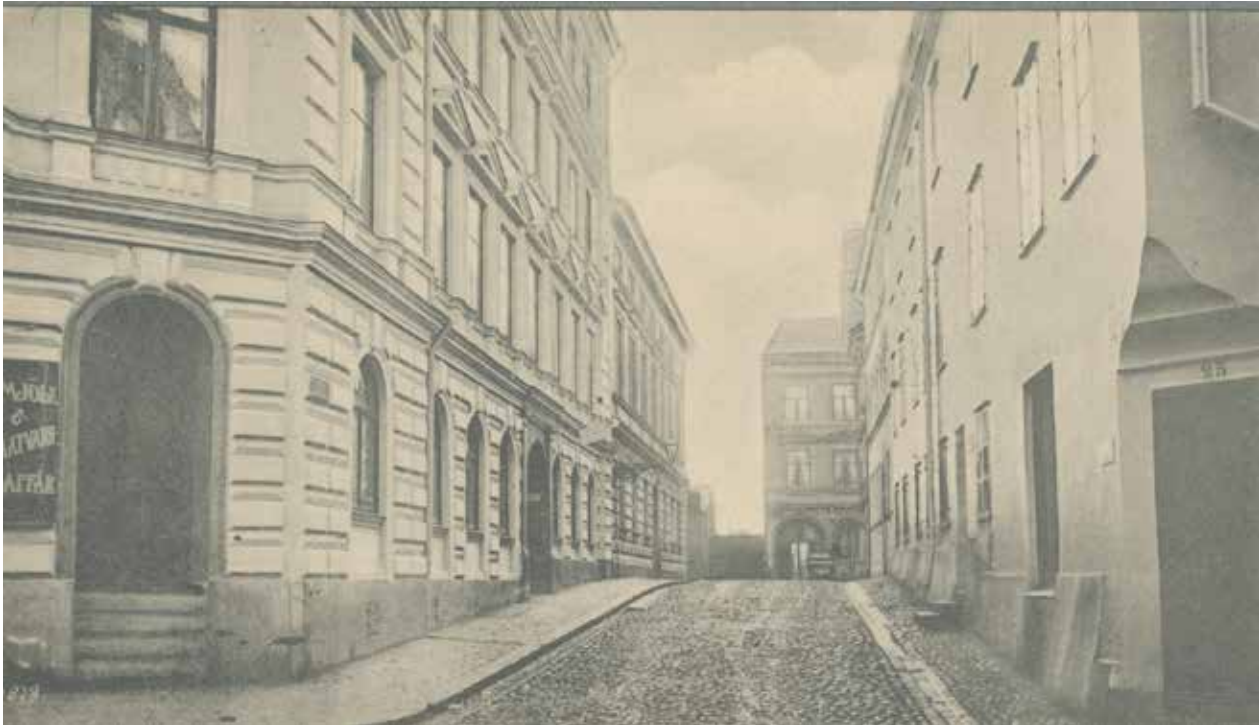
HÖRNET KAPELLGRÄNDEN / HÖGBERGSGATAN. PELARBACKEN STÖRRE 30 ÄR DEN HÖGRA BYGGNADEN.