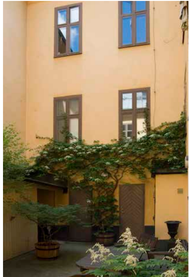
GÅRDEN, SETT MOT SÖDER OCH DEN NYUPPFÖRDA SÖDRA GÅRDSFLYGELN.

vid den stora branden i Katarina 1723. Återuppbyggnaden gick långsamt och skedde till stor del i trä trots 1736 års byggnadsordning som föreskrev att husen skulle byggas av sten. En hel del 1700-talsbebyggelse finns bevarad i området, utspridd på olika kvarter. De personer som vid denna tid ägde hus i kvarteret Pelarbacken Större hade yrken som slaktare, kamrer, mjölnare, fabrikör eller styrman. De tillhörde inte stadens fattigare skikt men inte heller det rikaste.