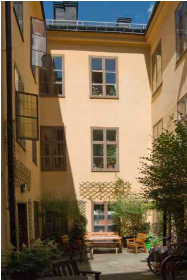
HUVUDBYGGNADENS GÅRDSFASAD.