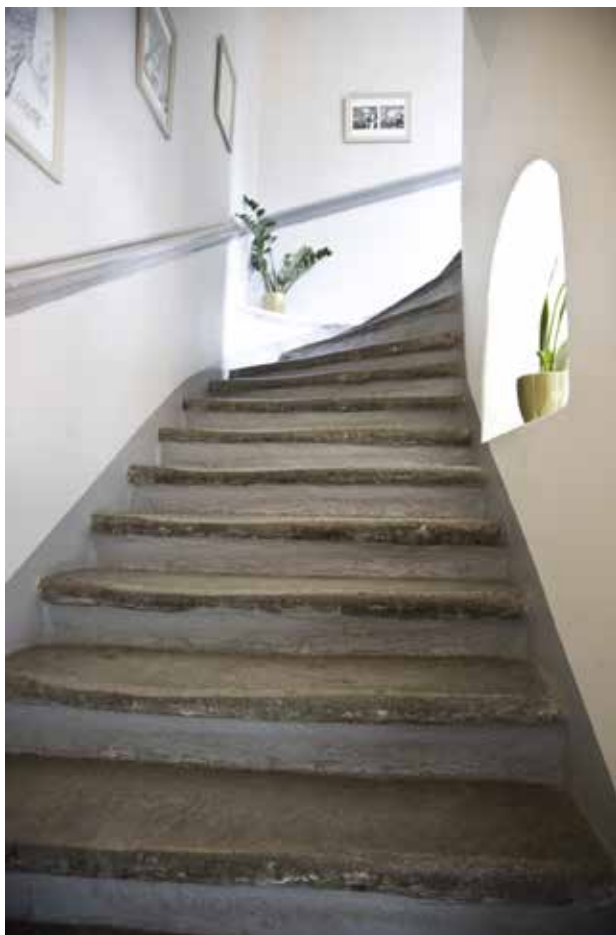
DEN ÅLDERDOMLIGA TRAPPAN AV KALKSTEN MED LJUSINSLÄPP OCH HANDEDARE AV 1700-TALSTYP.