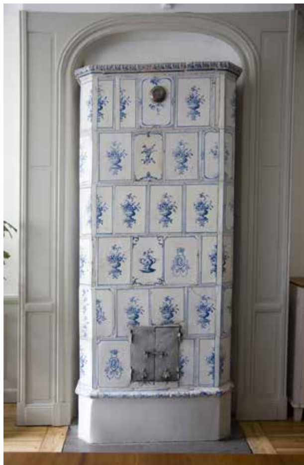
KAKELUGN FRÅN 1700-TALET PÅ VÅNING 1 TRAPPA, DEPONERAD FRÅN STADSMUSEETS SAMLINGAR.

och snidade flätverk är välbevarade från 1700-talet. Den lilla innergården mellan de fyra längorna är lagd med smågatsten och har en sentida fontän i mitten.