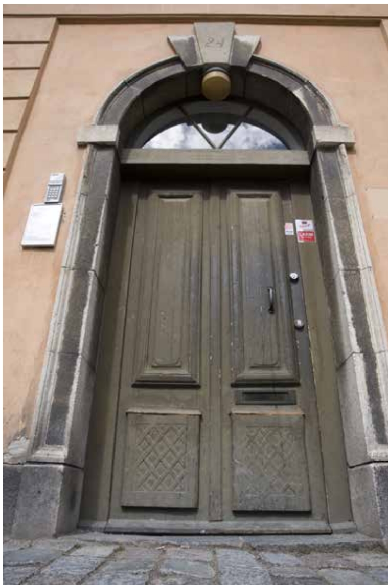
PORTOMFATTNINGEN AV STEN OCH PORTEN MED FINT TRÄARBETE FRÅN 1700-TALET.

ägdes av snörmakaren A Stauss. Spår av denna syns bland annat i takens gipsrosetter och flera snickerier. Andra smärre förändringar har gjorts i början av 1900-talet, bland annat togs på 1910-talet ett större butiksfönster upp i bottenvåningen till vänster om porten mot Hornsgatan.