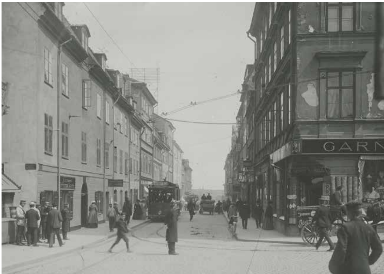
HORNSGATAN ÖSTERUT FRÅN MYNNINGEN AV RAGVALDSGATAN 1904. CARLBERGSKA HUSET NÄRMAST T.V.