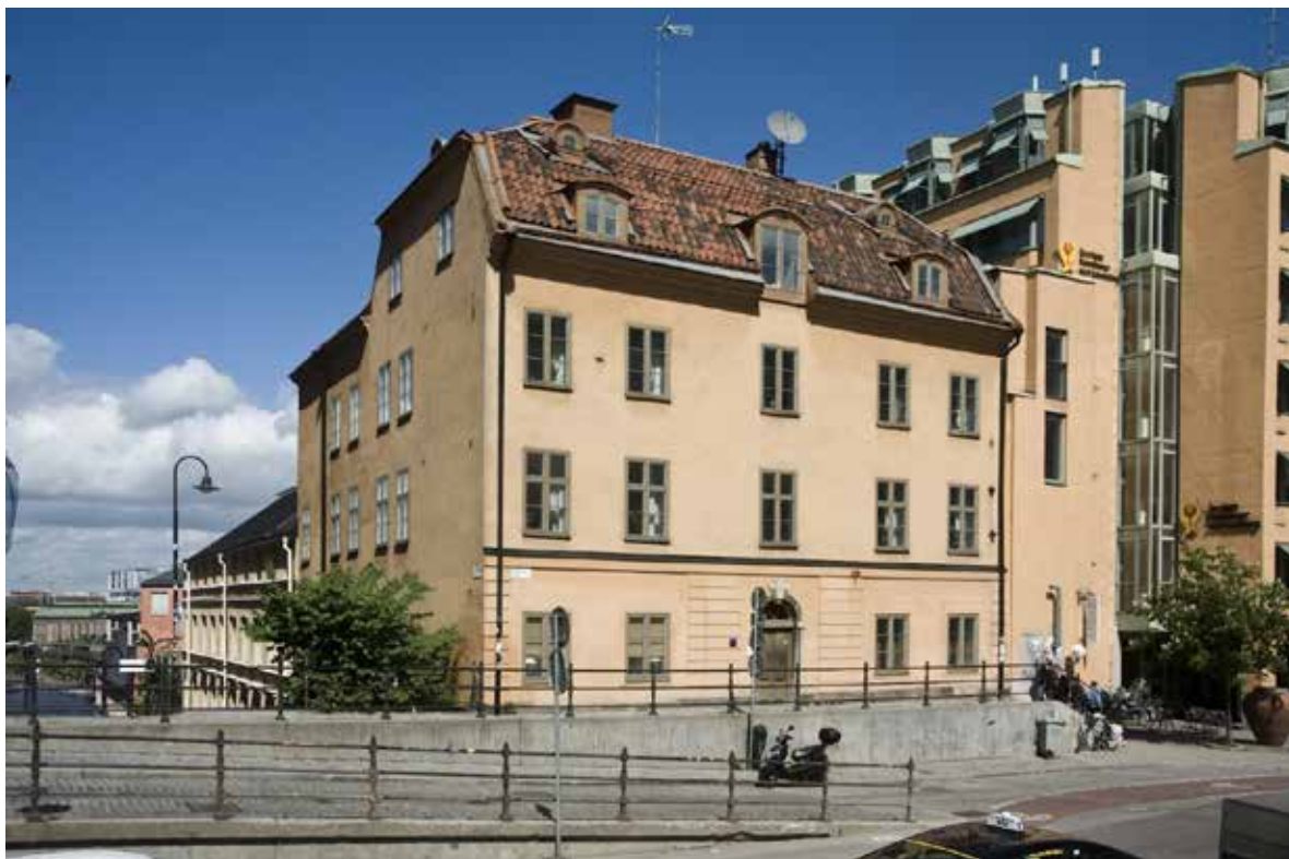
CARLBERGSKA HUSETS FASAD MOT HORNSGATAN.