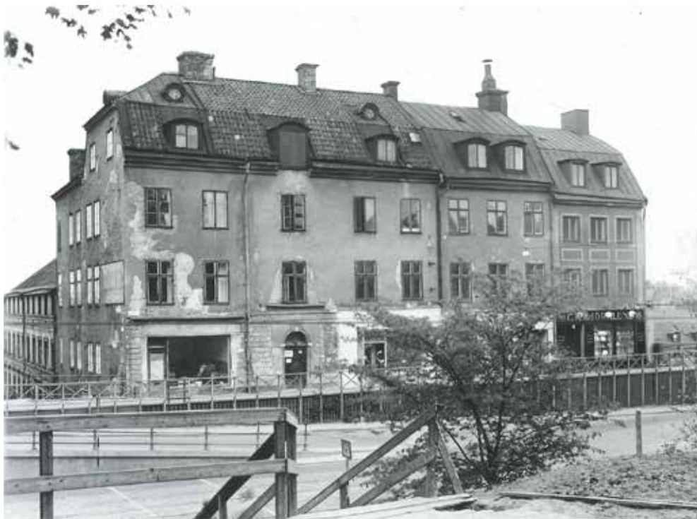
FOTO FRÅN 1950 MED CARLBERGSKA Huset T.V., INNAN DE ÄLDRE HUSEN T.H. REVS OCH DEN NYA KONTORSBYGGNADEN UPPFÖRDES.

och byggherrarna var ofta framgångsrika näringsidkare som både bodde och drev sin verksamhet i de nya husen. Under 1800-talet byggdes en stor del av husen om, och framförallt längs Hornsgatan fick husen påbyggnader och ny fasaddekor. Mot slutet av 1800-talet uppfördes också en del nya byggnader som Mariahissen och Laurinska huset.