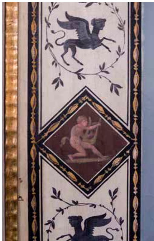
DETALJ AV VÄGGFÄLT FRÅN TIDEN OMKRING SEKELSKIFTET 1800.

rymma badrum. Kök av standardtyp monterades och fönstren byttes mot nya som följde indelningen från 1908. Under 2011 genomfördes fasadarbeten där den ursprungliga färgsättningen återskapades.