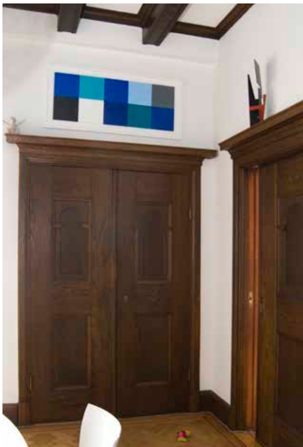
EKDÖRRAR I NYRENÄSSANSSTIL FRÅN BÖRJAN AV 1900-TALET I ATELJÉVÅNINGEN.

sterbhus sålde den till bokhandlaren August Rietz 1907. Rietz var framgångsrik i sina affärer och lät omedelbart göra en genomgripande ombyggnad såväl ut- som invändigt efter ritningar av Carl Kempendahl. Utvändigt gavs byggnaden en återhållen jugendgestalt med influenser från barocken, en kombination som var vanlig vid tiden. Taket höjdes åter och de brutna takfallen täcktes med glaserat tegel. Fasaden blev åter slätare, två balkonger byggdes mot torget och fönsterindelningen ändrades. I en ny omfattning av granit insattes dagens ekport. Gården byggdes över. Invändigt revs alla källarvalv utom ett, hiss installerades och trapphuset fick en ny form och gestaltning. Lägenhetsplanerna från 1760 behölls i stort men många lägenheter försågs med nya snickerier och parkettgolv. På våning 2 trappor upptäcktes omfattande väggmålningar från tiden omkring 1800 som togs fram och renoverades.