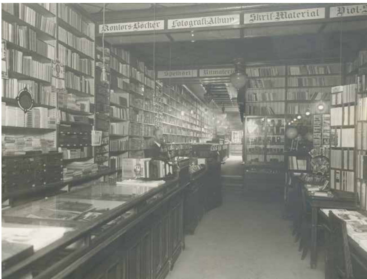
INTERIÖR FRÅN AUGUST RIETZ BOK- OCH PAPPERSHANDEL SOM LÅG I Huset FRAM TILL MITTEN AV 1920-TALET.

Byggnaden har en växlingsrik historia som börjar redan på 1640-talet. De förmögna ägarna och byggnadens läge i Södermalms mest representativa delar har medfört att byggnaden har anpassats till olika stil- och smakväxlingar under seklerna.