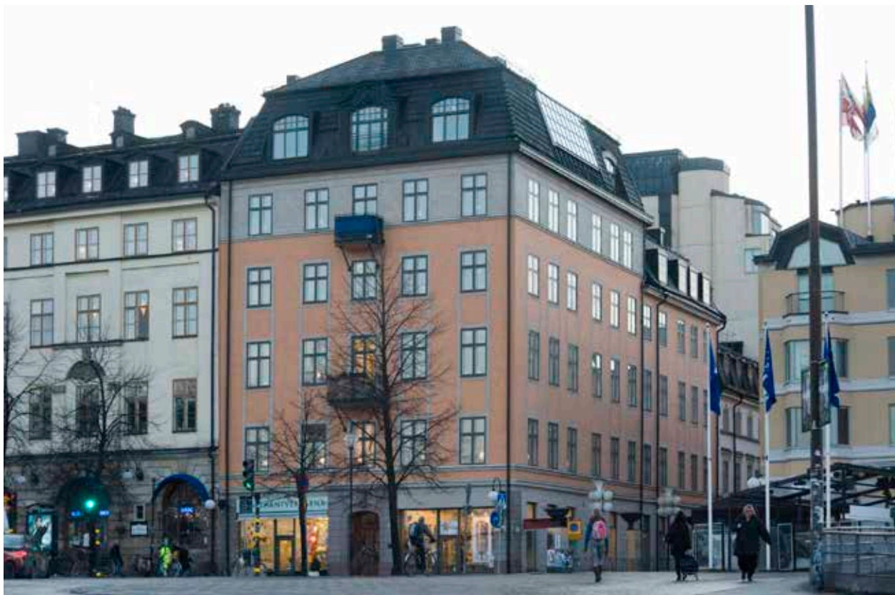
FASADEN MOT SÖDERMALMSTORG OCH GULDGRÄND.

bebyggelse skars av. Trots det har kvarteret, med sina husfasader mot Södermalmstorg och Hornsgatan, stor betydelse för stadsbilden och ett avsevärt historiskt intresse. Den blandade bebyggelsen representerar också olika tiders byggnadsideal från 1600-talet in i vår egen tid.