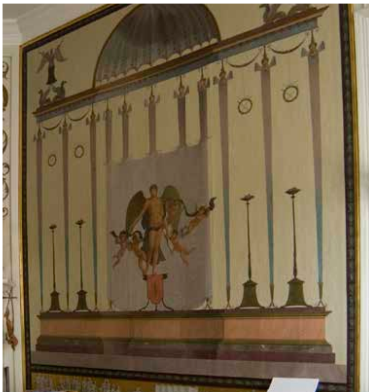
VÄGGFÄLT FRÅN TIDEN OMKRING SEKELSKIFTET 1800 MED SÅ KALLADE POMPEJANSKA MÅLNINGAR.