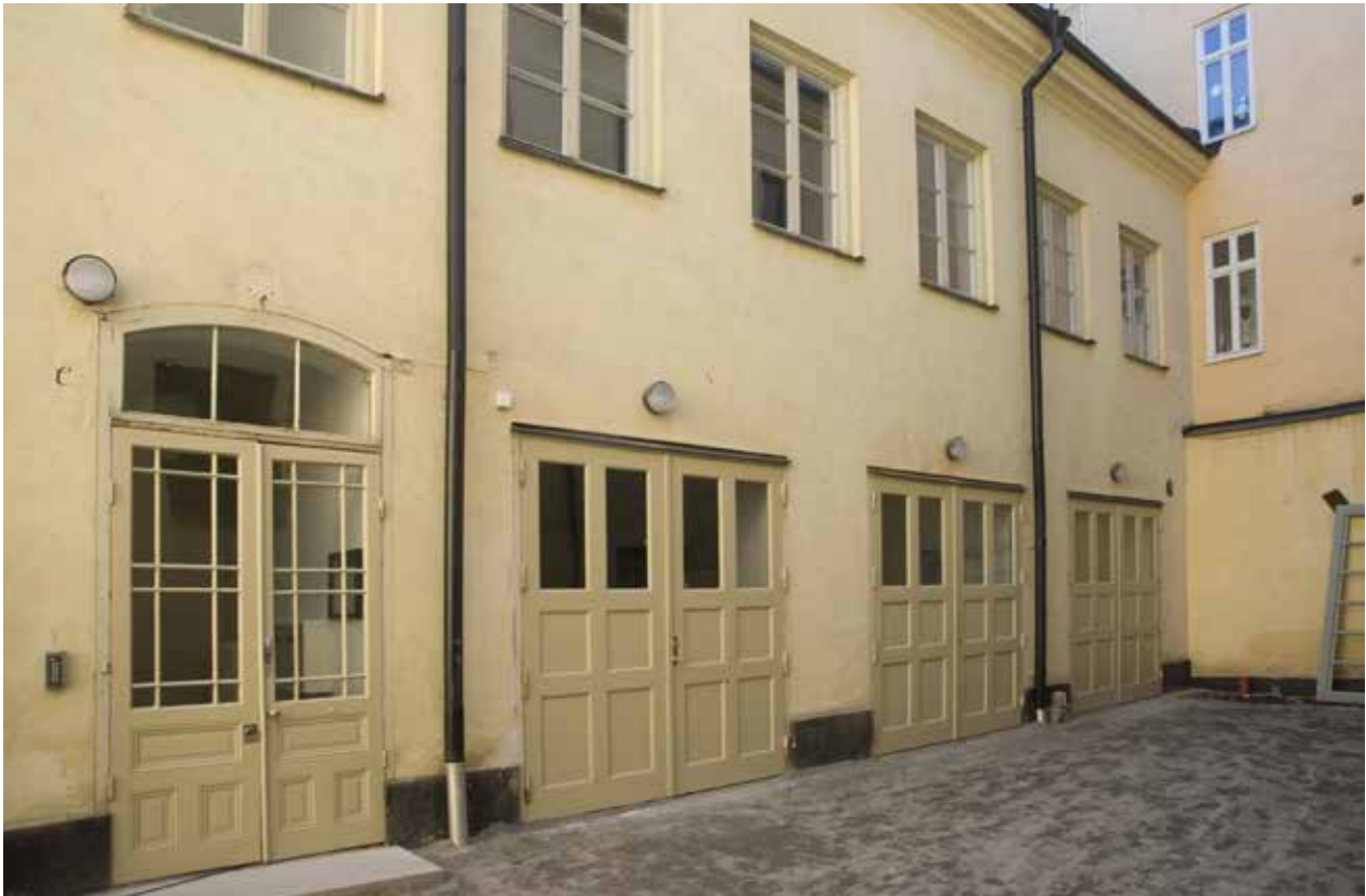
GÅRDSHUSETS FASAD MED TRE PORTAR SAMT ENTRÉ TILL TRAPPHUSET.

Köken utrustades med gasspis med marmorvägg, ekgolv, marmorklätt diskbord, porslinsvask, hyllor och skåp. Äldre eldstäder revs.