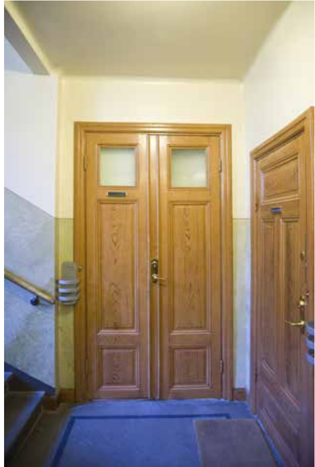
TRAPPHUSET HAR ETT CEMENTMOSAIKGOLV SAMT ÄLDRE HALVFRANSKA Fyllningsdörrar till lägenheterna.