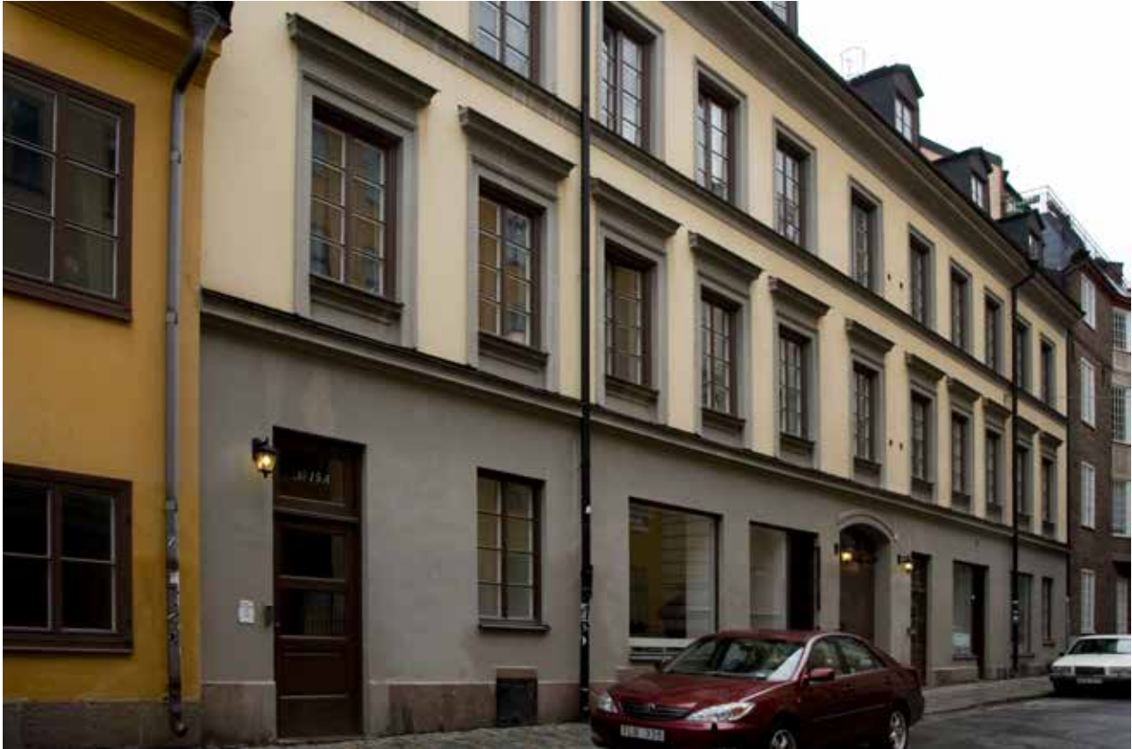
GATHUSETS FASAD MOT RAGVALDSGATAN.

skala uppfördes. Området återfick sin småskaliga omgivning med stenlagda gator och trottoarer.