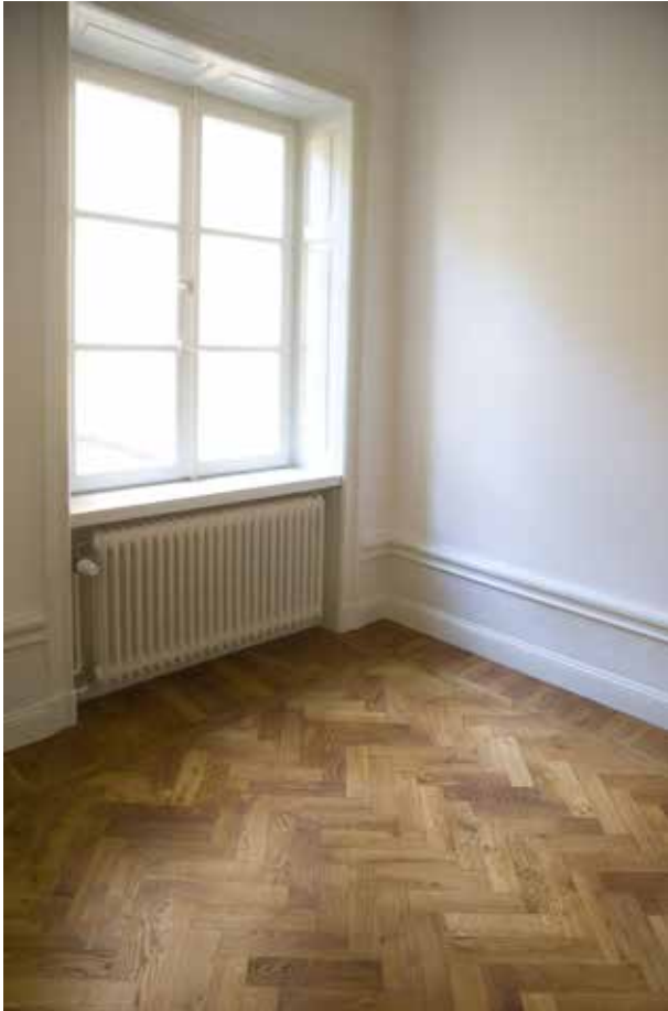
LÄGENHETERNA BEVARAR ÄLDRE FÖNSTER- OCH FOTPANELER FRÅN 1800-TALET. VID RENOVERINGEN UNDER 1920-TALET LADES PARKETTGOLV OCH DE SPRÖJSADE FÖNSTREN SATTES IN.