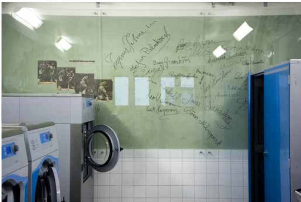
I TVÄTTSTUGAN FINNS BEVARADE SPÅR FRÅN TIDEN DÅ BOXNINGSKLUBBEN LINNÉA VERKADE I Huset.