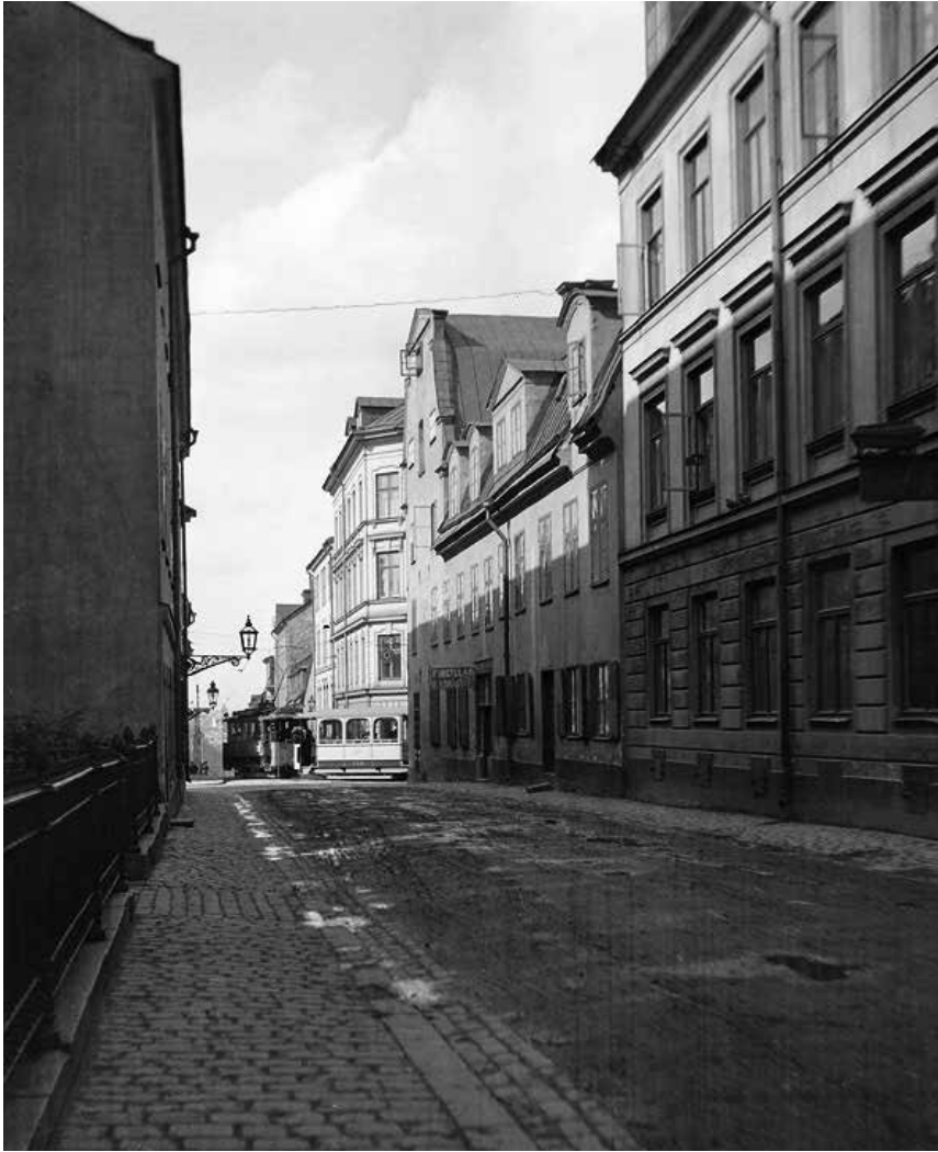
RAGVALDSGATAN OMKRING SEKELSKIFTET 1900. TILL HÖGER SYNS NR 19 MED URSPRUNGLIG FASADDEKOR OCH FÖNSTER. OKÄND FOTOGRAF. SSMF0037405.

Bostadshuset längs Ragvaldsgatan byggdes 1878 och ersatte då äldre stenhus och timmerhus från 1700- talet och tidigt 1800-tal. Det tidstypiska gathuset med nyrenässansfasader var karaktäristisk för sin tids omfattande hyreshusbyggande.