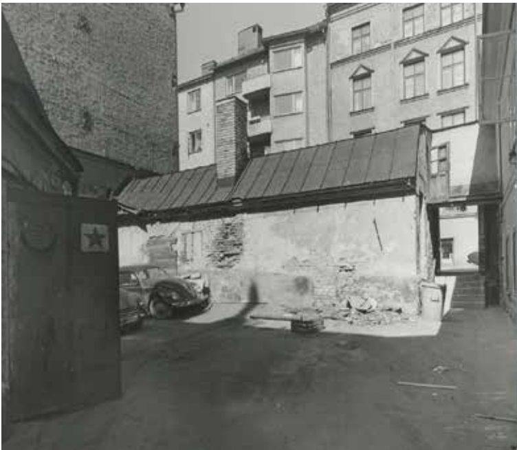
GÅRDSMILJÖN ÅR 1965 INNAN RENOVERINGEN. FOTO: AF PETERSENS. SSMF75394

Ormen större 7 är en del av de småskaliga stenhus som uppfördes efter den stora Mariabranden 1759. Boningshuset vid gatan uppfördes 1763–1765 och breddades inåt gården 1843 då även en del av det nuvarande gårdshuset uppfördes.