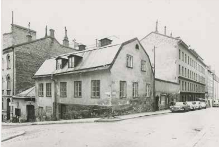
FASTIGHETEN MED DE ÄLDRE GÅRDSHUSEN ÅR 1968. FOTO H.N. SSMF93626.