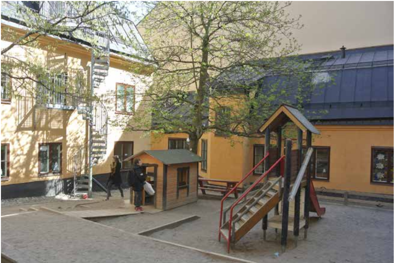
GÅRDSMILJÖ ANPASSAD FÖR FÖRSKOLAN MED GÅRDSHUSET I BAKGRUNDEN.