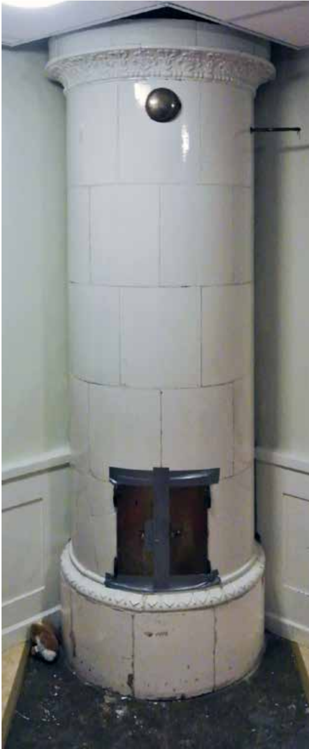
BEVARAD KAKELUGN FRÅN 1800-TALET SAMT BRÖSTNING MED Fyllningar.