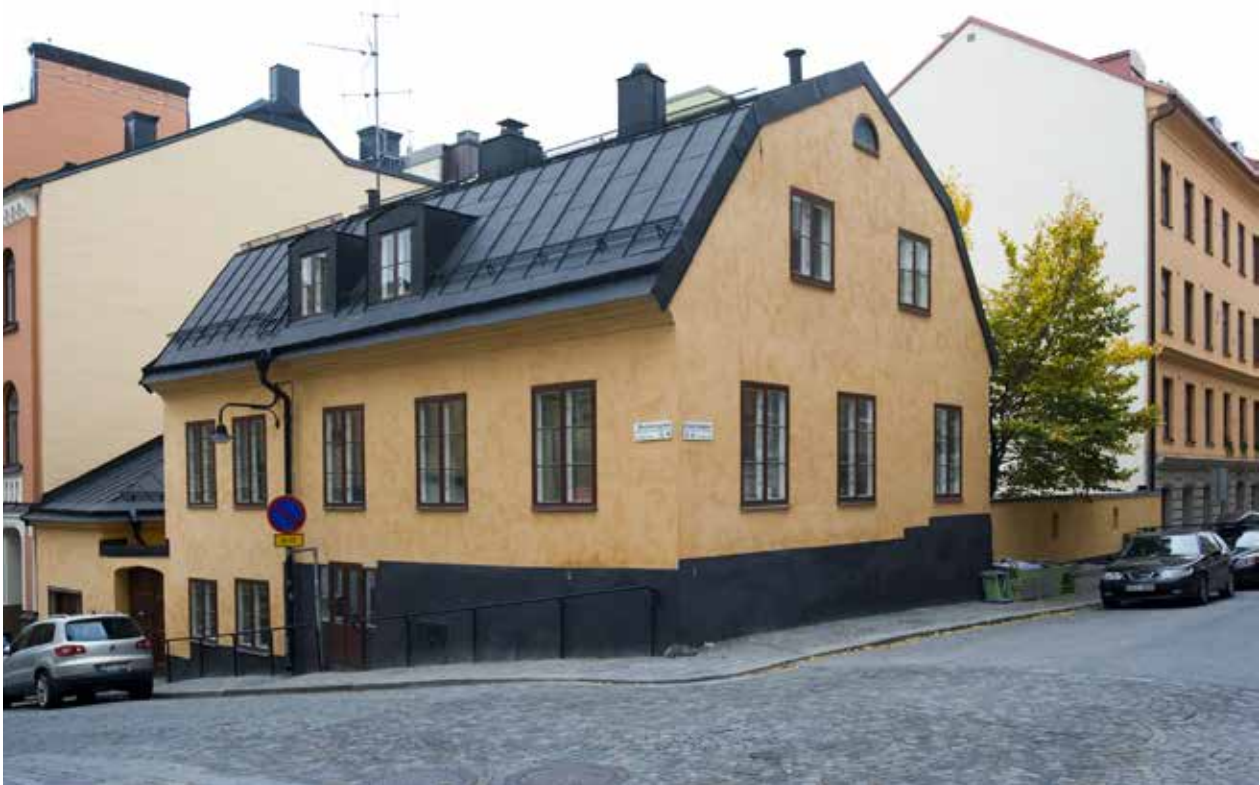
GATHUSET VID KORSNINGEN BRÄNNKYRKAGATAN OCH BLÄCKTORNSGRÄND.

De nerbrunna husen var till stor del av trä och ersattes efter branden helt av putsade tegelhus i enlighet med stadens byggnadsordningar från 1736 och 1763. Tidens kända murmästare fick uppdrag i området och byggherrarna var ofta framgångsrika näringsidkare som både bodde och drev sin verksamhet i de nya husen. Under 1800-talet byggdes en stor del av husen om, och framförallt längs Hornsgatan fick husen påbyggnader och ny fasaddekor. Mot slutet av 1800-talet uppfördes också en del nya byggnader som Mariahissen och Laurinska huset.