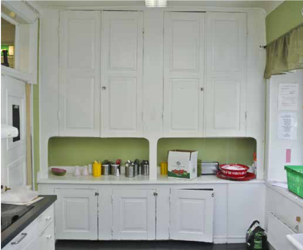
PLATSBYGGT KÖK, TROLIGTVIS FRÅN TIDEN OMKRING SEKELSKIFTET 1900.

hus nummer 2 på kartan. På gården stod även en latrinbyggnad av trä med avträden.