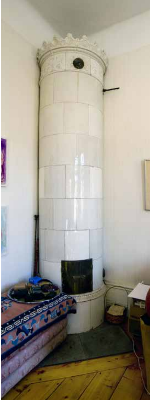
I LÄGENHETERNA FINNS BEVARADE KAKELUGNAR SAMT BRÄDGLV.

Lägenheterna bevarar mycket av den äldre inredningen men präglas även av moderniseringen med bland annat linoleummattor, kök och wc med dusch. I köket finns äldre platsbyggda skåp och skafferi kvar och i övriga rum finns bland annat brädgolv, fot- och fönsterpaneler, kakelugnar och par-samt enkeldörrar med fyllningar och samtida foder. Bevarade är även äldre klädkammare och passage med pärlspontsväggar och tak.