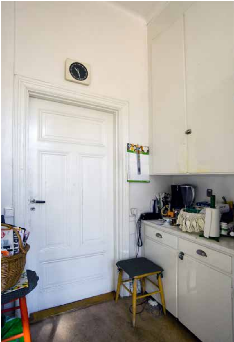
I KÖKEN FINNS BEVARADE ÄLDRE PLATSBYGGDA KÖKSSKÅP OCH SKAFFERIER. PÅ BILDEN SYNS ÄVEN EN ENKELDÖRR MED FYRA FYLLNINGAR.

plåt med plåtklädda skorstenar. Gårdsfasaden är utförd enkel med slätputs. Fönstren har en mitt- och tvärpost med fyra inåtgående bågar och sattes in under 1990-talet. Trapphusfönstren är avdelade till sex bågar.