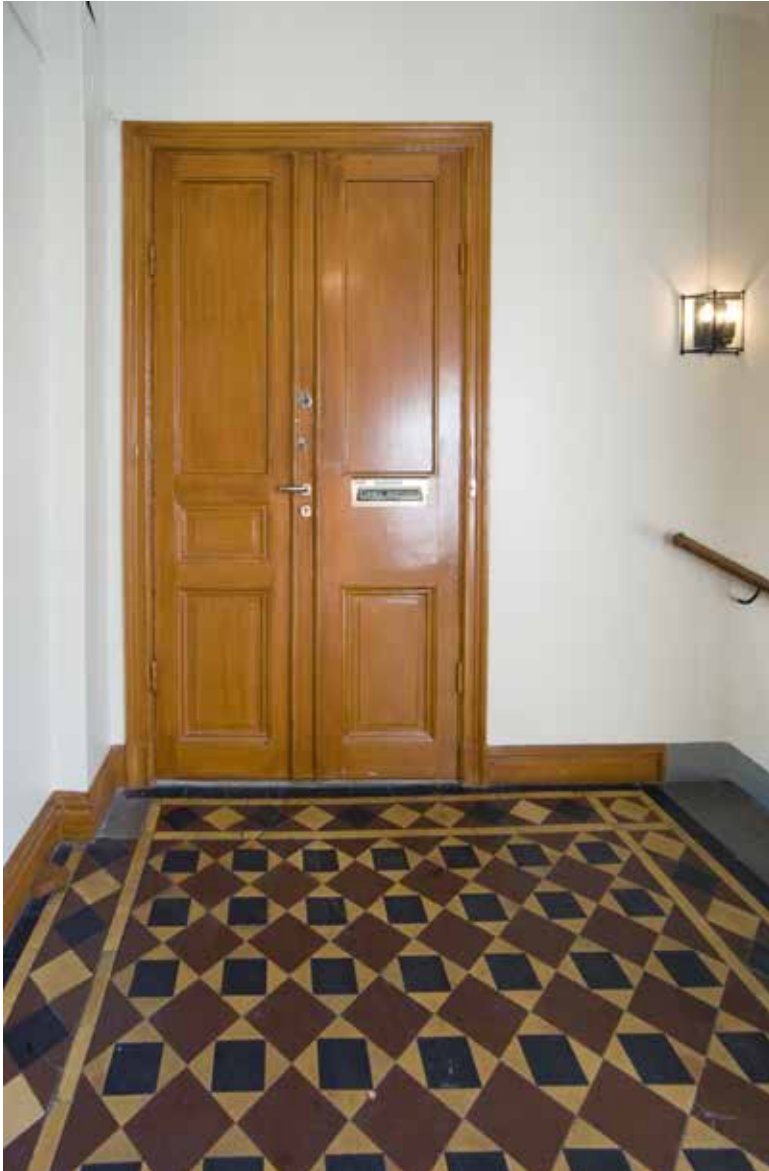
VILPLAN MED URSPRUNGLIGA VIKTORIAPLATTOR I DEKORATIVT MÖNSTER, PARDÖRRAR MED TRE Fyllningar och samtida profilerade foder.

vacker skuggverkan. När dekoren togs ned är oklart, men troligtvis genomfördes det en bit in på 1900-talet då idealet var släta ytor. Till skillnad mot gatans fasad uppfördes fasaden mot gården med en enkel, slät yta.