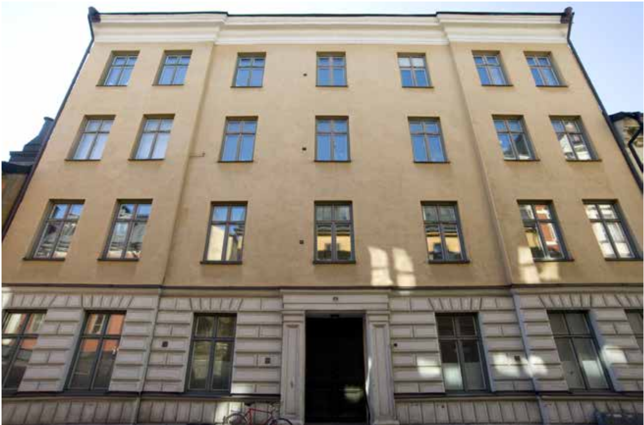
GATUFASAD MED RUSTICERAD SOCKELVÅNING, KRAFTIG TAKFOT, TVÅ UTKRAGANDE FASADPARTIER OCH EN TYDLIGT MARKERAD ENTRÉ. DE ÖVRE VÅNINGARNA HAR NEDTAGEN DEKOR.