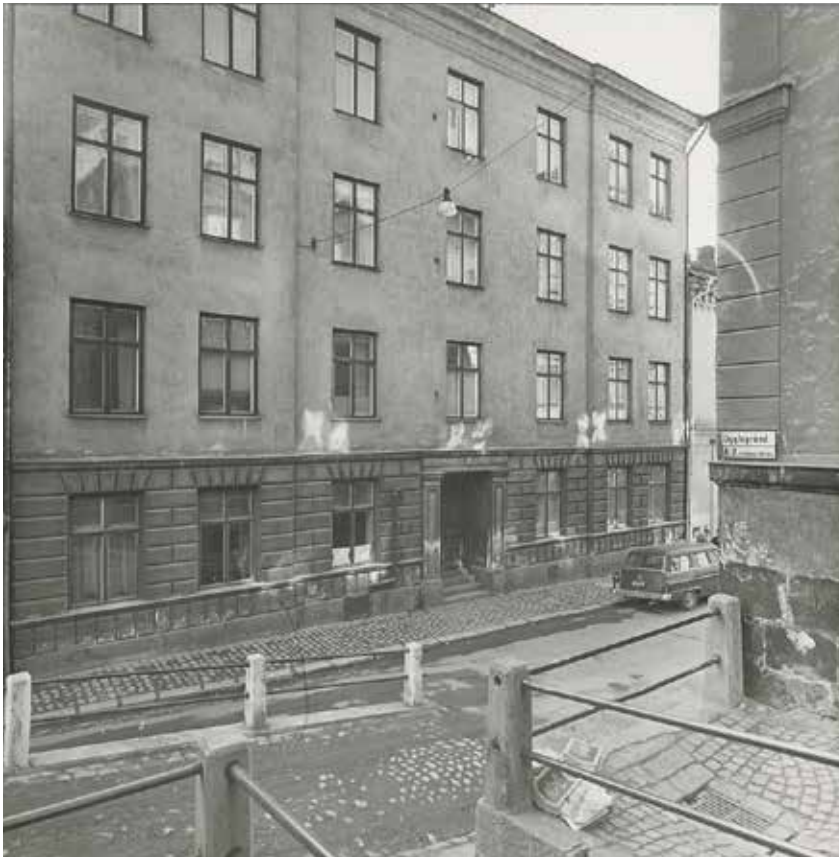
GATUFASADEN ÅR 1965, INNAN RENOVERINGEN. FOTO AV AF PETERSENS. SSMF75086

Ormen mindre 12 är ett exempel på de hyreshus som uppfördes i spekulations syfte under sent 1800-tal och som kompletterade den särpräglade bebyggelsen på Östra Mariaberget. Fastigheten bebyggdes 1884 av snickaren J. Johansson och genom sina olika lägenhetsstorlekar representerar hyreshuset dåtidens bostadsstandard för de mindre bemedlade och de med något större ekonomiska möjligheter.