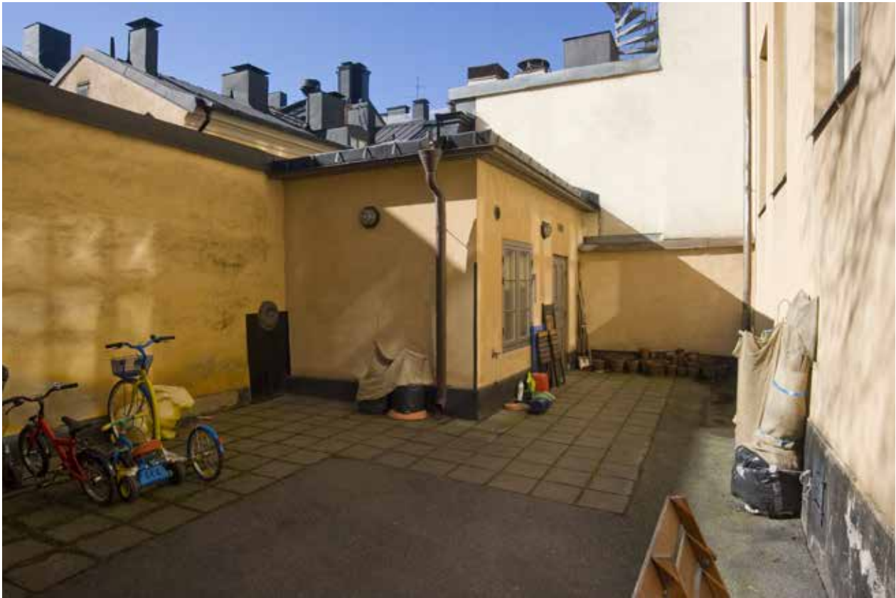
GÅRDSMILJÖ MED GÅRDSHUS. YTAN ÄR LAGT MED ASFALT OCH BETONGPLATTOR.