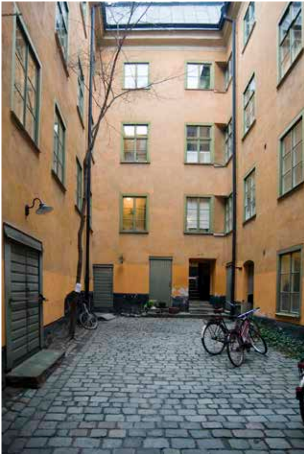
NEDRE GÅRDEN MED PASSAGE TILL ÖVRE GÅRDEN I HÖGRA HÖRNET.

på den först inlämnade ritningen, medan höjden blev densamma som på den senare ritningen.