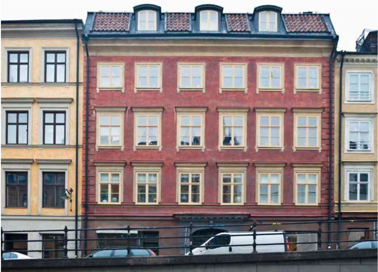
FASADEN MOT HORNSGATAN.