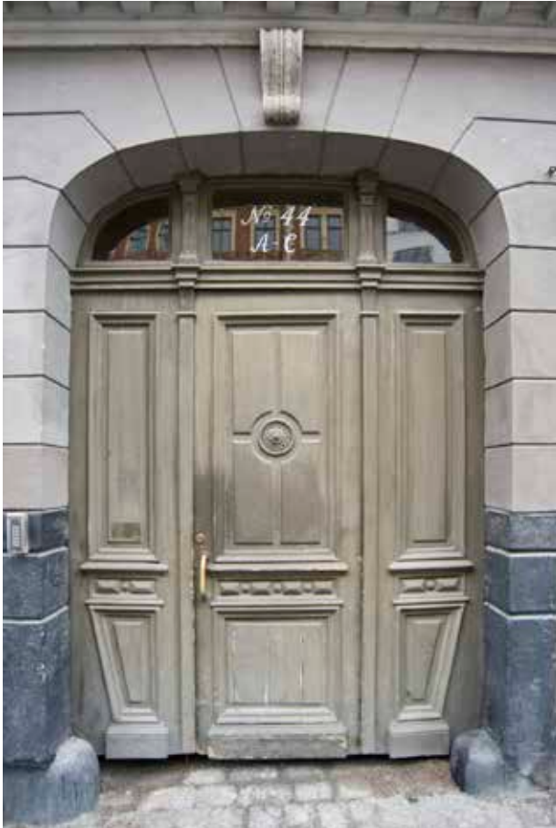
PORTEN VID HORNSGATAN.

Köksbyggnaden har senare byggts om till bostäder och lokaler.