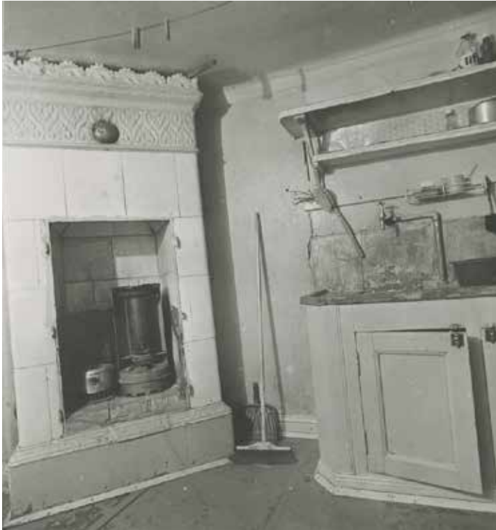
ETT KÖK I NORRA FLYGELN FÖRE RENOVERINGEN PÅ 1970-TALET. FOTO I. GUSTAFSSON 1970, SSM F98629.

Fastigheten Ormen Mindre 2 har en ålderdomlig karaktär. Byggnadernas utsträckning och placering på tomten är bevarad från 1760-talet, och gårdsmiljön med sina fyra längor är i huvudsak intakt från samma tid.