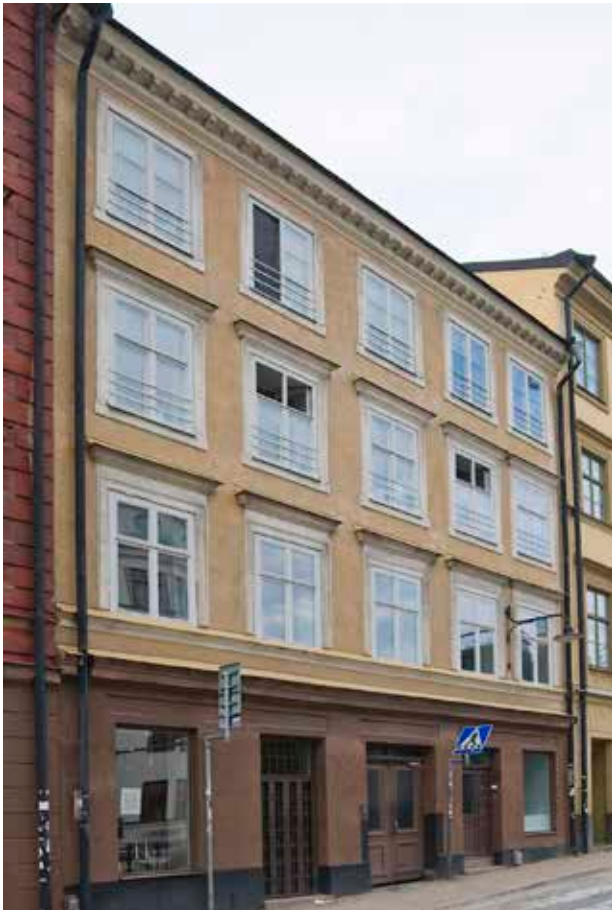
FASADEN MOT HORNSGATAN. DE LÅGA FÖNSTERBRÖSTNINGARNA I DE TVÅ ÖVRE VÅNINGARNA HAR GJORT DET NÖDVÄNDIG MED GALLER FÖR ATT FÖRHINDRA OLYCKOR.