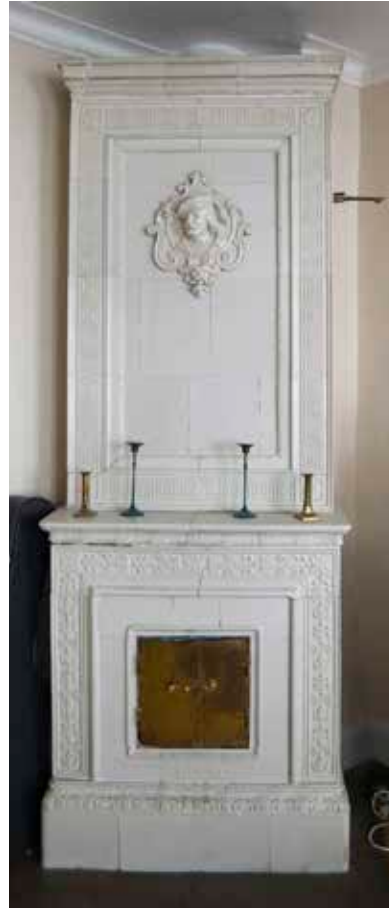
RIKT DEKORERAD KAKELUGN FRÅN 1800-TALET ANDRA HÄLFT.