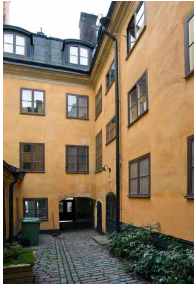
FASADEN MOT GÅRDEN.