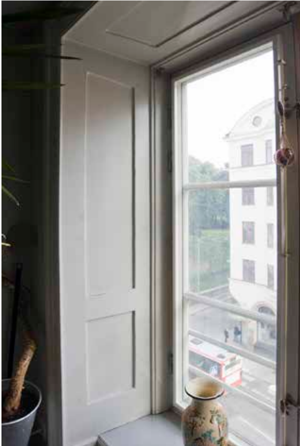
STENPROFILERAD FÖNSTERMYGPANEL.