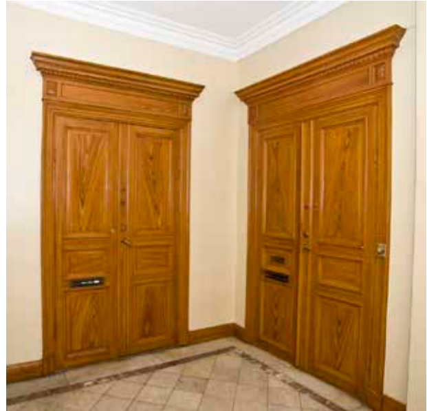
ÅDRINGSMÅLADE LÄGENHETSDÖRRAR FRÅN 1880-TALET I TRAPPHUSET.