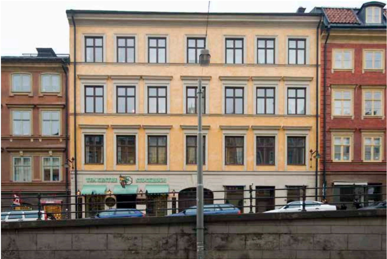
FASADEN MOT HORNSGATAN.

nya husen. Under 1800-talet byggdes en stor del av husen om, och framförallt längs Hornsgatan fick husen påbyggnader och ny fasaddekor. Mot slutet av 1800-talet uppfördes också en del nya byggnader som Mariahissen och Laurinska huset.