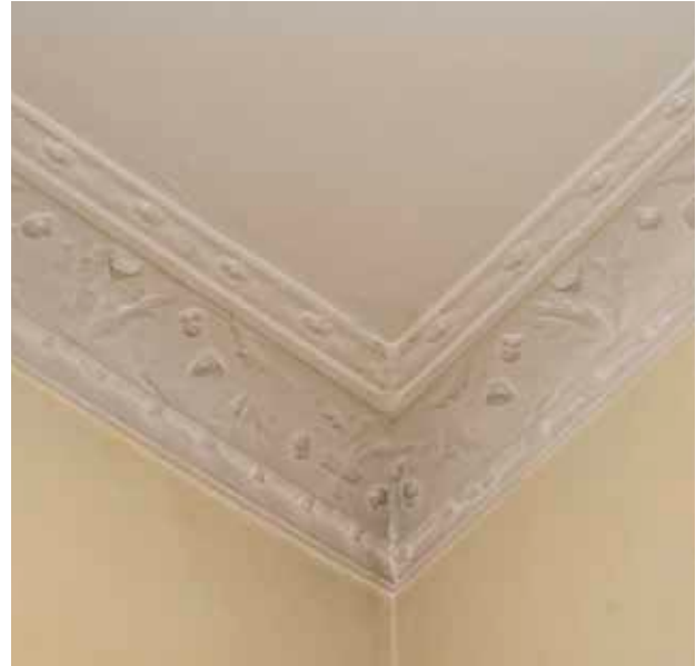
DEKORATIV TAKLIST.

Fram till 1940 när fastigheten förvärvades av Stockholms stad hade den samma ägare som nuvarande Ormen Mindre 14.