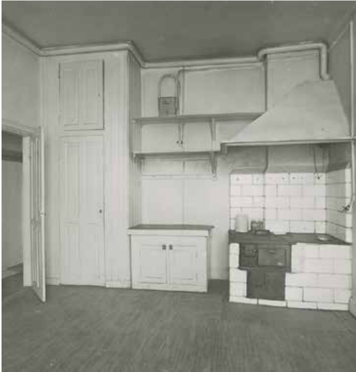
ETT AV KÖKEN FÖRE RENOVERINGEN PÅ 1970-TALET.