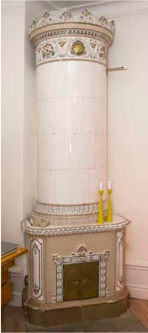
KAKELUGN MED FLERFÄRGAD DEKOR FRÅN 1880-TALET.

och tre fönsteraxlar bred, slätputsad byggnad som uppfördes 1895 (nr 4 på kartan). Övriga äldre hus inom fastigheten som nämnts ovan tillhörde nuvarande Ormen Mindre 14 och revs för en nybyggnad på 1890-talet.