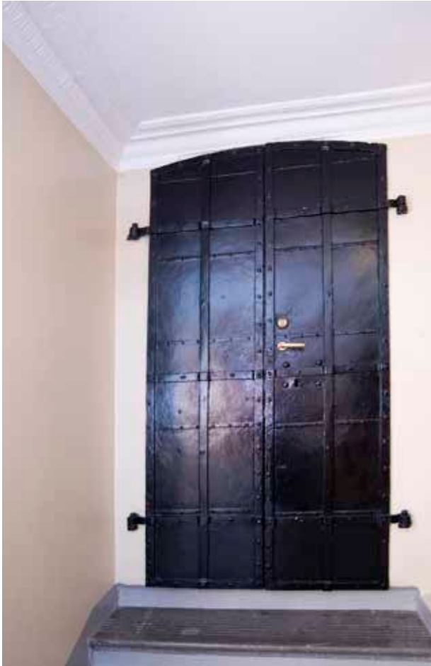
JÄRNDÖRR TILL VINDEN I TRAPPHUSET.

den tiden exempelvis de båda flyglarna byggts på med en våning och väveriet i gårdshuset gjorts om till bostäder. Flera byggnader hade tillkommit, bland annat hade delar av trädgården mot Brännkyrkagatan tagits i anspråk för ett vagnshus. Invändigt i gathuset och flyglarna var de flesta gröna kakelugnar utbytta mot flerfärgade kakelugnar. Den förnämsta våningen en trappa upp hade emellertid fått de för tiden moderna, vitglaserade ugnarna. Den övriga inredningen på det här planet bestod av franska limfärgstapeter klistrade på väv, fönster- och bröstpaneler samt pardörrar.