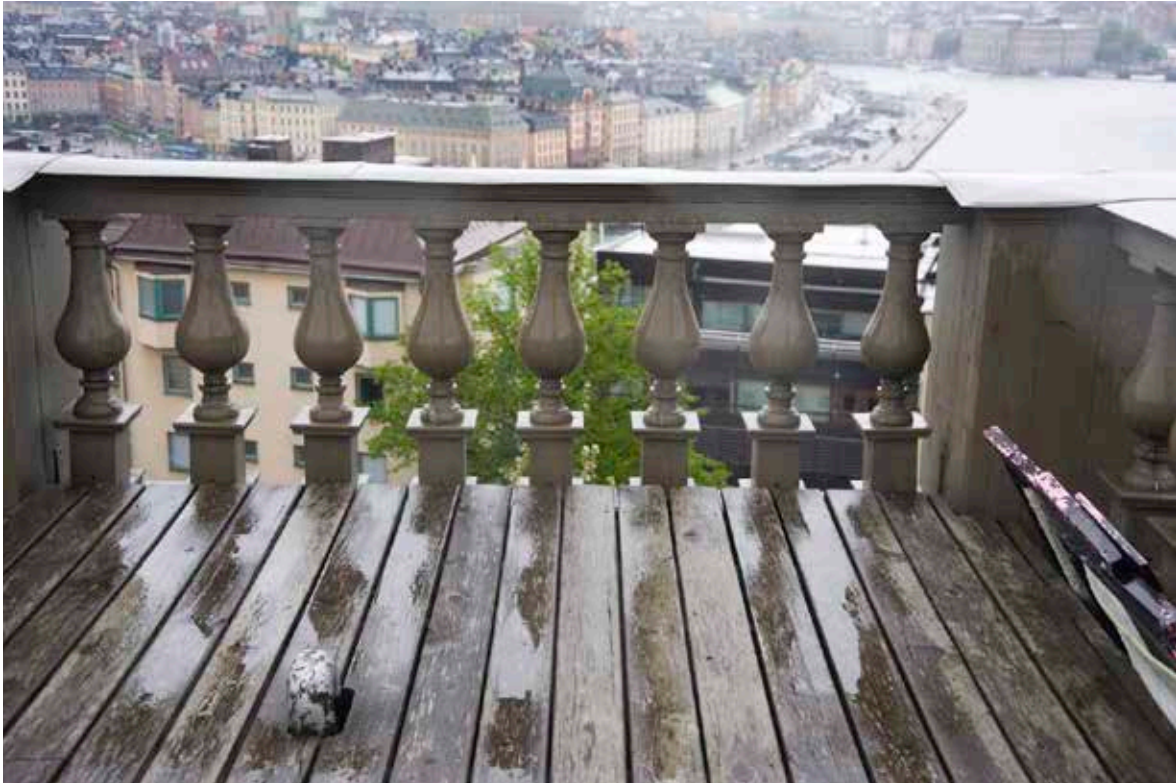
TAKTERRASSEN ANVÄNDES FÖR DEN ASTRONOMISKA UNDERVISNINGEN MEN GAV OCKSÅ EN FIN UTSIKT ÖVER VATTNET OCH HAMNEN VID SKEPPSBRON.

senare kunde skolan flytta in i det nybyggda huset. Byggnaden hade ritats av arkitekten Carl Gustaf Blom Carlsson och bestod av två våningar och en delvis inredd vind med takterrass. Samtidigt med skolhuset byggdes också en bagarstuga i en våning utmed Fiskargatan.