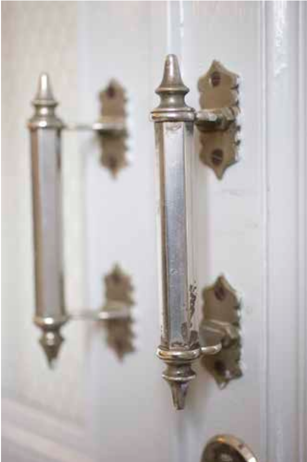
FÖRNICKLADE DRAGHANDTAG FRÅN 1800-TALET.

heterna från pappans undervisning och det hon lärde sig vid skolan kunde hon sedan själv undervisa privat under flera decennier.