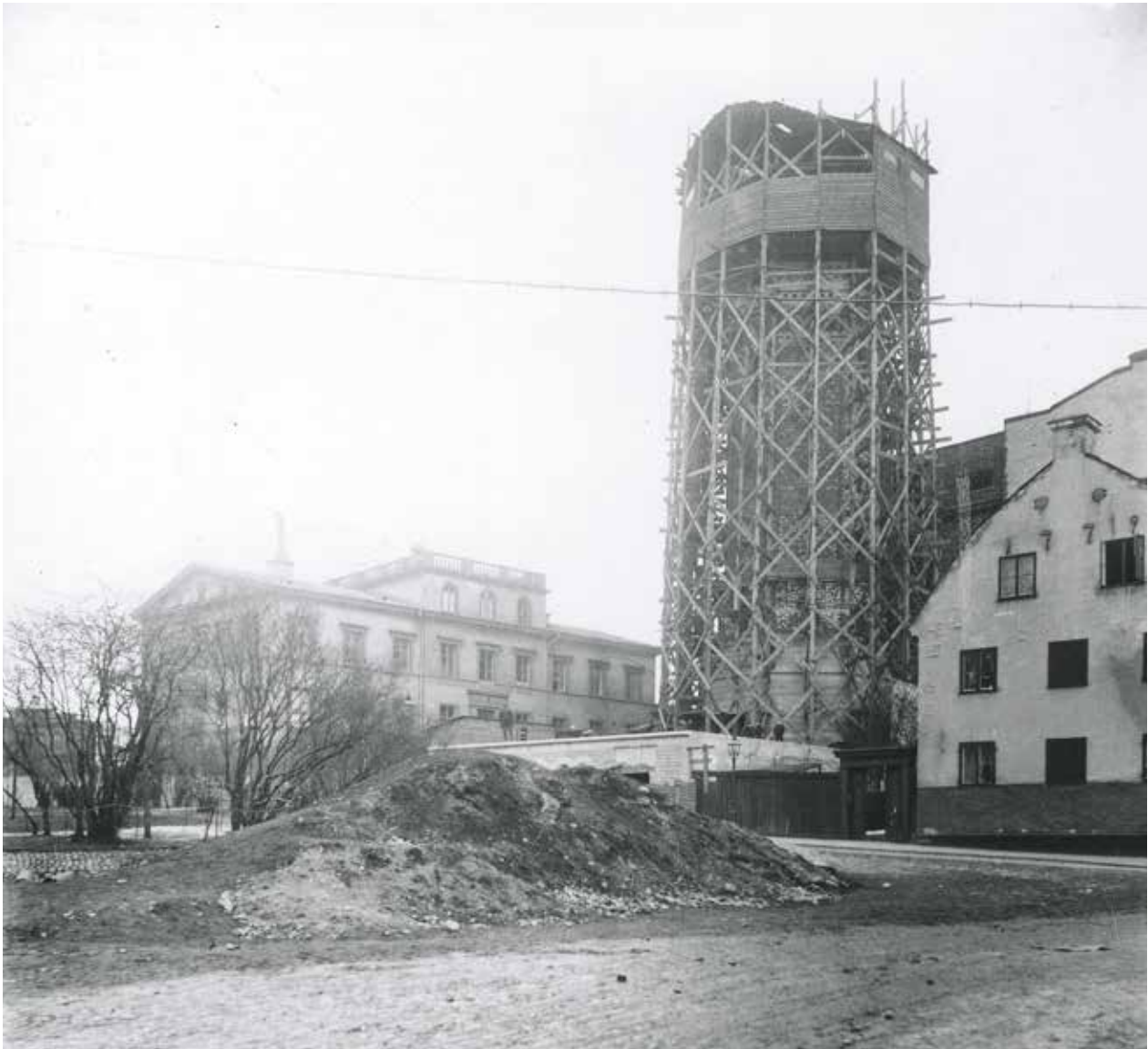
NAVIGATIONSSKOLAN OCH MOSEBACKE VATTENTORN UNDER UPPFÖRANDE 1896.

Navigationsskolan på Fiskargatan öppnade 1844 och är ett fint och för Stockholms innerstad ovanligt uttryck för dåtidens arkitekturideal med sina ljusputsade fasader och flacka tak. Även inredningarna är välbevarade och typiska för sin tid.