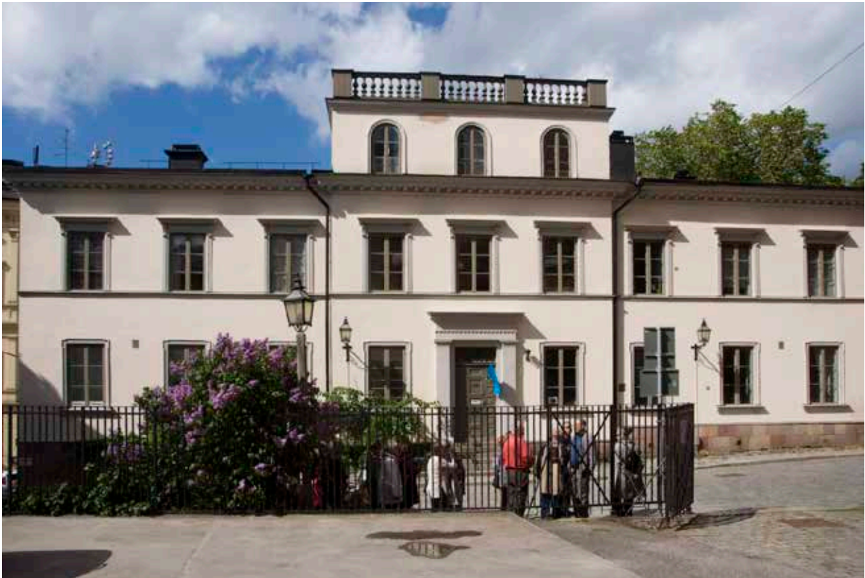
NAVIGATIONSSKOLANS FASAD MED SIN TYPISKA UTFORMNING FRÅN BYGGNADSTIDEN.

stadens ambitioner att endast stenhus borde uppföras. Genom tryckta byggnadsordningar senare under 1700- talet fick stadsarkitekten god kontroll över byggandet, och i strävan efter enhetlighet och brandsäkerhet uppfördes många välproportionerade och gulputsade borgarhus av sten. De flesta av områdets bevarade trähus kan därför placeras i det tidiga 1700-talet.