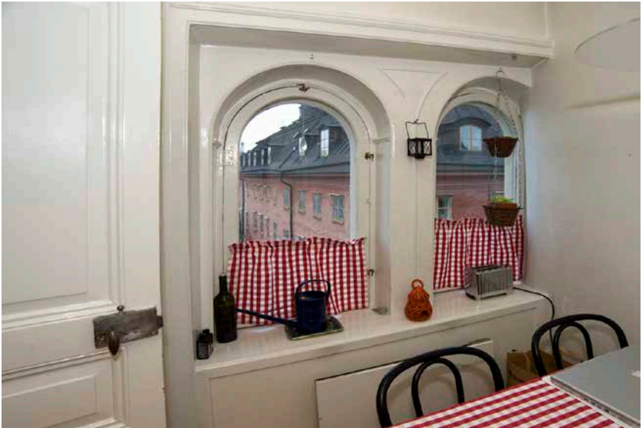
DEN ÖVERSTA VÅNINGEN BYGGDES PÅ 1861. I FLERA AV LÄGENHETERNA FINNS FAST INREDNING SEDAN UPPFÖRANDET.

Maria gifte sig med den tretton år yngre Carl Fredrik som 1856 sålde tryckeriet till Albert Bonnier. Efter det tycks Björklund ha dragit sig tillbaka från arbetslivet, endast 42 år gammal. Enligt mantalslängden 1860 bodde paret med ett barn i Milon 1. Vid renoveringen fick fasaderna enligt tidens mode en putsdekor i nyrenässansstil. De två butiksfönstren och entréporten i bottenvåningen mot Munkbron fick tre lika stora rundbågiga öppningar. Fastigheten påbyggdes med en delvis inredd attikavåning med fönster mot gatan och gränden. Portgången mot Munkbron fick ett nytt golv av marmor liksom vilplanen på våning 1 och 2 trappor. Trapploppet fick nya rundbågiga fönsteröppningar mot gården. I stort sett alla kakelugnar byttes ut och flera av rummen i de tre bostadvåningarna fick parkettgolv. På våning 2 trappor var dessa mönsterlagda av tre träslag, förmodligen ek, mahogny och lönn.