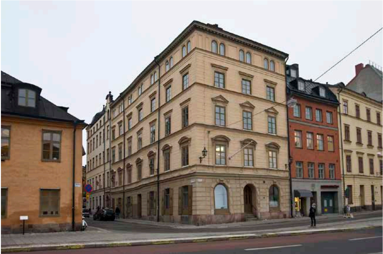
EXTERIÖREN PRÄGLAS AV EN RENOVERING OCH PÅBYGGNAD 1861 ENLIGT RITNINGAR AV J. F. ÅBOM. FASADERNA FICK ENLIGT TIDENS MODE EN PUTSDEKOR I NYRENÄSSANSSTIL. BYGGNADEN HAR GRUNDFÖRSTÄRKT OCH SPÅREN AV SÄTTNINGAR SYNS I DEN "KNYCK" SOM FINNS I MITTEN AV FASADEN MOT STORA GRÄMUNKEGRÄND.