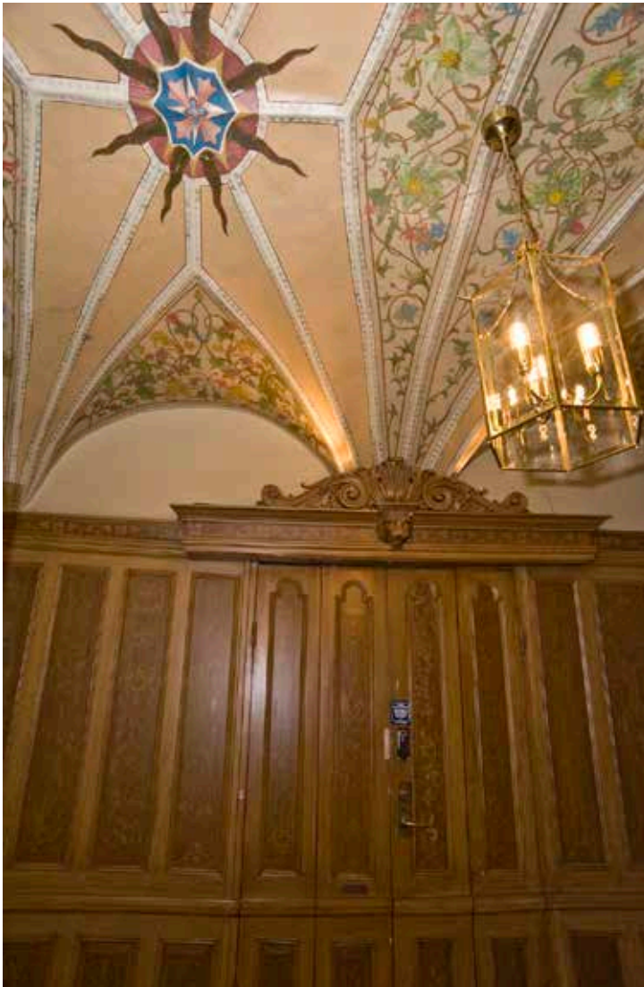
PORTGÅNGEN FICK EN HÖG TRÄPANEL OCH DE ÄLDRE VALVEN EN DEKORATIV MÅLNING VID 1861 ÅRS RENOVERING.

Till gårdsrummet ledde en välvd inkörsport. Från gården fanns trärappor upp till köken i det västra husets våningsplan. Detta bör ha inneburit att tjänstefolk och ägare kunde röra sig inom olika delar av huset utan att behöva mötas. Det västra huset hade säteritak.