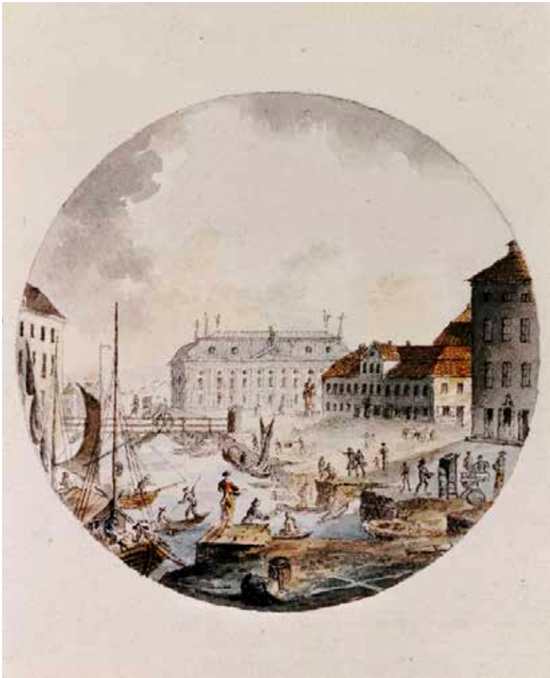
MILON 1 SKYMTAR LÄNGST TILL HÖGER I BILD MED SÄTERITAK MOT MUNKBRON. ETSNING AV J. P. CUMLIEN, FÖRE OMBYGGNADEN 1819. SSM 502620.

husen. Byggnaderna fick stora vindar i flera våningar med höga, branta tak och ofta en dekorativ fasadutsmückning i natursten. Samtidigt anpassades de nybyggda husen längs framför allt Nygatorna i väster till en reglerad stadsplan.