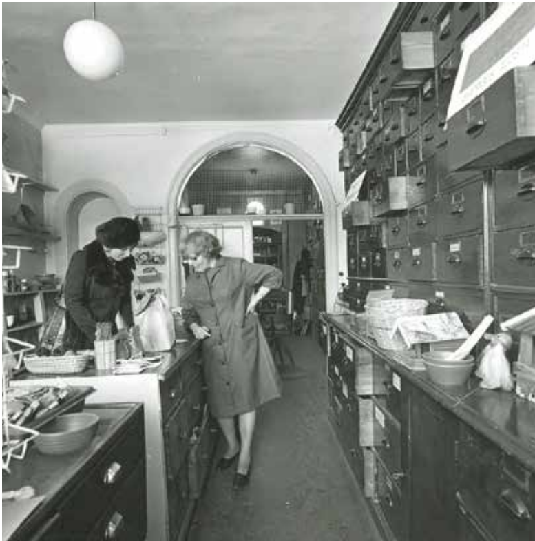
INTERIÖR I SELLBERGS FRÖHANDEL SOM LADESNER 1971.