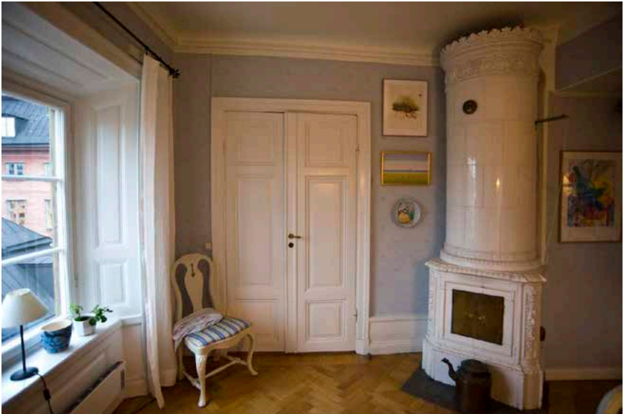
EN VÄLBEVARAD 1800-TALSINREDNING MED KAKELUGN, PARKETTGOLV, FÖNSTER- OCH DÖRRSNICKERIER SAMT TAKLIST.

gränd präglas av 1860-talets renovering med putsad dekor i nyrenässansstil och en påbyggd attikavåning med parställda, rundbågiga fönsteröppningar. Bottenvåningen är rusticerad med tre stora rundbågiga öppningar åt väster varav den mellersta är portgångens entré. Mot gränden i norr har bottenvåningens fönsteröppningar skulpterade fönsterluckor. Dörrbladet till det östra trapphuset har på baksidan skulpterad dekor i samma stil som fönsterluckorna medan dörren till den före detta körporten är sentida. Ett fönster i norra fasaden har äldre bågar och beslag, övriga har bytts under 1900-talet. Mot gata och gränd har det plåtklädda taket enkelt fall ovan en oinredd hanbjälksvind.