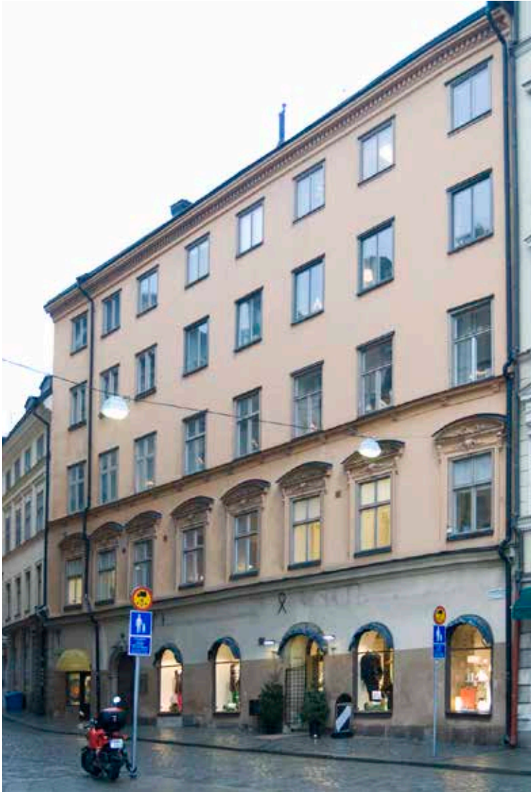
FASADEN MOT TRIEWALDSGRÄNDEN FICK SIN DEKOR AV LISTER OCH FÖNSTEROMFATTNINGAR PÅ 1860-TALET. I DEN FÖNSTERAXEL SOM LIGGER LÄNGST TILL HÖGER I BILD LÅG DEN GRÄND SOM NU INGÅR I FASTIGHETEN.

till en stormakt, gav en annan prägel åt staden med flera nybyggen men också modernisering av de äldre husen. Byggnaderna fick stora vindar i flera våningar med höga, branta tak och ofta en dekorativ fasadutsmückning i natursten. Samtidigt anpassades de nybyggda husen längs framför allt Nygatorna i väster till en reglerad stadsplan.