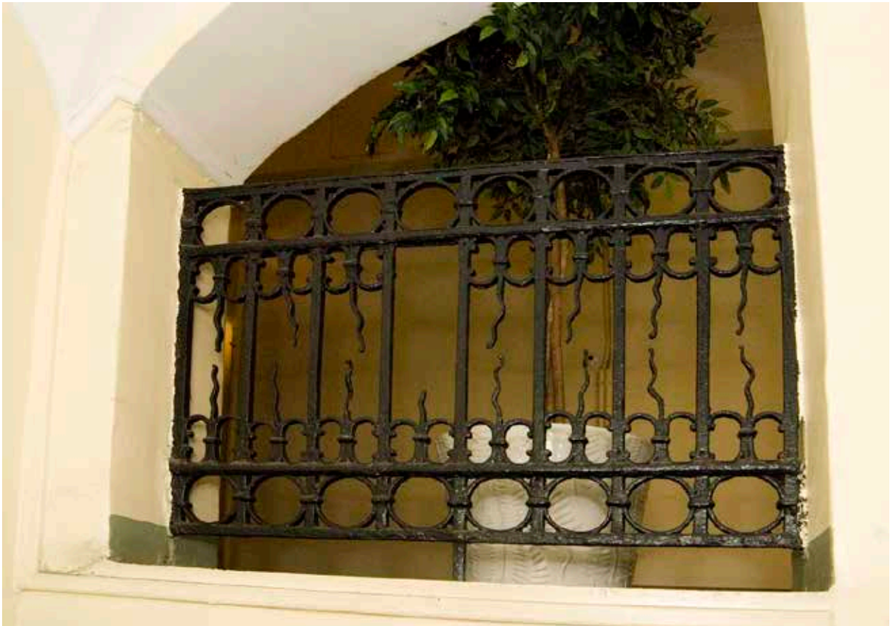
I TRAPPAN FINNS SMIDDA JÄRN RÄCKEN SOM FÖRMODLIGEN ÄR FRÅN TIDIGT 1700-TAL. LIKANDE RÄCKEN FINNS ÄVEN I GRANNFASTIGHETEN MEDUSA 4.

verstycken sitter i våning 1 trappa. Ovanför är fasaden slät förutom en profilerad taklist med tandsnitt. Bottenvåningen har rundbågiga fönster och rundbågiga portaler i roslagssandsten, en slät och en med profilering, båda från 1600-talet. I bottenvåningen sitter också ankarlutar av 1600-talstyp. Den södra fönsteraxeln döljer grändöverbyggnaden som är utförd till halva husdjupet. Gården är överbyggd till och med våning en trappa och asfalterad. Gårdsfasaden är slätputsad och har snygga ankarlutar och taklist med tandsnitt.