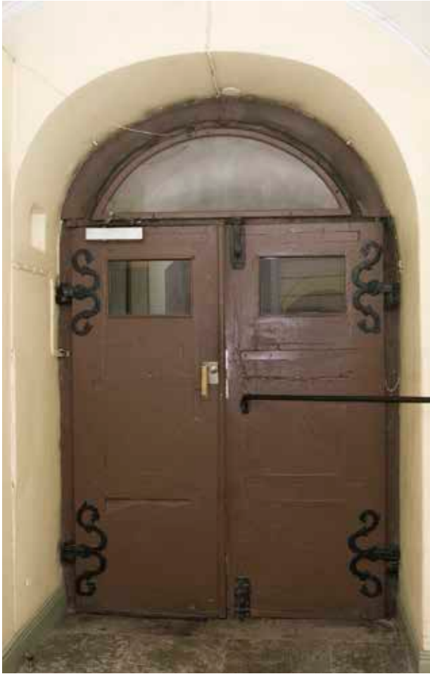
PARDÖRREN MOT GATAN SEDD INIFRÅN. DÖRRARNA HAR KRAFTIGA, S-FORMADE GÅNGJÄRN SOM LIKSOM PORTEN ÄR FRÅN TIDIGT 1700-TAL.