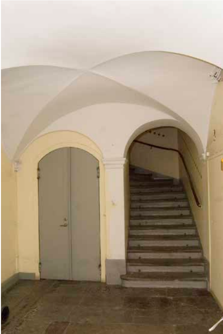
PORTGÅNGEN HAR KRYSSVALV OCH PILASTRAR MED KAPITÄL FRÅN 1600-TALET.

ningar i puts. Senare under 1800-talet och under 1900-talet gjordes förändringar i bottenvåningens lokaler. Bland annat ersattes 1600-talets valv 1889 av bärande gjutjärnskolonner i den stora butikslokalen.