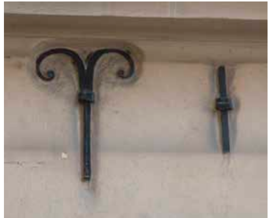
ANKARSLUT FRÅN 1600-TALET MED VOLUTER NEDSKJUTEN GENOM EN ÖGLA I DRAGJÄRNET.