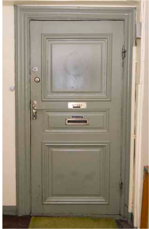
ENKELDÖRR FRÅN 1700-TALET MITT MED KRAFTIGT PROFILERAT FODER FRÅN SAMMA TID.

(som drev källaren Blå örnen) klagade över att Triewald byggt för hans fönster. Dessutom hade Triewald satt upp ett illastinkande avtråde under hans köksfönster.