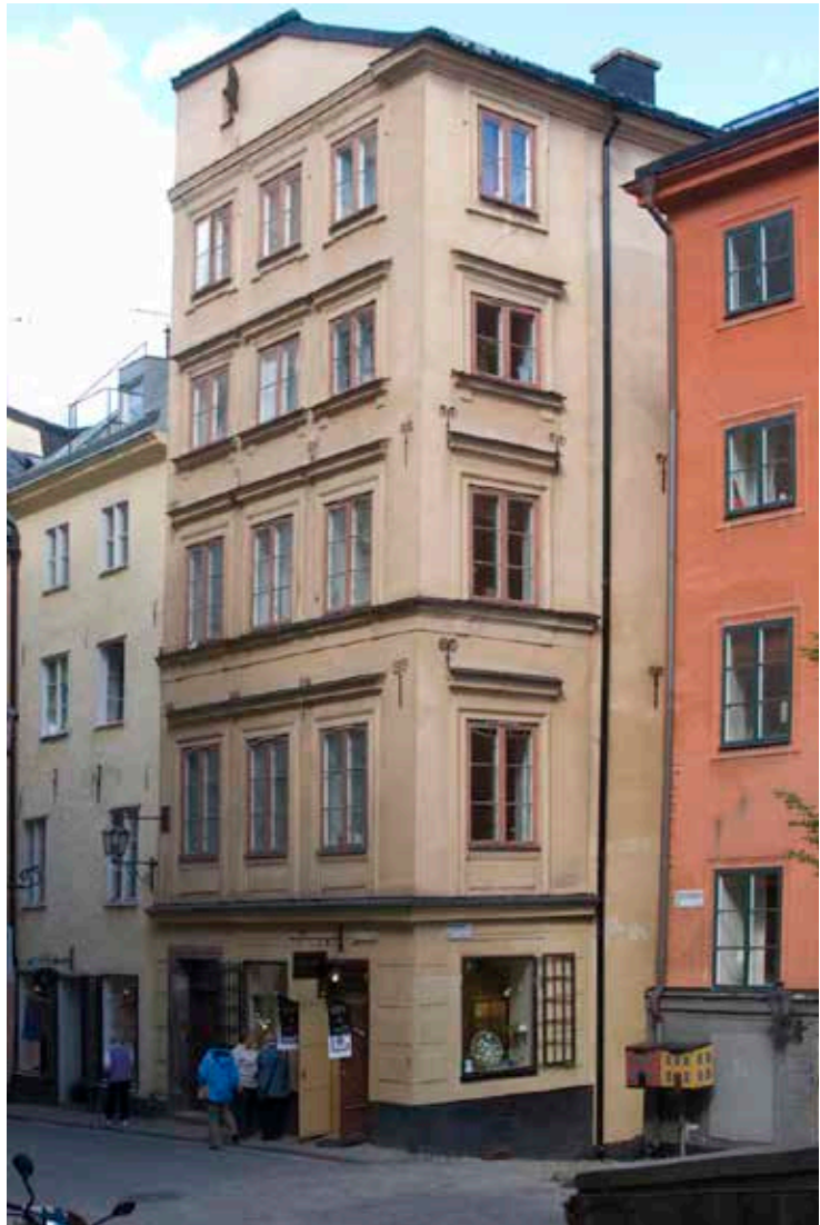
FASADEN MOT ÖSTERLÅNGGATAN.

många hus har i hög utsträckning kvar medeltida murverk bakom senare tiders fasadutformningar och inredningar.