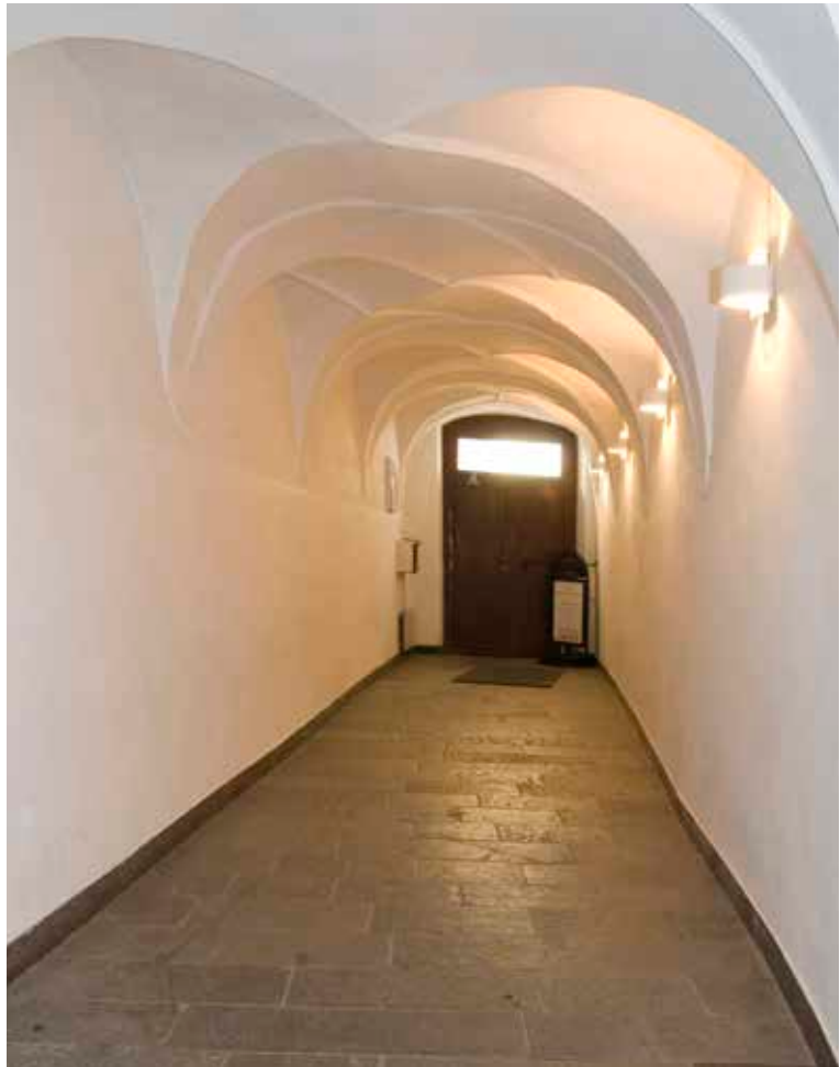
PORTGÅNGEN SETT MOT GATAN.