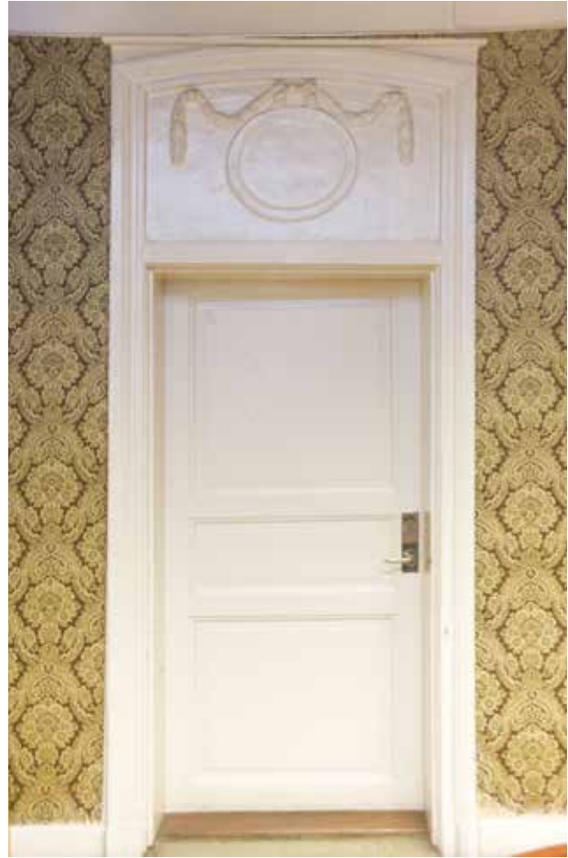
DÖRR MED DEKORATIVT DÖRRÖVERSTYCKE FRÅN SLUTET AV 1700-TALET.

huset. För att anpassa byggnaden efter verksamhetens behov gjordes en del förändringar, bland annat revs några mellanväggar för att skapa större lärosalar. Under 1900-talet har huset använts för slöjdsalar och skolkök. En period låg Stockholms systuga här och under andra världskriget användes lokalerna av Svensk-norska föreningen, som bildades för att stödja Norge under den tyska ockupationen. I dag används byggnaden som föreningsgård. En större upprustning gjordes 1968–1970 i samarbete med Stadsmuseet. Stadsholmen tog över fastigheten 2004.