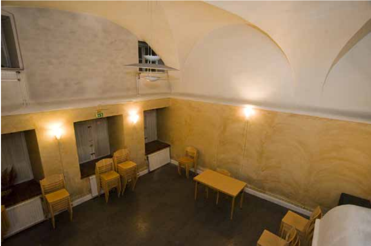
KÄLLARRUMMET I HÖRNET AV TIMMERMANSGATAN OCH S:T PAULSGATAN HAR TROLIGEN VARIT EN BAGARSTUGA.