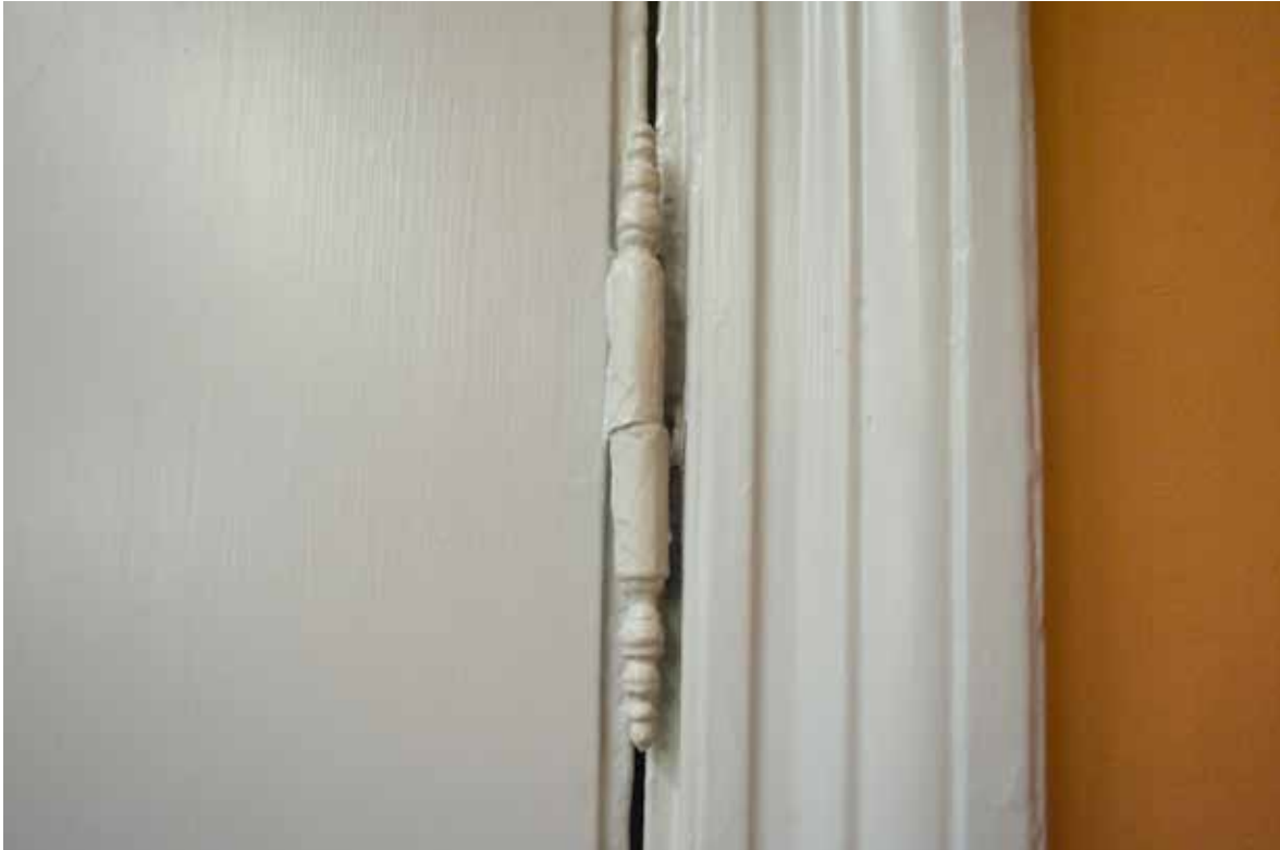
SÅ KALLAT FRANSKT GÅNGJÄRN AV 1700-TALSTYP.

vackert skuren gustaviansk träport från C. O. Hartwigs ombyggnad 1790.