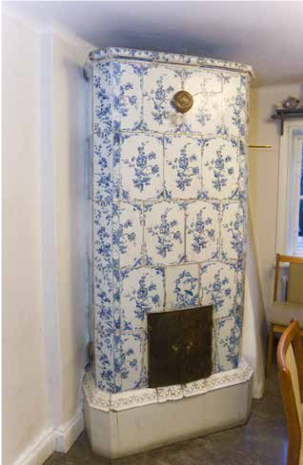
KAKELUGN MED BLÅ BLOMDEKOR FRÅN 1700-TALET.