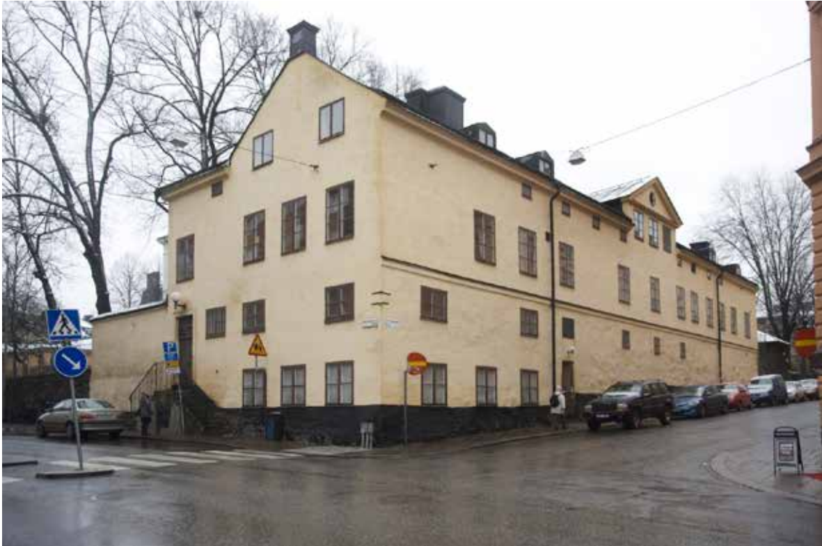
HARTWIGSKA HUSET FRÅN HÖRNET TIMMERMANSGATAN/S:T PAULSGATAN.

Fastigheten Magistern 3 är blåvärderad enligt Stockholms stadsmuseums kulturhistoriska klassificering. Det innebär att den har ett synnerligen stort kulturhistoriskt värde.