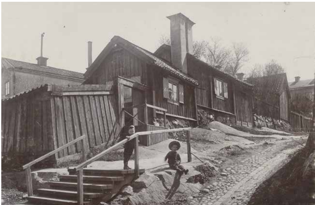
SKEPPARGRÄND SÖDERUT FRÅN LOTSGATAN. DE TVÅ SKORSTENARNA DOMINERAR INTRYCKET AV FASTIGHETEN LOTSSEN 20. E17719.

kom att vara i majoritet bland de boende fram till 1800-talets sista decennier. Sågargatan har till exempel fått sitt namn av de många sågare som arbetade vid varvet och också bodde i området. Även folk som arbetade på Beckholmen eller Djurgårdsvarvet hade med båt nära till arbetet och många bodde i Åsöbergets trästugor. Under 1700-talet tillkom nya yrkeskategorier bland de boende allteftersom flera textilmanufaktur etablerades på östra Södermalm.