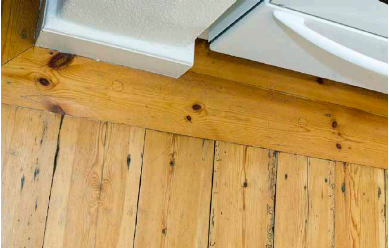
LOTSEN 20. ÄLDRE TRÄGOLV I HUSETS MITTPARTI.