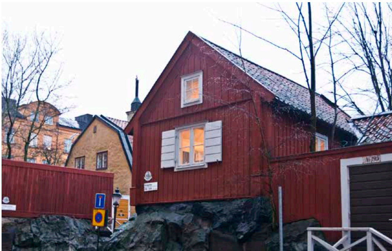
LOTSEN 21, DET VÄSTRA HUSET I GATHÖRNET. IDAG LIGGER HUSET HÖGT ÖVER GATANS NIVÅ.

Enligt foton från upprustningen 1960 har möjligen delar av huset vid Skeppargränd (3a) rekonstruerats. Delar av taket samt gavelröset mot söder var kvar och uppstöttat på fotografierna. Hur rekonstruktionen gick till är inte utrett men byggnaden är utvändigt anmärkningsvärt trogen mot utseendet före åtgärderna. Tillbyggnaden mot gården ersatte en tidigare tillbyggnad.