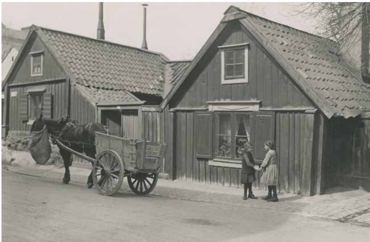
DE TVÅ BYGGNADERNA INOM LOTSSEN 21 SEDDA FRÅN ÅSÖGATAN INNAN DENNA SCHAKTADES NER. FOTO: G. HEURLIN 1917. FA 46637.