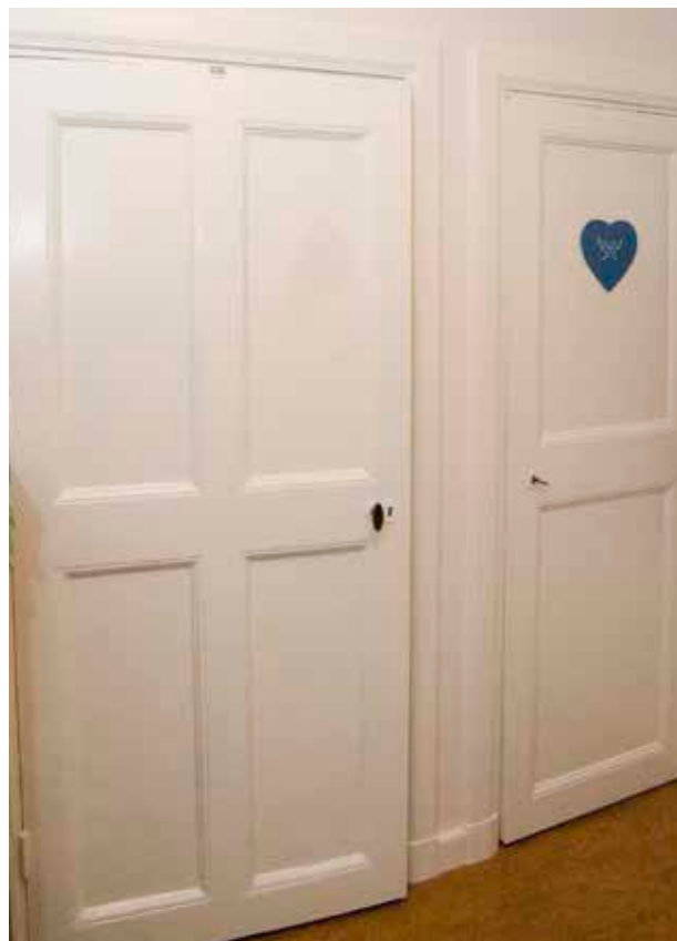
LOTSEN 20. TILL Huset FLYTTADES VID RENOVERINGEN PÅ 1960-TALET ÄLDRE DÖRRAR FRÅN BYGGNADER I CITY. HÄR TVÅ DÖRRAR MED FYRA RESPEKTIVE TVÅ UTANPÅLIGGANDE Fyllningar.

byggnaden (1a) var uppförd i två etapper, den första troligen på 1710-talet. En tillbyggnad gjordes senare mot öster. Fastigheten förvärvades av staden 1907. Äldre foton visar att huset då var målad med oljefärg i en ljus kulör. Någon gång mellan 1907 och 1941 gjordes en utvändig ombyggnad. Delar av en altan revs och en förstuga uppfördes. År 1941 dokumenterades vävtapeter från 1700-talets senare del eller början av 1800-talet med målade romantiska naturscenerier.