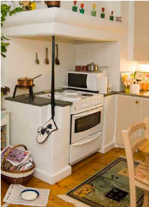
LOTSEN 20. I EN ÄLDRE MURAD SPIS HAR EN MODERN SPIS PASSATS IN.