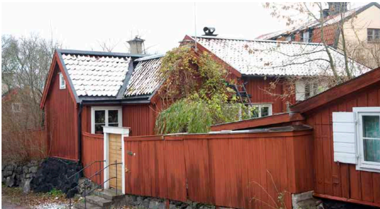
LOTSEN 8 SETT FRÅN GATAN.