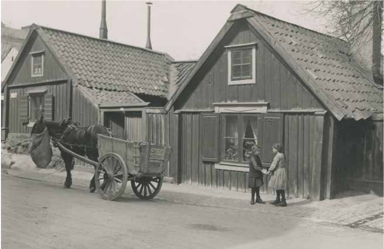
DE TVÅ BYGGNADERNA INOM LOTSSEN 21 SEDDA FRÅN ÅSÖGATAN INNAN DENNA SCHAKTADES NER. FOTO: G. HEURLIN 1917. FA 46637.