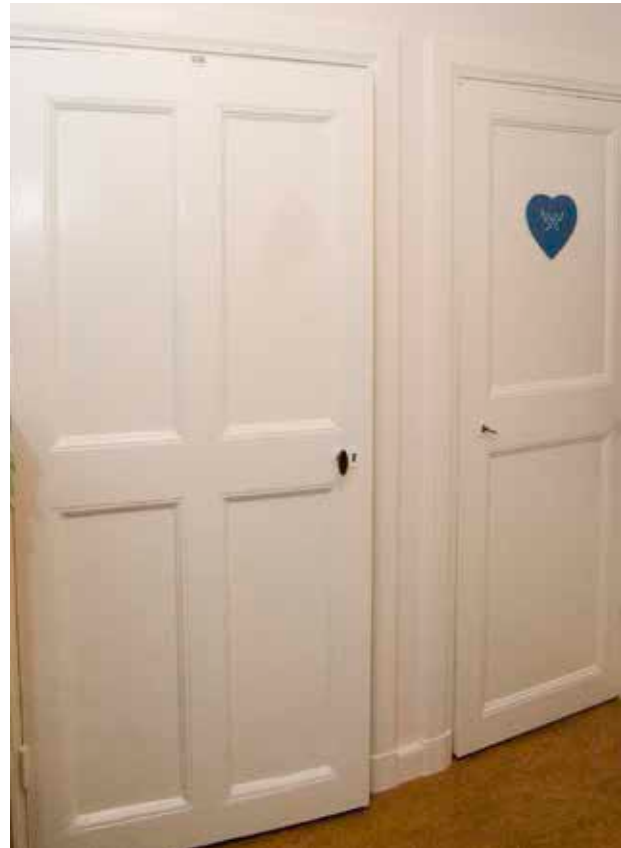
LOTSEN 20. TILL Huset FLYTTADES VID RENOVERINGEN PÅ 1960-TALET ÄLDRE DÖRRAR FRÅN BYGGNADER I CITY. HÄR TVÅ DÖRRAR MED FYRA RESPEKTIVE TVÅ UTANPÅLIGGANDE Fyllningar.

byggnaden (1a) var uppförd i två etapper, den första troligen på 1710-talet. En tillbyggnad gjordes senare mot öster. Fastigheten förvärvades av staden 1907. Äldre foton visar att huset då var målad med oljefärg i en ljus kulör. Någon gång mellan 1907 och 1941 gjordes en utvändig ombyggnad. Delar av en altan revs och en förstuga uppfördes. År 1941 dokumenterades vävtapeter från 1700-talets senare del eller början av 1800-talet med målade romantiska naturscenerier.