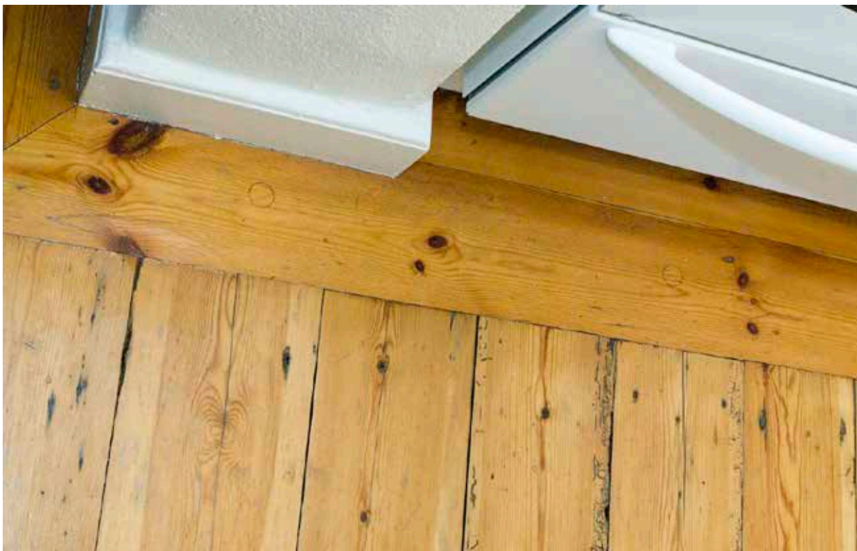
LOTSEN 20. ÄLDRE TRÄGOLV I HUSETS MITTPARTI.