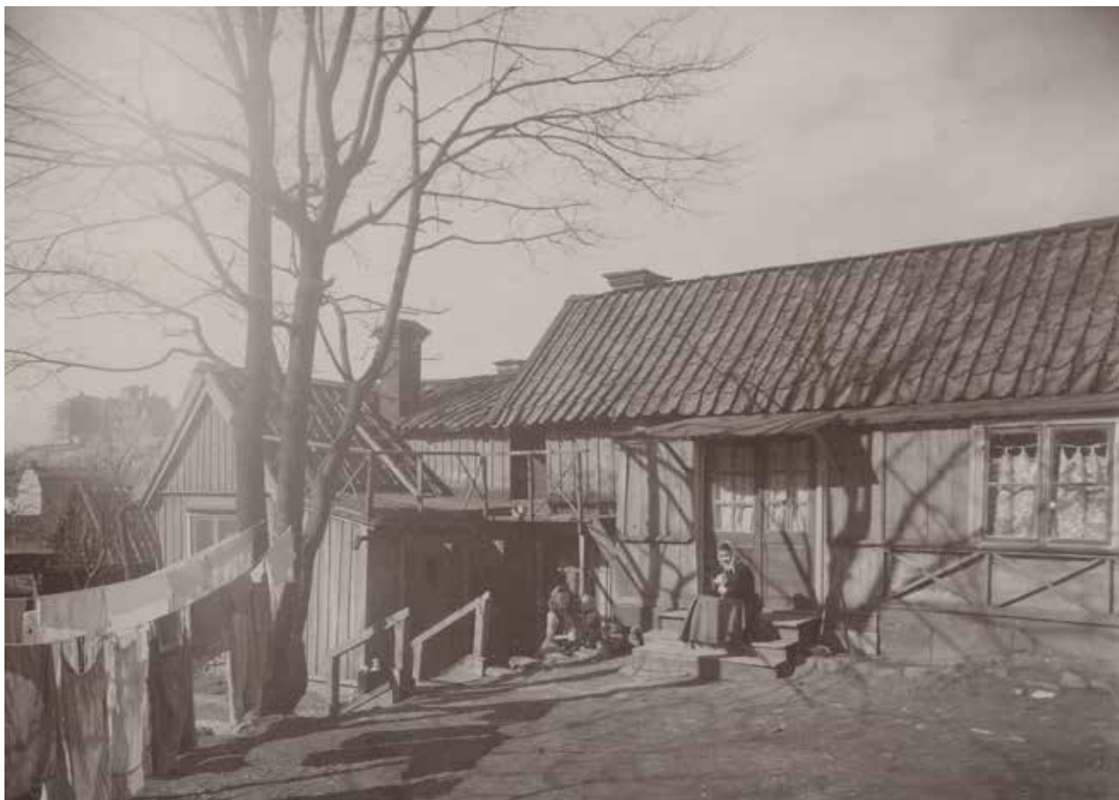
FASTIGHETEN LOTSEN 8 SETT FRÅN GÅRDEN OCH SÖDER. FOTO ATELJÉ LARSSON 1907. SSM:S ARKIV, C513.

Byggnaderna inom Lotsen 8, 20 och 21 är exempel på den småskaliga trähusbebyggelse som karaktäriserar Åsöberget. De ger en bild av bostadsförhållandena för arbetare och mindre bemedlade på malmarna från sent 1600-tal och in på 1900-talet.