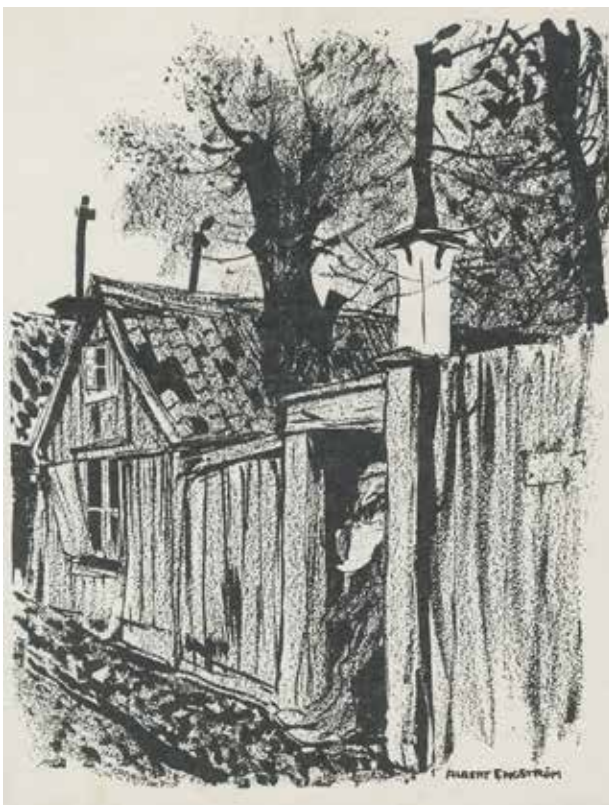
KOLINGEN I PORTEN TILL LOTSSEN 21. FOTOTYPI EFTER TECKNING AV ALBERT ENGSTRÖM. F75951.