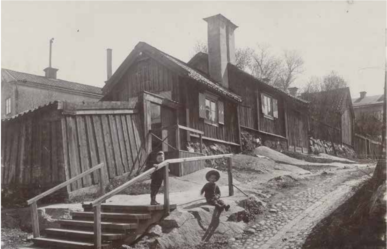
SKEPPARGRÄND SÖDERUT FRÅN LOTSGATAN. DE TVÅ SKORSTENARNA DOMINERAR INTRYCKET AV FASTIGHETEN LOTSSEN 20. E17719.

kom att vara i majoritet bland de boende fram till 1800-talets sista decennier. Sågargatan har till exempel fått sitt namn av de många sågare som arbetade vid varvet och också bodde i området. Även folk som arbetade på Beckholmen eller Djurgårdsvarvet hade med båt nära till arbetet och många bodde i Åsöbergets trästugor. Under 1700-talet tillkom nya yrkeskategorier bland de boende allteftersom flera textilmanufaktur etablerades på östra Södermalm.