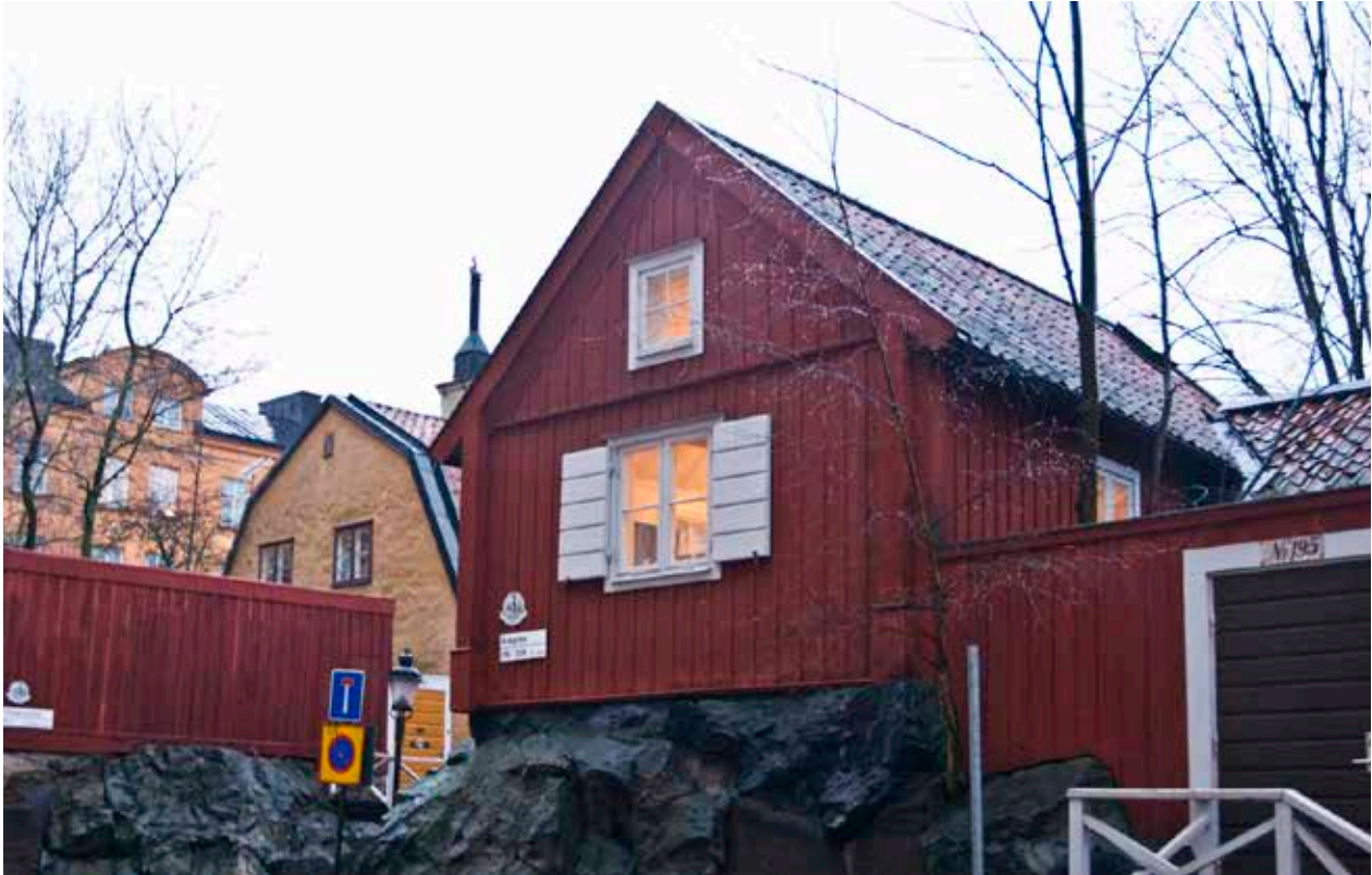
LOTSEN 21, DET VÄSTRA HUSET I GATHÖRNET. IDAG LIGGER HUSET HÖGT ÖVER GATANS NIVÅ.

Enligt foton från upprustningen 1960 har möjligen delar av huset vid Skeppargränd (3a) rekonstruerats. Delar av taket samt gavelröset mot söder var kvar och uppstöttat på fotografierna. Hur rekonstruktionen gick till är inte utrett men byggnaden är utvändigt anmärkningsvärt trogen mot utseendet före åtgärderna. Tillbyggnaden mot gården ersatte en tidigare tillbyggnad.