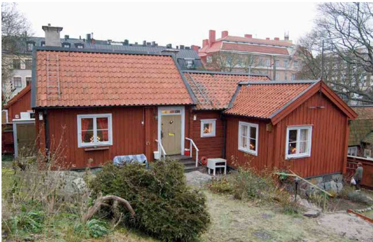
LOTSEN 20 FRÅN GÅRDEN. MITTPARTIET HAR EN OKLÄDD TIMMERSTOMME.