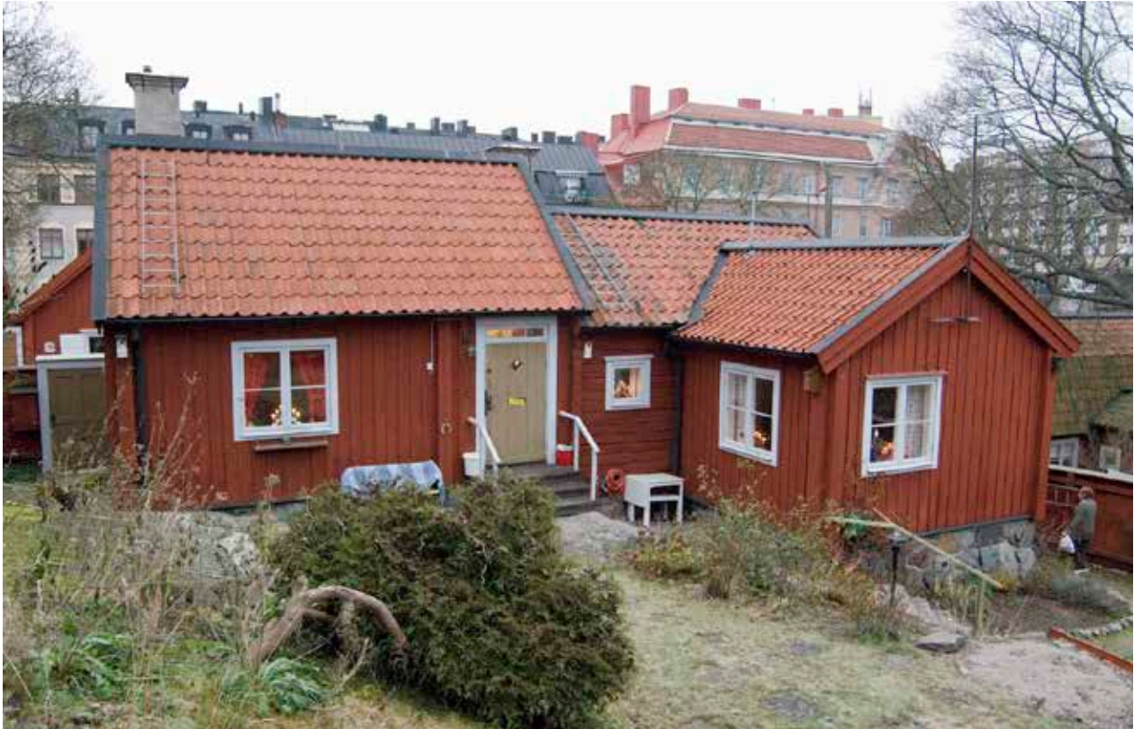
LOTSEN 20 FRÅN GÅRDEN. MITTPARTIET HAR EN OKLÄDD TIMMERSTOMME.

bevarande av några äldre stockholmsmiljöer. Samfundet Sankt Erik föreslog 1915, tillsammans med den då ledande stadsplanarkitekten Per Olof Hallman, att några ”gammelkvarter” i stadens ägo borde bevaras som så kallade asylområden; intakta historiska miljöer som kunde ge en mycket bättre bild av äldre tiders levnadsvillkor än några bevarade träkåkar här och var. Till dessa asyler kunde även andra timmerhus flyttas. En av de föreslagna miljöerna var den ålderdomliga och relativt enhetliga bebyggelsen på Åsöberget. Under 1940-talet intensifierades diskussionerna i kulturresevatsfrågan och Stadsmuseet hävdade att Åsöberget, näst efter Vita Bergen, var det område där det var mest angeläget att inrätta ett reservat. Åsöberget blev först ut att rustas upp efter det formella beslutet i stadsfullmäktige att inrätta kulturresevat 1956.