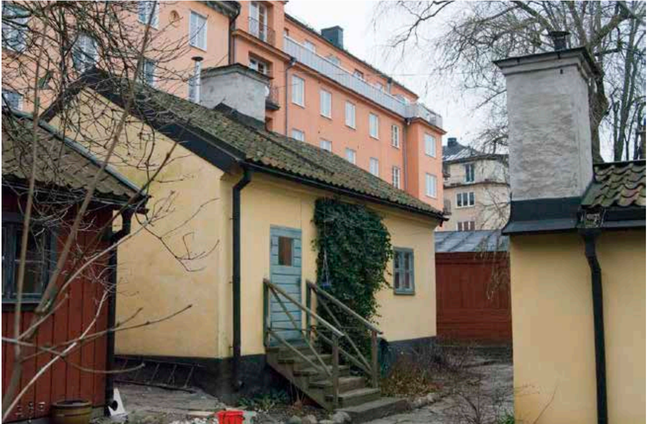
GATHUSET SETT FRÅN GÅRDEN. DÖRRÖPPNINGEN TILLKOM VID RENOVERINGEN 1959 OCH ERSATTE ETT TIDIGARE FÖNSTER.

De två bostadshusen representerar den stenhusbebyggelse som uppfördes i området under tidsperioden sent 1700-tal till 1800-talets mitt.