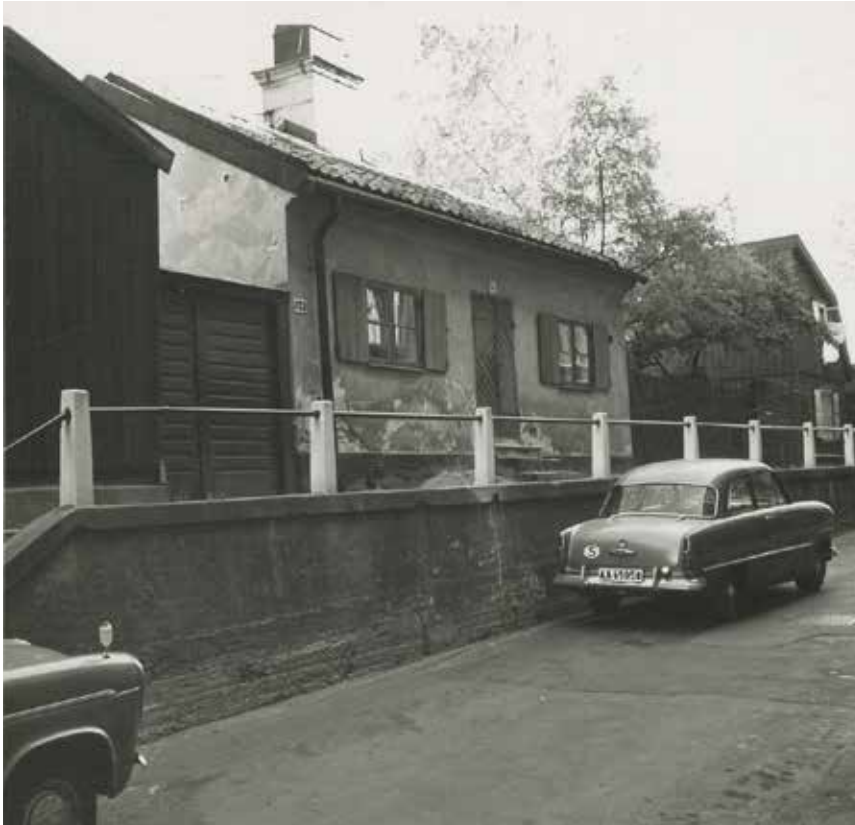
GATHUSET SETT FRÅN ÅSÖGATAN. FOTO: B. ENGLUND 1959. SSM:S ARKIV, F59015.

det område där det var mest angeläget att inrätta ett reservat. Åsöberget blev först ut att rustas upp efter det formella beslutet i stadsfullmäktige att inrätta kulturreseptat 1956.