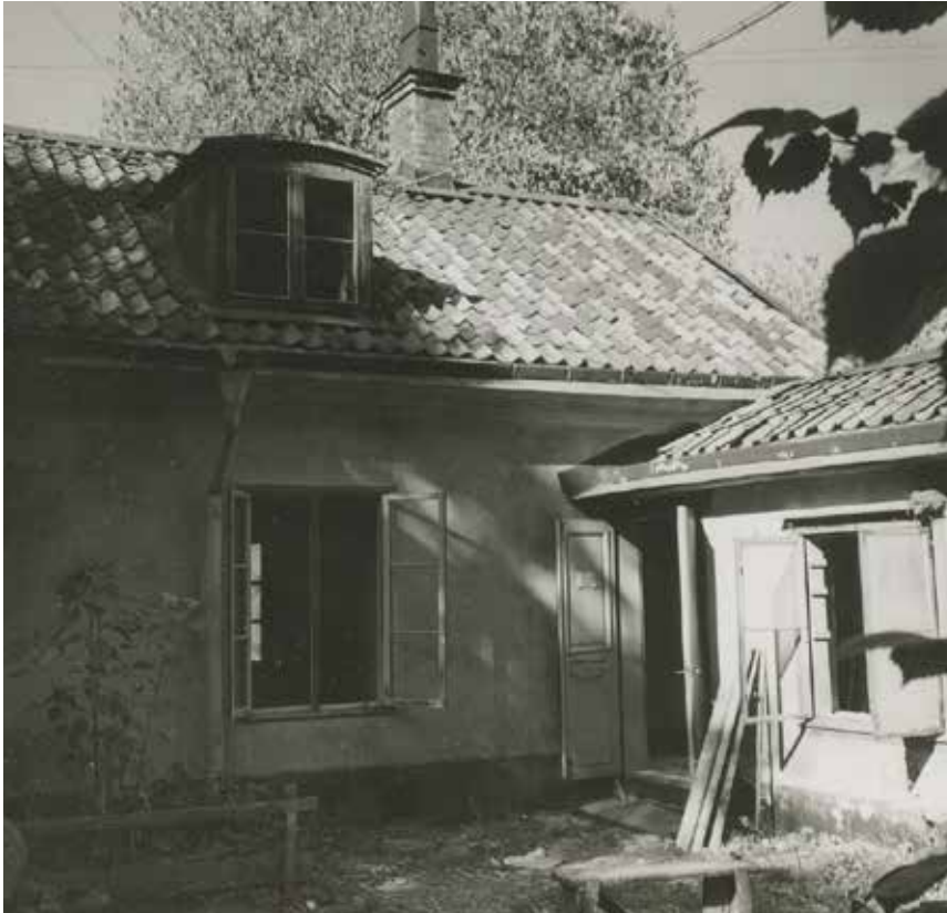
GÅRDSHUSET SETT FRÅN GÅRDEN UNDER RENOVERINGEN 1959.

byggnaderna är belagd med öländsk kalksten och den sluttande tomten har nyligen terrasserats. Gårdshuset är sammanbyggt med en av daghemsbyggnaderna inom grannfastigheten Lotsen 16. Enligt trädgårdsinventeringen 2002 växte bland annat plommon på tomten.