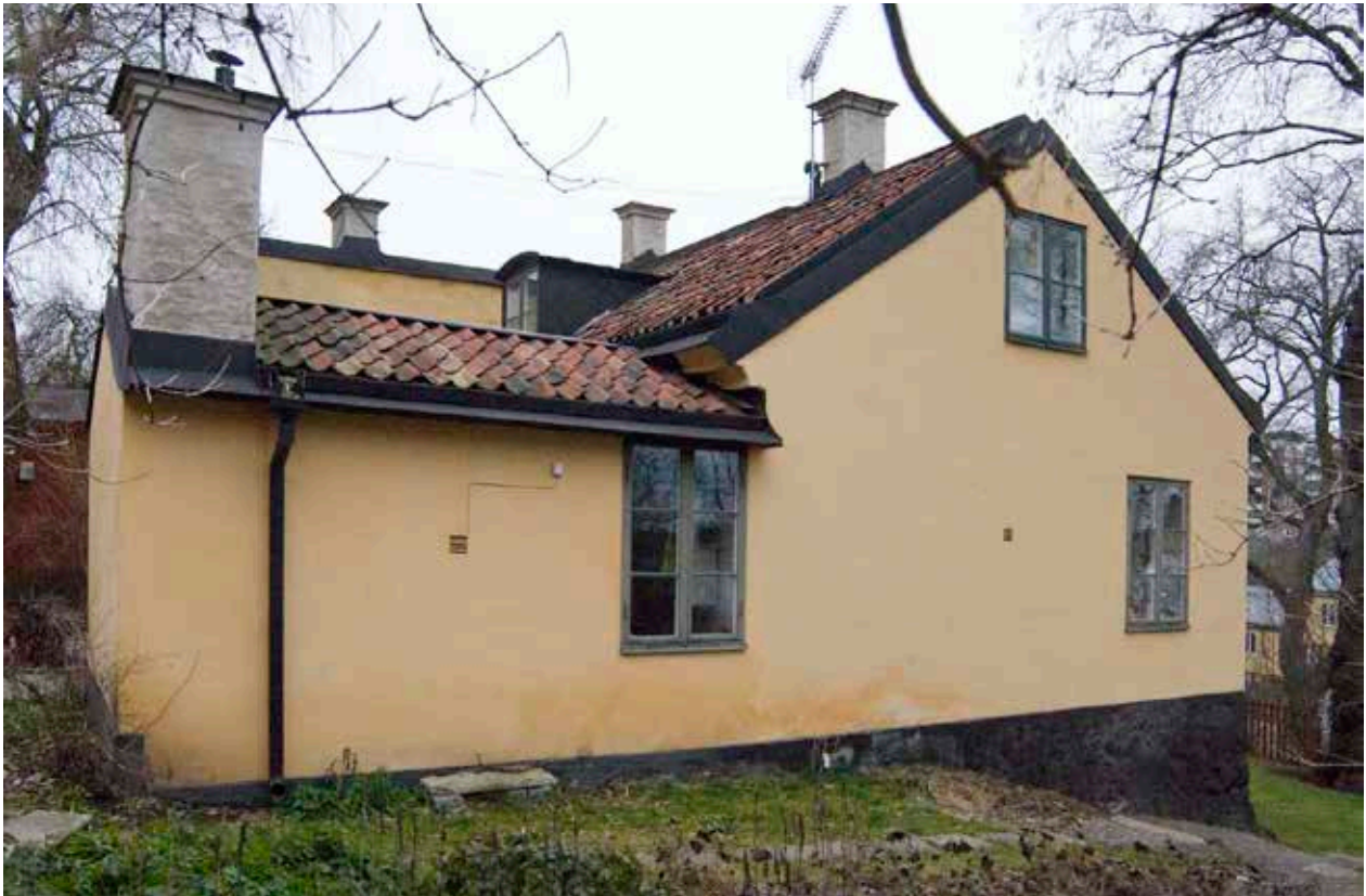
GÅRDSHUSET SETT FRÅN ÖSTER. I FLYGELN LÅG TIDIGARE KÖKET. I DAG FINNS HÄR BADRUM OCH PANNRUM.

med båt nära till arbetet och många bodde i Åsöbergets trästugor. Under 1700-talet tillkom nya yrkeskategorier bland de boende allteftersom flera textilmanufaktur etablerades på östra Södermalm.