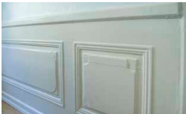
BRÖSTPANEL FRÅN 1760-TALET.