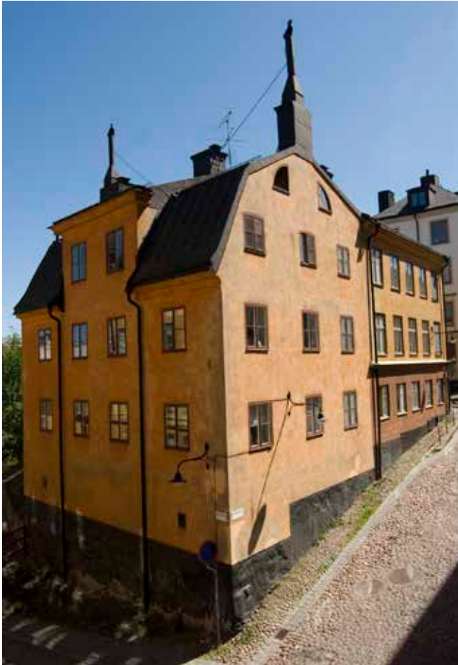
HUSET I HÖRNET BASTUGATAN/BELLMANSGATAN.

ledd av bland annat Anna Lindhagen, ledamot av stadsfullmäktige och Skönhetsrådet.