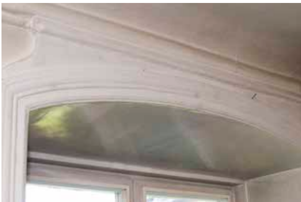
DETALJ AV FÖNSTEROMFATTNING MED ÖVERSTYCKE FRÅN 1760-TALET.