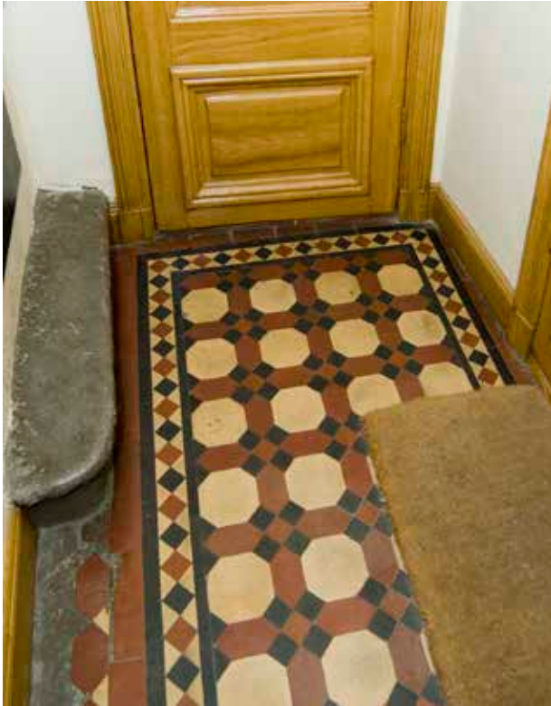
TRAPPHUSET MED GOLV AV MÖNSTRADE "TILES".