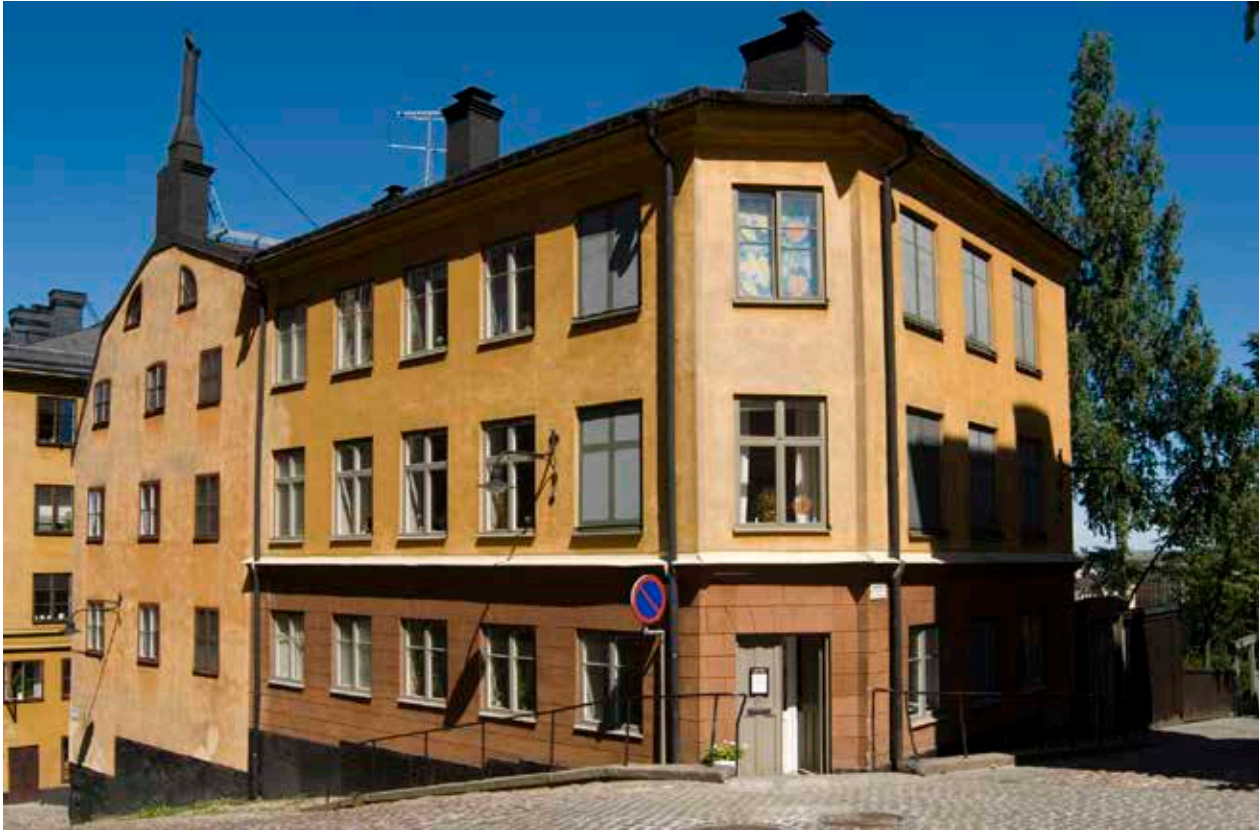
HUSET I HÖRNET TAVASTGATAN/BELLMANSGATAN.