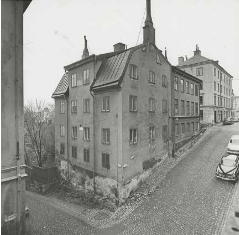
HUSET VID BASTUGATAN FÖRE 1970-TALET'S RENOVERING. HÄR SYNS FORTFARANDE KÄLLARVÅNINGENS BLINDFÖNSTER. FOTO L. AF PETERSENS 1965, SSM F75151.

De båda husen inom fastigheten byggdes under 1700-talets andra hälft respektive 1880. Huset vid Bastugatan har mycket av 1700-talets utformning och karaktär bevarad. I interiören finns inredningsdetaljer som stucklister, snickerier, dörrar och bröstpaneler av hög kvalitet från 1700-talet, en ovanlig och välbevarad kakelugn i rokoko samt en del äldre brädgolv.