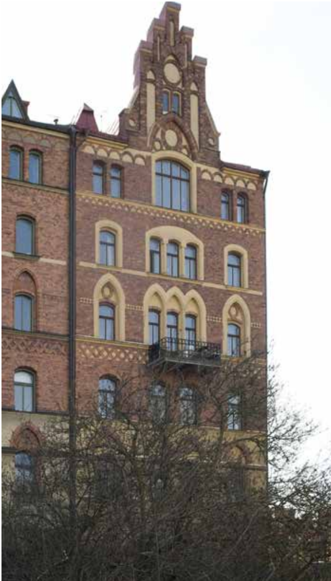
GÅRDSHUSETS DEKORATIVA FASAD MOT RIDDARFJÄRDEN. I FASADEN FINNS DE ARKITEKTONISKA ELEMENT SOM PRÄGLAR TIDSÅLDERN MED TEGEL, MÖNSTERMURNINGAR OCH GOTISKA INSLAG.

branten mot Mälaren på den norra sidan av Bastugatan kom inte att ingå i de tidiga stadsplanerna för området. Liksom på andra håll på Söders berg blev de minst attraktiva och mest svårbebyggda platserna hemvist för enklare folk som här uppförde små timrade byggnader. Delar av området drabbades av den omfattande branden i Maria församling 1759. Endast ett fåtal byggnader finns kvar från tiden före branden.