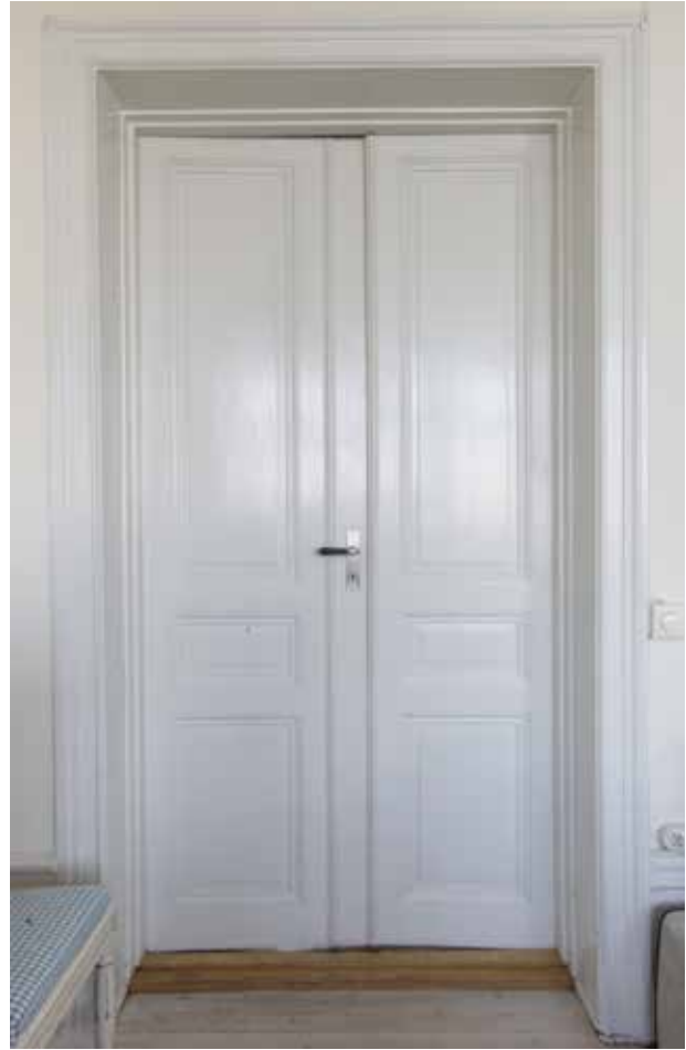
ÄLDRE PARDÖRR MED TRE Fyllningar, samtida profilerade foder och fotpanel.