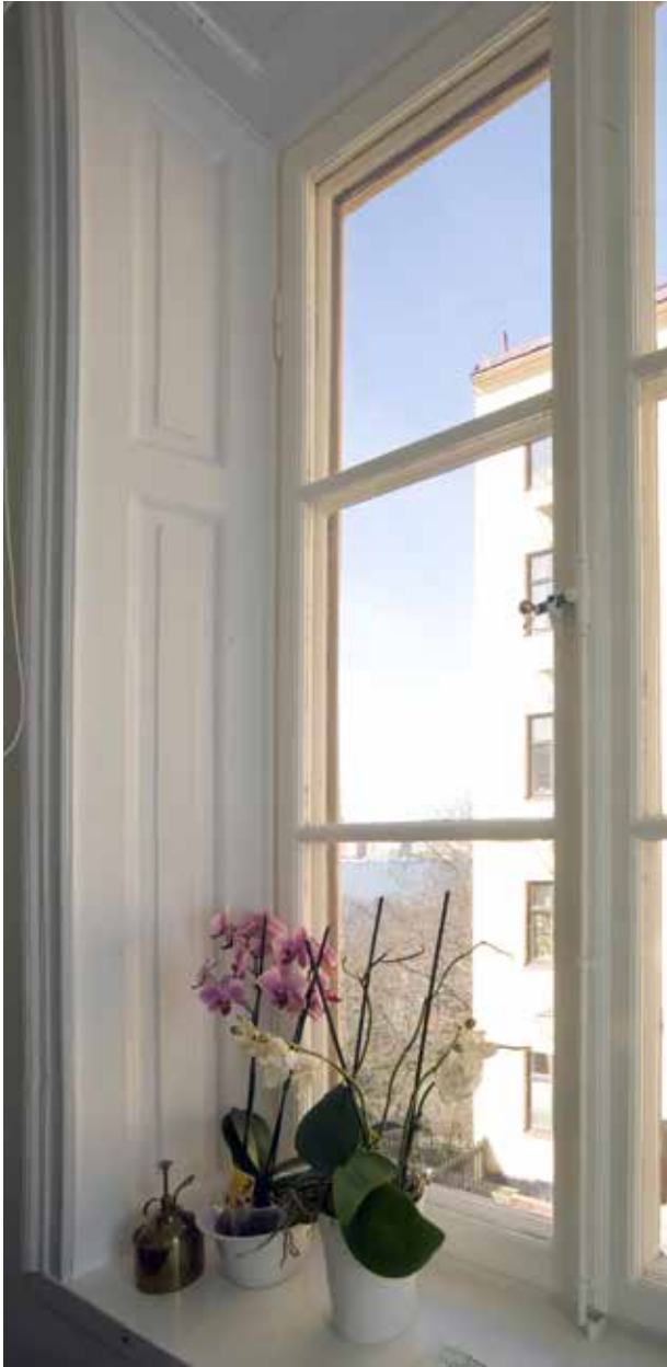
BEVARADE FÖNSTERPANELER OCH FÖNSTER MED SPANJOLETTBESLAG I GATHUSET.