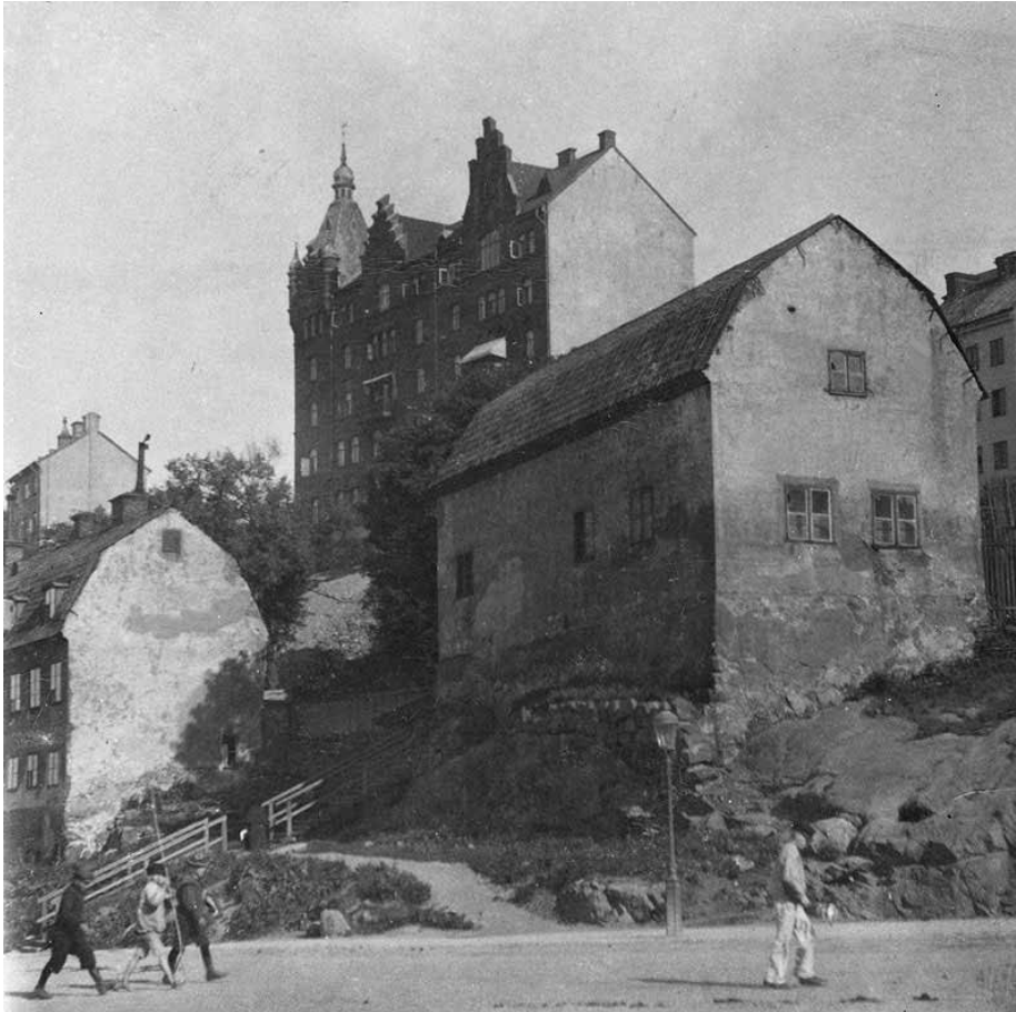
SÖDER MÄLARSTRAND ÖSTERUT FRÅN TORDEL KNUTSSONSGATAN OMKRING SEKELSKIFTET 1900. HUSEN NÄRMAST LÅG VID SLUTET AV LILLA SKINNARVIKSGRÄND. I BAKGRUNDEN SYNS GÅRDSHUSET PÅ KATTFOTEN MINDRE 2. SSMFA0503685.

Kattfoten mindre 2 uppfördes 1889 som hyreshus efter ritningar av Kasper Salin. De två bostadshusen representerar de rådande arkitekturidealen med fasader av puts och tegel, dekorativa gavelrösten och oregelbunden fönstersättning med raka och välvda överstycken.