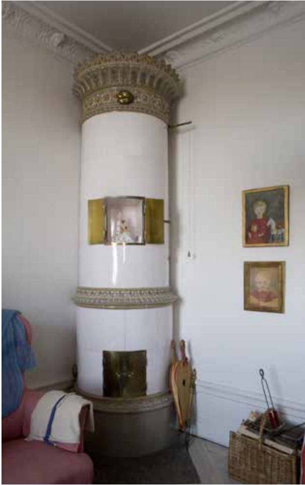
URSPRUNGLIG KAKELUGN I GÅRDSHUSET. I BILD SYNS ÄVEN URSPRUNGLIGT BRÄDGOLV SAMT TAKETS DEKORATIVA STUCKATUR.