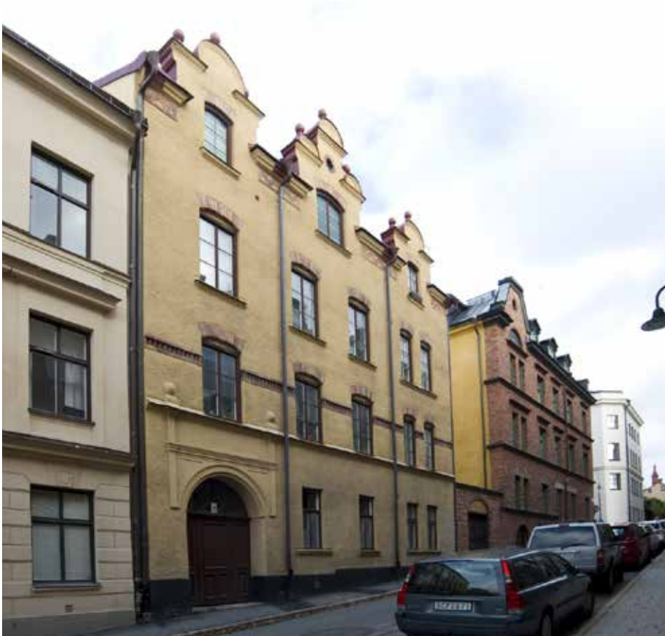
GATHUSETS FASAD MOT GATAN.