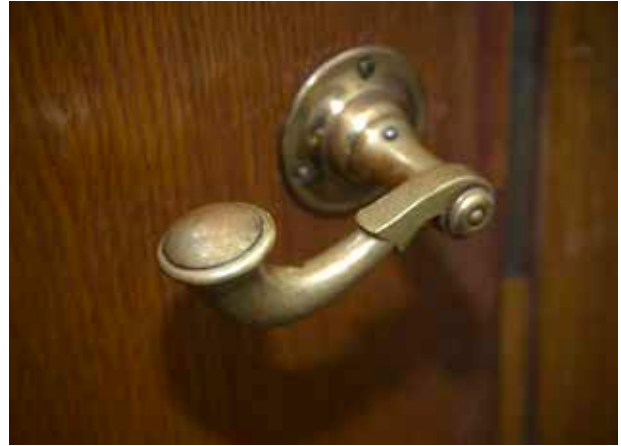
FINT UTFORMAT DÖRRTRYCKE AV MÄSSING FRÅN 1940-TALET.

fyra våningar hög med källare, stomme av korsvirke samt tak av näver och torv. Alla de tolv rum huset innehöll anges ha målade tak. Om skicket nämns ingenting, men andra uppgifter gör gällande att huset 1757 var så förfallet att det saknade dörrar, fönster och kakelugnar.