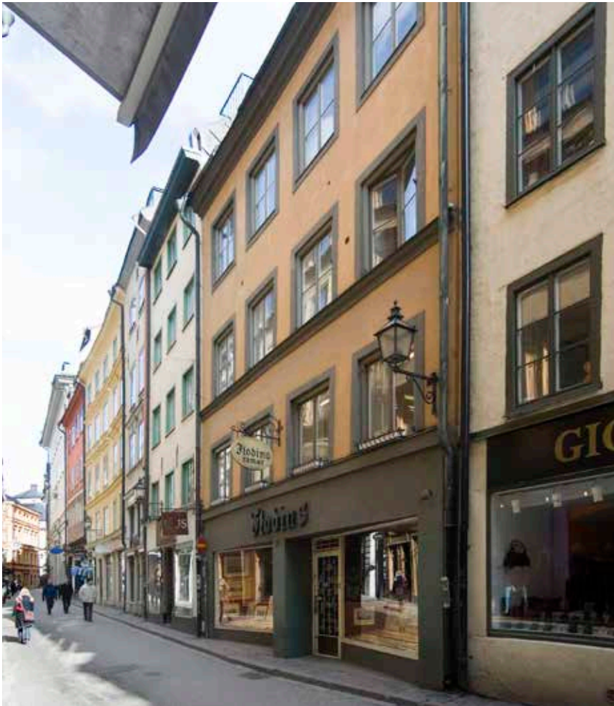
FASADEN MOT VÄSTERLÅNGGATAN.

Byggnaden har anor från medeltiden, och en stor del medeltida murar finns kvar ännu i dag. Fastigheten ligger också där den äldsta stadsmuren en gång låg, vilket innebär att delar av denna kan finnas i huset.