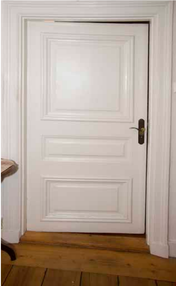
HELFRANSK DÖRR AV 1700-TALSTYP.