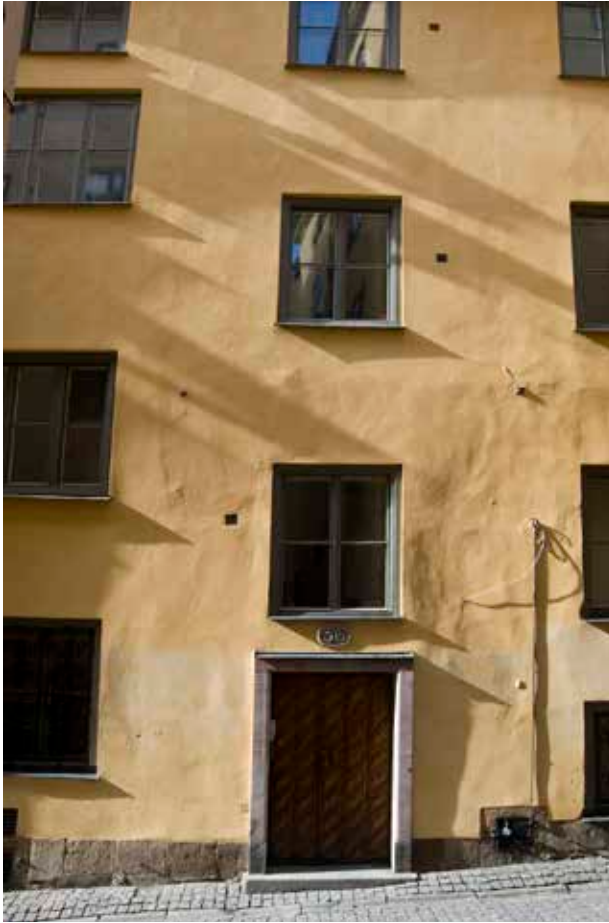
FASADEN MOT PRÄSTGATAN.

murverk bakom senare tiders fasadutformningar och inredningar.