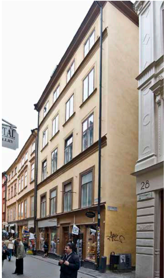
FASAD MOT VÄSTERLÅNGGATAN.

trä eller tegel, ofta med torvtak. Till husen fanns många gånger källare med väggar av natursten och tegelvalv eller bjälktak. Tegelhusens fasader var inte putsade och kunde ha dekor i form av blinderingar, formtegel eller mönstermurning. Den medeltida, oregelbundna stadsplanen är ännu i dag mycket väl bevarad och många hus har i hög utsträckning kvar medeltida murverk bakom senare tiders fasadutformningar och inredningar.