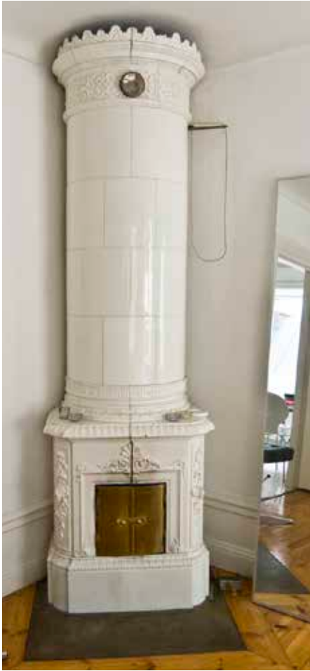
KOLONNKAKELUGN FRÅN 1800-TALET MITT.