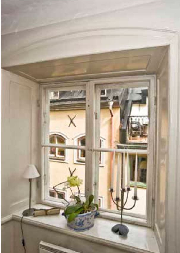
STICKBÄGIG FÖNSTERÖPPNING MED STENPROFILERADE PANELER FRÅN 1800-TALET.