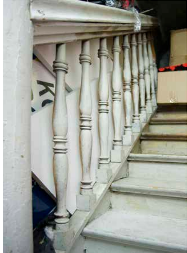
MELLAN BOTTENVÅNINGEN OCH VÅNING 1 TRAPPA FINNS I EN AV BUTIKERNA EN TRAPPA MED SVARVAT TRÄRÄCKE. TRAPPAN TILLKOM UNDER SENT 1800-TAL.

av Iphigenia 1. Över Yxsmedsgränd i söder finns en grändöverbyggnad som idag tillhör grannen Ulysses 5. Delar av överbyggnaden har periodvis tillhört den södra delen av Iphigenia 1.