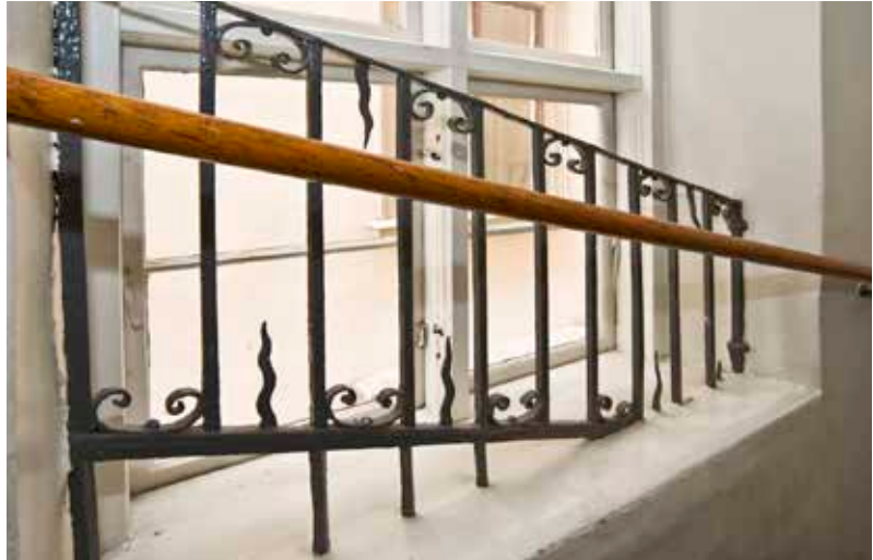
DET SMIDDA RÄCKET I TRAPPLOPPET ÄR FÖRMODLIGEN FRÅN 1700-TALET.

successivt förslummas och många diskussioner fördes om stadsdelens sanitära förhållanden. Det kom till och med förslag om att riva stora delar och bygga helt nytt. När de nya stadsdelarna på malmarna växte fram omkring 1900 blev problemen i Gamla stan ännu mer uppenbara, men de enskilda fastighetsägarna var inte villiga att bekosta saneringarna. Samfundet S:t Erik – som bildades 1901 och arbetade för att väcka intresse för stadens kulturhistoriskt värdefulla miljöer – oroades för stadsdelens framtid och tog på 1930-talet initiativet till att bilda AB Stadsholmen. Det nya bolaget fick i uppdrag att förvärva, restaurera och modernisera bebyggelsen med hänsyn bland annat till kulturhistoriska värden. De första åtgärderna i stor skala genomfördes i kvarteret Cepheus och flera av de genomförda renoveringarna har varit goda exempel, inte minst de allra första insatserna som gjordes.