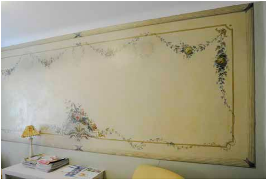
VÄGGMÅLNINGEN PÅ ANDRA VÅNINGENS VILPLAN ÄR GJORD 1935 AV C. P. STACKELL MED UTGÅNGSPUNKT FRÅN DE VÄVTAPETER SOM FANNS PÅ VINDSVÅNINGEN OCH SOM TOGS NER PÅ 1950-TALET.

genom huset. Andra våningen innehöll en liknande korridor och fjorton rum med eldstäder och panelklädda tak medan nedre vinden hade en rymlig sal och åtta kammare. Det brutna taket var lagt med tegel och hade tio vindskupor, fem på varje långsida.