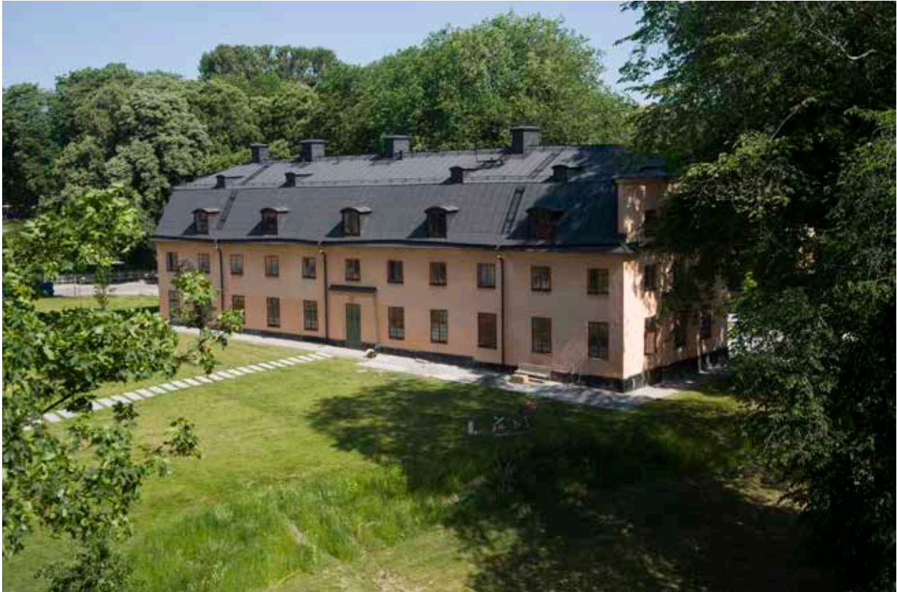
KATARINAHUSET HAR EN TIDSTYPISK UTFORMNING MED SLÄTTPUPTSADE FASADER, SMÅSPRÖJSADE FÖNSTER OCH ETT BRUTET TAK. DET URSPRUNGLIGA TAKTEGLET HAR SENARE ERSATTS AV PLÅT.

som 1709 köpte södra delen av Rörstrands ägor – som då låg utanför den tätbebyggda staden – där tegelbrukets gamla lertag nu var vattenfyllda dammar. Sabbath, som var en framgångsrik källarmästare, uppförde här ett vårdshus som stod färdigt 1717. Det enda som finns kvar är delar som ingår i nuvarande Sabbatsbergs kyrka. Efter Sabbaths död 1720 passerade ett antal privata ägare innan Stockholms stads fattighusdirektion köpte fastigheten 1751 för att ordna fattigvården i nuvarande Gamla stan. Här skulle enligt beräkningar 300 personer tas om hand och fattighusdirektionen insåg snart att de befintliga byggnaderna från vårdshusrörelsen var alldeles för små för att rymma alla dessa.