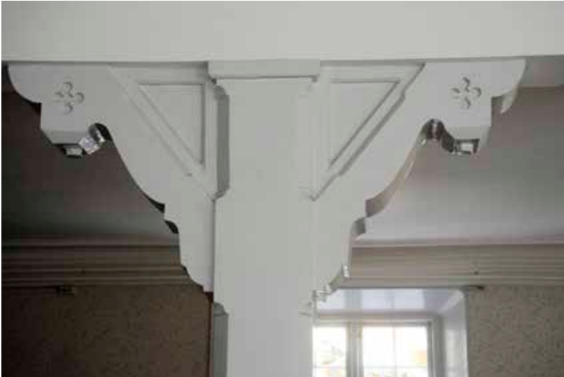
EN DEKORERAD PELARE I BOTTENVÅNINGENS SÖDRA RUM, TROLIGEN TILLKOMMEN VID RENOVERINGEN 1879.