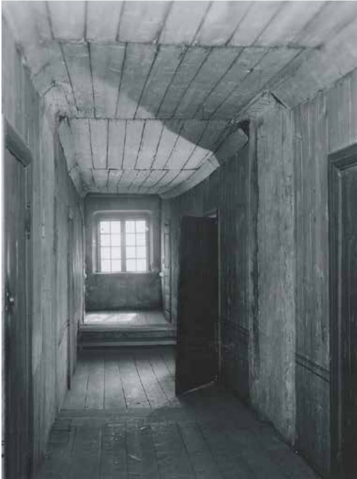
DEL AV VINDSVÅNINGENS KORRIDOR SOM DEN SÅG UT PÅ 1950-TALET NÄR DEN FORTFARANDE HADE EN VÄLBEVARAD 1700-TALSKARAKTÄR. FOTO G. BAUER 1954, SSM F47558.

De äldsta delarna av Sabbatsbergsområdet är en säregen miljö med en sällsam historia i det som nu är Stockholms innerstad. Här har fattiga stadsbor varit inhysta i institutionsbyggnader som har legat sida vid sida med mer förmögna brunnsvärdars boende.