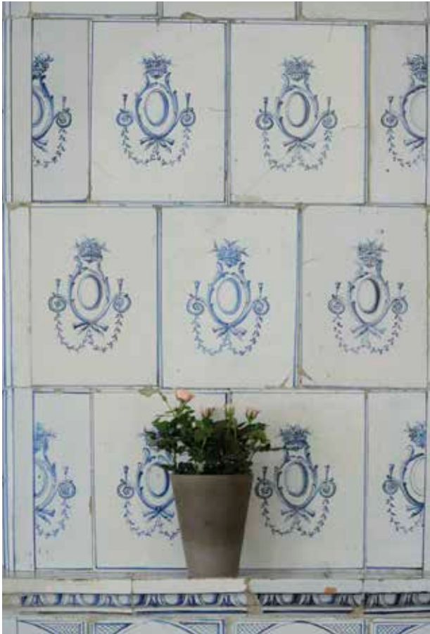
KAKELUGNEN I BOTTENVÅNINGENS SÖDRA RUM MED MÖNSTER I BLÅTT OCH VITT ÄR FRÅN 1700-TALET OCH DEPONERAD UR STADSMUSEETS SAMLINGAR.