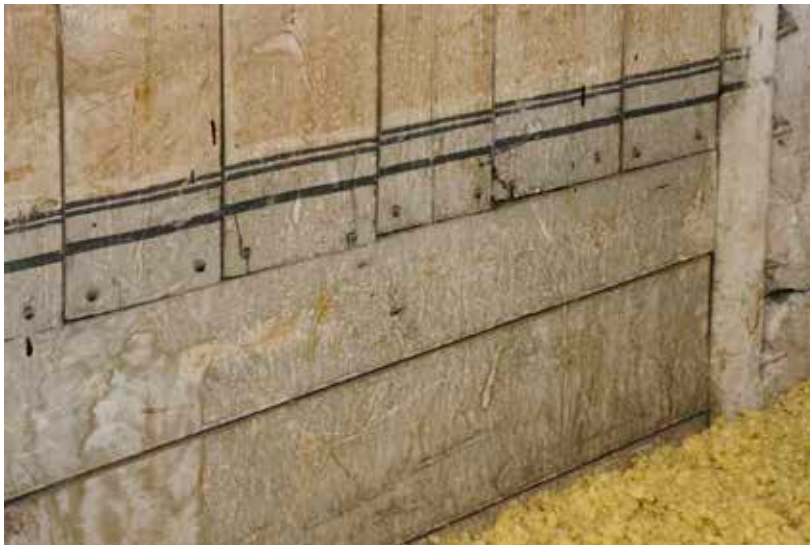
ÄLDRE VÄGGMÅLNING I VINDSVÅNINGEN.

levereras på flaska till Sabbatsberg ända tills brunnsverksamheten helt upphörde 1968. I dag finns inte mycket kvar som påminner om den här verksamheten. Brunnshus, brunnpaviljong, lasarettet och andra byggnader har rivits. Kvar finns egentligen bara Katarinahuset som ursprungligen byggdes som vårdshus för brunnsgästerna.