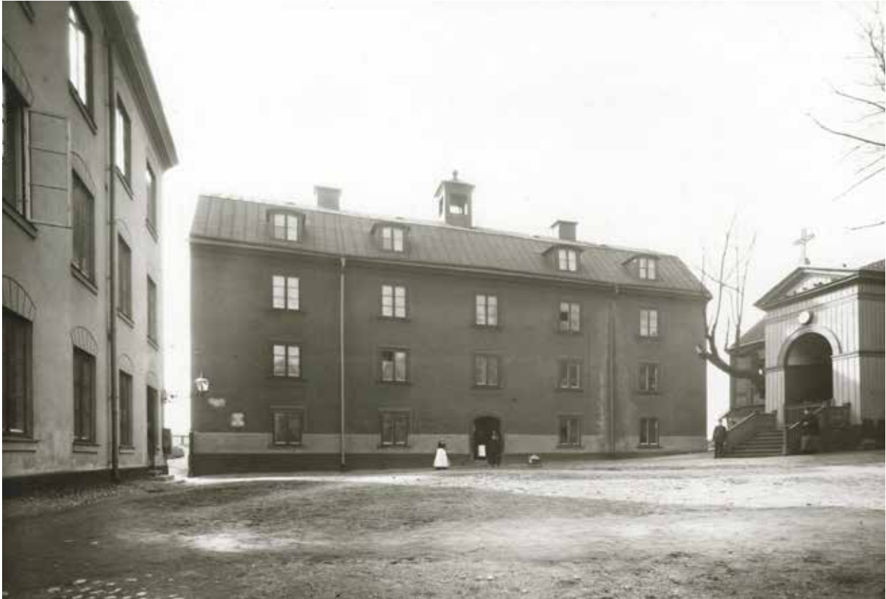
NICOLAIHUSET PÅ ETT FOTOGRAFI FRÅN OMKRING SEKELSKIFTET 1900. FASADEN HADE DÅ EN MÖRKARE FÄRGSÄTTNING ÄN I DAG OCH DEN MITTERSTA TAKKUPAN SAKNAS.

De äldsta delarna av Sabbatsbergsområdet är en säregen miljö med en sällsam historia i det som nu är Stockholms innerstad. Här har fattiga stadsbor varit inhysta i institutionsbyggnader som har legat sida vid sida med mer förmögna brunnsgästers boende.