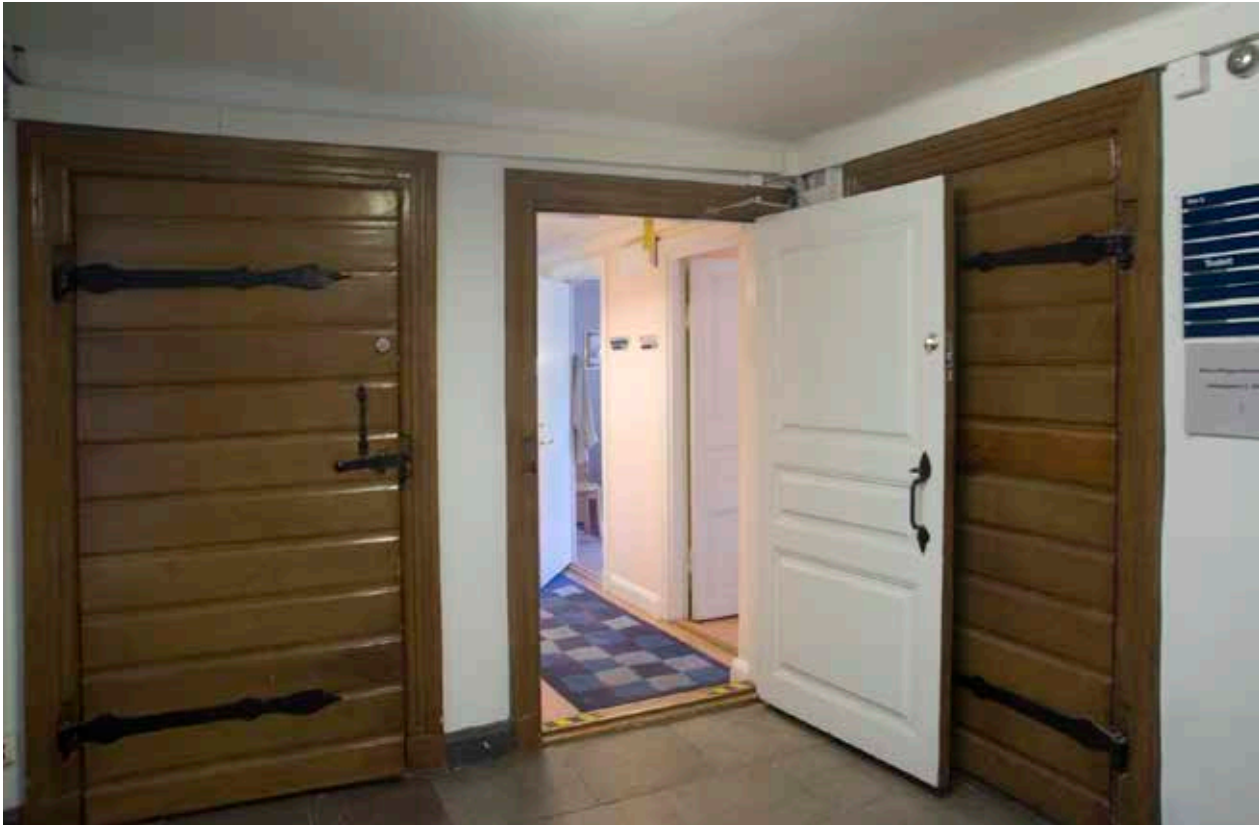
ETT AV TRAPPHUSETS VILPLAN MED SINA KARAKTÄRISTISKA ÄLDRE DÖRRAR OCH DÖRRFODER. INREDNINGEN I RUMMEN INNANFÖR ÄR HUVUDSAKLIGEN FRÅN 1900-TALET'S ANDRA HÄLFT.

kläder vilket naturligtvis ökade skamkänslan.