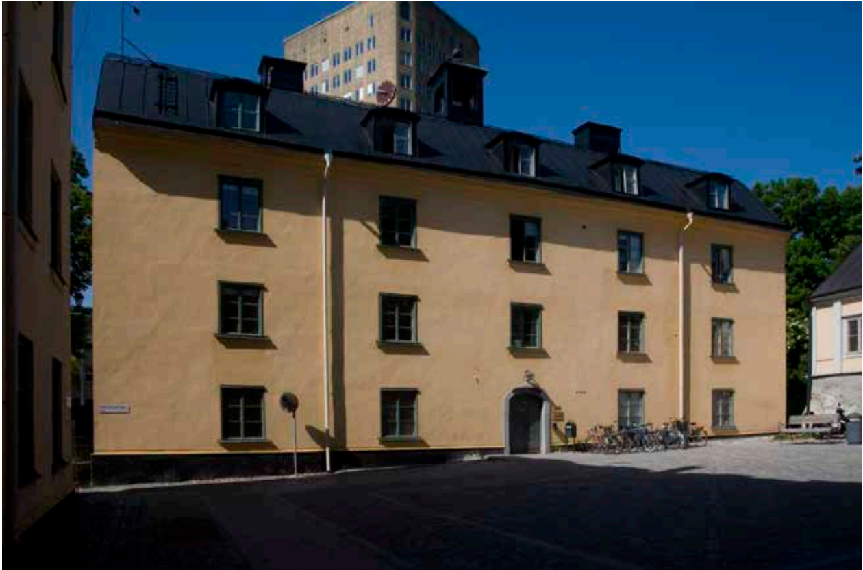
NICOLAIHUSETS HUVUDFASAD MED SIN VÄLBEHÅLLNA 1700-TALSKARAKTÄR. PÅ TAKET SKYMTAR DET LILLA KLOCKTORNET FRÅN BYGGNADSTIDEN.