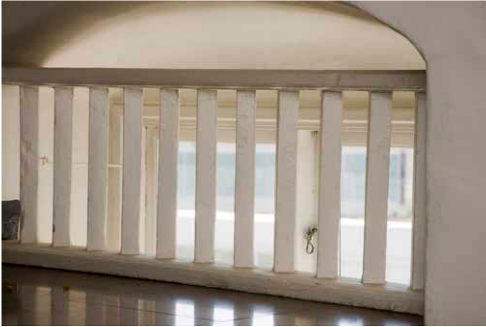
RÄCKE FÖR FÖNSTER I TRAPPHUSET AV EN TYP SOM VAR VANLIG PÅ 1700-TALET.

köket från 1890 och portvaksstugan från början av 1900-talet. De kvarvarande äldre husen förvärvades av Stadsholmen 2010. Lokalerna används huvudsakligen för sociala verksamheter.