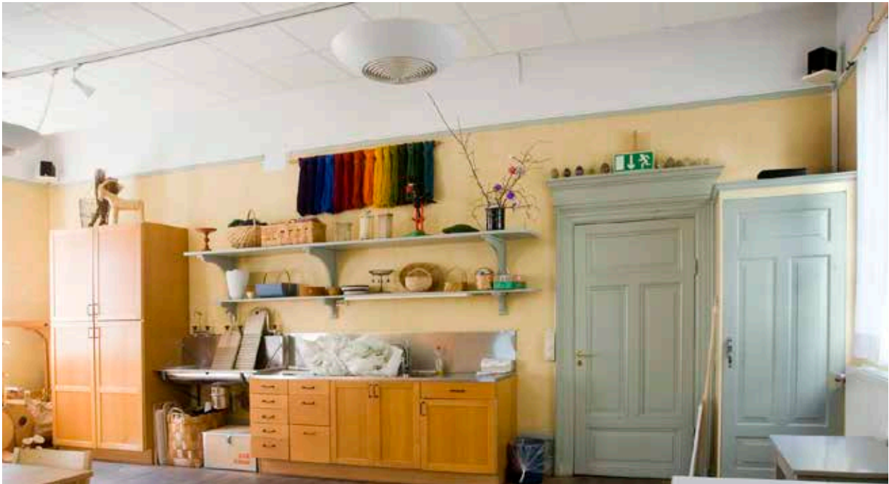
DET GAMLA GRAVKAPELLET OCH BÅRHUSET I HUSETS ÖSTRA DEL HAR INTE LÄNGRE KVAR SIN FUNKTION MEN HÄR FINNS BL.A. DÖRRAR OCH NÅGRA HYLLOR KVAR FRÅN DEN TIDEN.