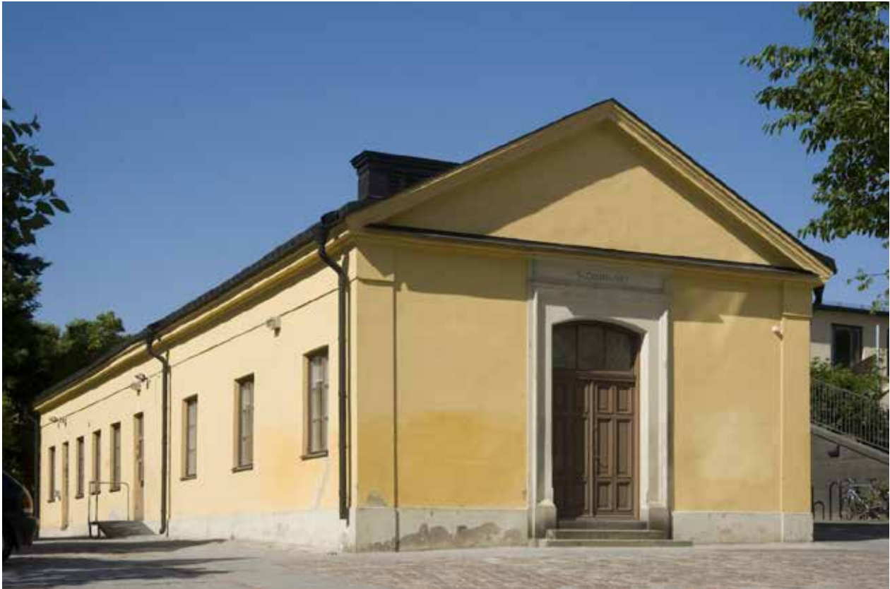
FÖNSTREN PÅ SÖDRA FASADEN VAR URSPRUNGLIGEN DÖRRAR SOM LEDDE TILL DE OLIKA RUMMEN. DÖRREN MED ÖVERLJUSFÖNSTER OCH PUTSAD OMFATTNING PÅ GAVELN ÄR FRÅN 1880-TALET OCH LEDDE DÅ TILL DET NYINREDDA GRAVKAPELLET OCH BÅRHUSET. ÖVER DÖRREN HAR SENARE MÅLATS "SLÖJDHUSET".