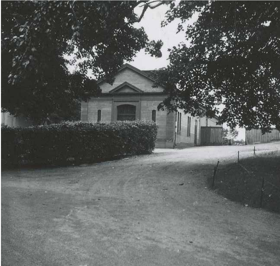
ÖSTRA GAVELN 1937. VID DEN TIDEN FANNNS ETT LITET GAVELFÄLT OVANFÖR ENTRÉN OCH SMALA FÖNSTERÖPPNINGAR PÅ VAR SIDA.

De äldsta delarna av Sabbatsbergsområdet är en säregen miljö med en sällsam historia i det som nu är Stockholms innerstad. Här har fattiga stadsbor varit inhysta i institutionsbyggnader som har legat sida vid sida med mer förmögna brunnsvärders boende.